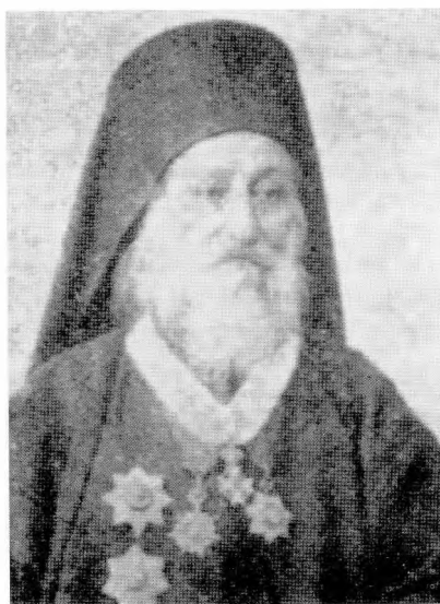
Ο Μητροπολίτης Κωνσταντίος (Ισαακίδης)

Το Β' μέρος του έργου αφορά στα Κοινοτικά πράγματα στη Νάουσα κατά την περίοδο της αρχιερατείας του Μητροπολίτη Κωνσταντίου, ο οποίος διαδέχθηκε τον Κοσμά στο θρόνο της Μητροπόλης Βεροίας & Ναούσης (1895-1906). Μετά την παράθεση ενός