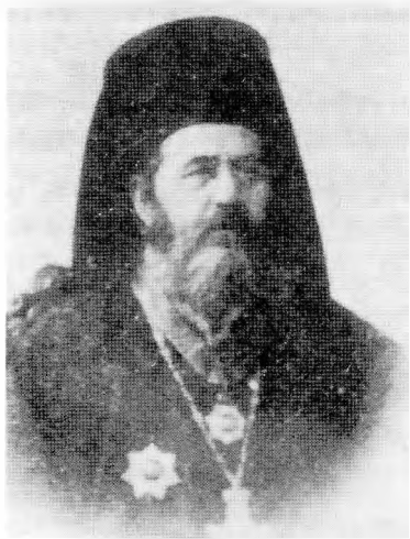
Ο Μητροπολίτης Κοσμάς (Ευμορφόπουλος)