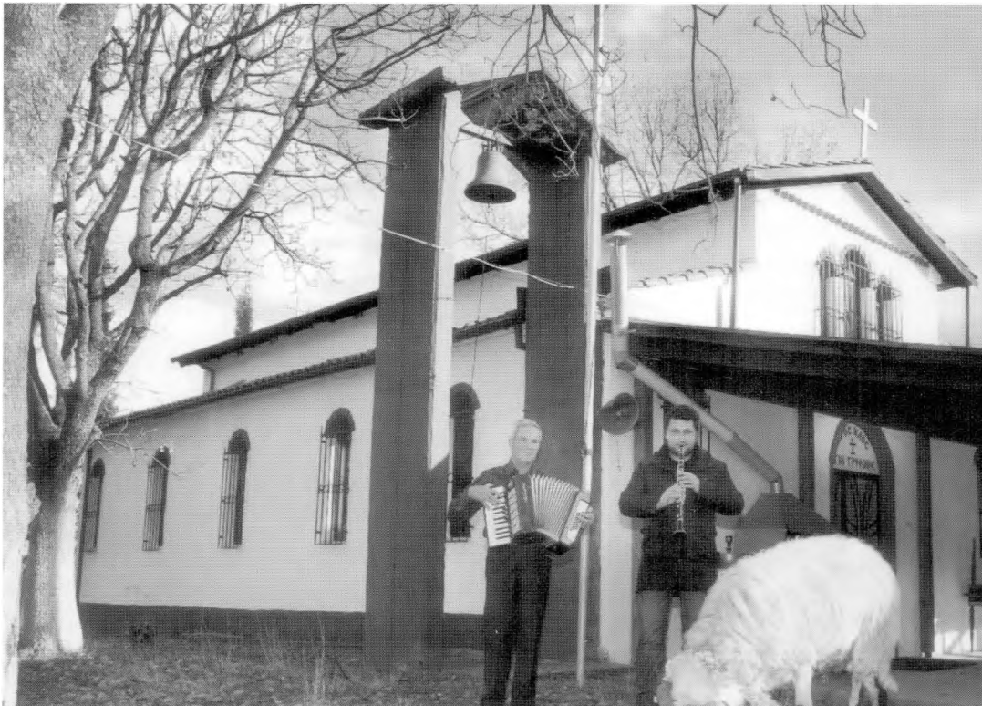
Στενήμαχος Ημαθίας 2010. Αναβίωση του εθίμου. Το ζώο (χριάρι) με τη συνοδεία μουσικών οργάνων οδηγήθηκε στον περίβολο της εκκλησίας του Αγίου Τρύφωνα, μετά την περιφορά του στους δρόμους του χωριού.

Αυτά τα διονυσιακά, λοιπόν, έβλεπε η επίσημη