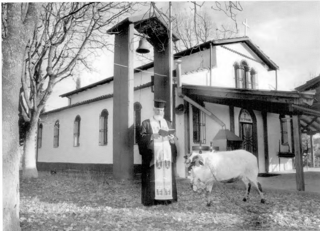
Ο ιερέας ευλογεί το ζώο, λίγο πριν τη θυσία του.