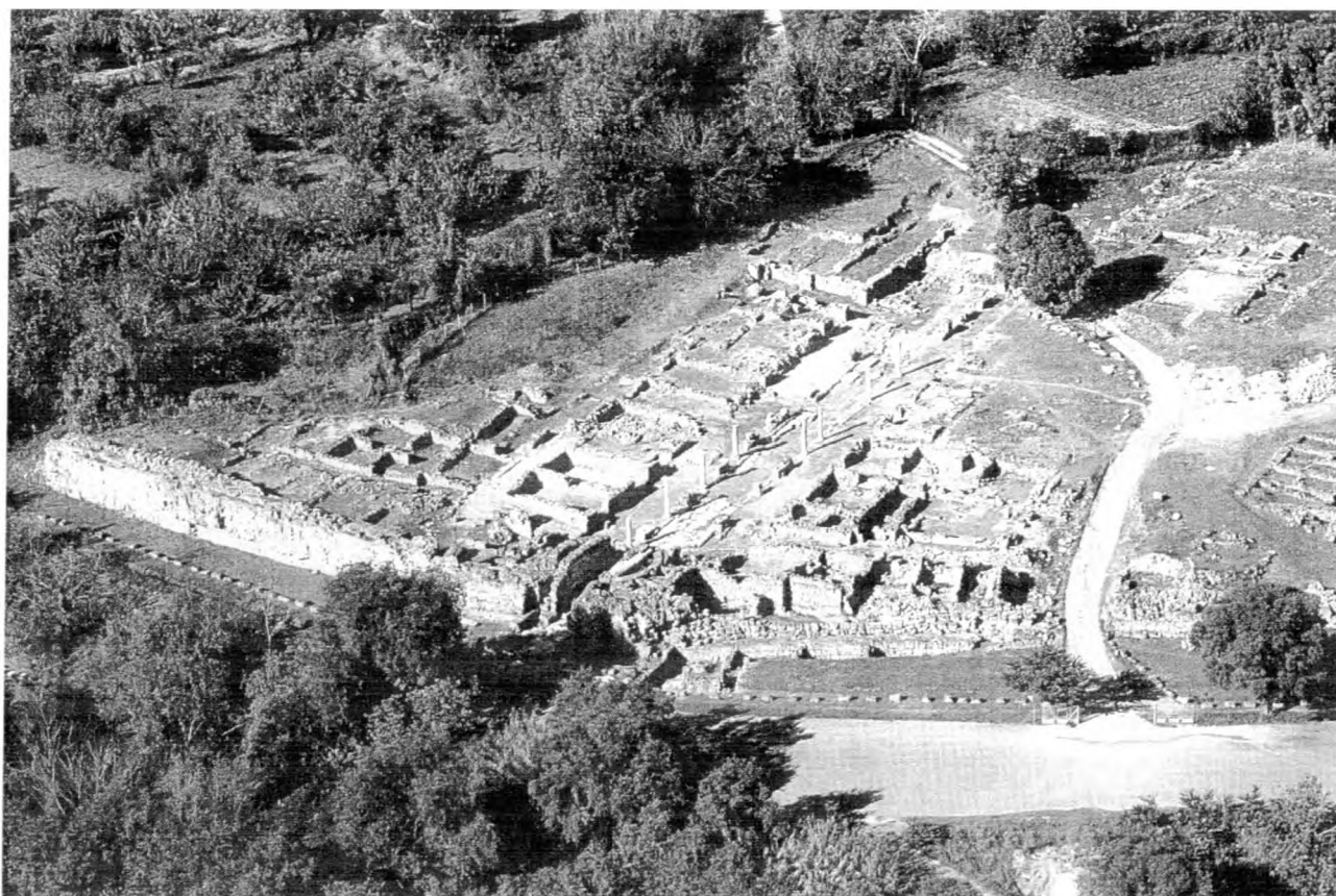
CE επισκέψιμος αρχαιο 353ογικός χώρος της Έδεσσας

Το κεφάλαιο των αυτοκρατορικών χρόνων (1 ος - 3 ος αι. μ.Χ.) αναφέρει πάλι την Σκύδρα και ευρήματα στα γειτονικά Λουτροχώρι, Σεβαστιανά και Αρσένι καθώς και οικισμούς Β.Δ. της Έδεσσας, αλλά και ευρήματα της αρχαίας πόλης που συνεχίζει την ύπαρξη της. Στους ρωμαϊκούς χρόνους η Έδεσσα είχε δικαίωμα κοπής νομισμάτων με το πορτραίτο του αυτοκράτορα εμπρός και αιγοειδείς απεικονίσεις (!) στον οπισθότυπο (μερικές φορές), με φυσικούς συνειρμούς στην ιστορία της Μακεδονίας. Ως δεύτερο (μετά την Έδεσσα) μεγάλο οικιστικό κέντρο της περιοχής, η συγγραφέας, με βάση τις ως τώρα έρευνες, προσδιορίζει την Σκύδρα.