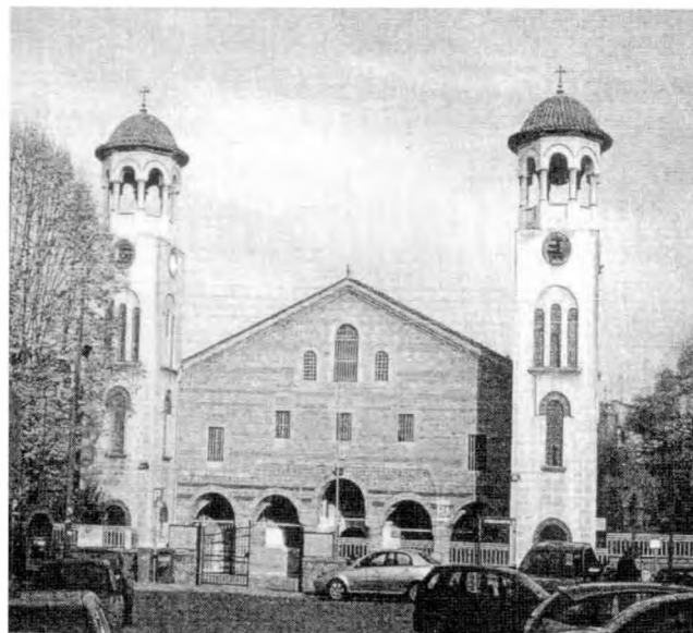
Ο Άγιος Αντώνιος Βέροιας

Το βιβλίο αναφέρεται σε δημοσιεύματα του συγγραφέα στις εφημερίδες «Βέροια», «Λαός» και «Φρουρός της Ημαθίας», που έχουν σχέση με την εκπαιδευτική δραστηριότητα της τοπικής εκκλησίας στα χρόνια της τουρκοκρατίας, ιστορικά στοιχεία που αφορούν τη Βέροια και την περιοχή της, με επώνυμους (ιερείς, δασκάλους, μακεδονομάχους) και την προσφορά τους