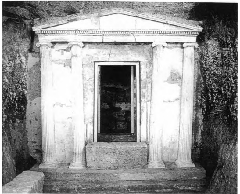
Μακεδονικός τάφος της Πέλλας

Το συμπέρασμα είναι ότι τα ευρήματα επιβεβαιώνουν τη διέλευση από τον οδικό αυτό άξονα της ρωμαϊκής Εγνατίας οδού, η οποία κατά τους ιστορικούς χρόνους πήρε την ονομασία Βασιλική οδός, γιατί συνέδεε την πρωτεύουσα Πέλλα με τις υπόλοιπες πόλεις του μακεδονικού βασιλείου ή όπως ισχυρίζονται άλλοι, επειδή συνέδεε τις δύο πρωτεύουσες του μακεδονικού βασιλείου Πέλλα (η νεότερη) και Αιγές (η προηγούμενη), οπότε πρέπει να δεχθούμε τις Αιγές δίπλα στην Έδεσσα. Μήπως τότε το ανάκτορο στη Βεργίνα είναι των ελληνιστικών χρόνων; Και γιατί ονομάστηκε Εγνατία η διαδρομή Κλειδί-Κουλούρα- Κοζάνη; Για να είμαστε κοντινότερα στη Βεργίνα και να αποδείξουμε ότι εκεί είναι οι Αιγές;