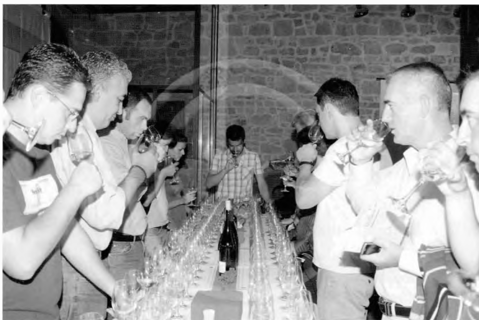
Οργανωμένη γευσιγνωσία κρασιών

Ο αθλητικός τουρισμός ανήκει στις μορφές εκείνες που έχουν και ιδεολογικό περιεχόμενο, το «αθλητικό ιδεώδες» και επειδή κατά κανόνα οι συμμετέχοντες σ' αυτόν είτε ως αθλητές, είτε ως θεατές, έρχονται σε επαφή με το ύπαιθρο, με τη φύση, έχουν μια ιδιαίτερη ευαισθησία προς το περιβάλλον. Υπάρχουν κέντρα και στην Ελλάδα, όπου η οργάνωση αθλητικών συναντήσε-