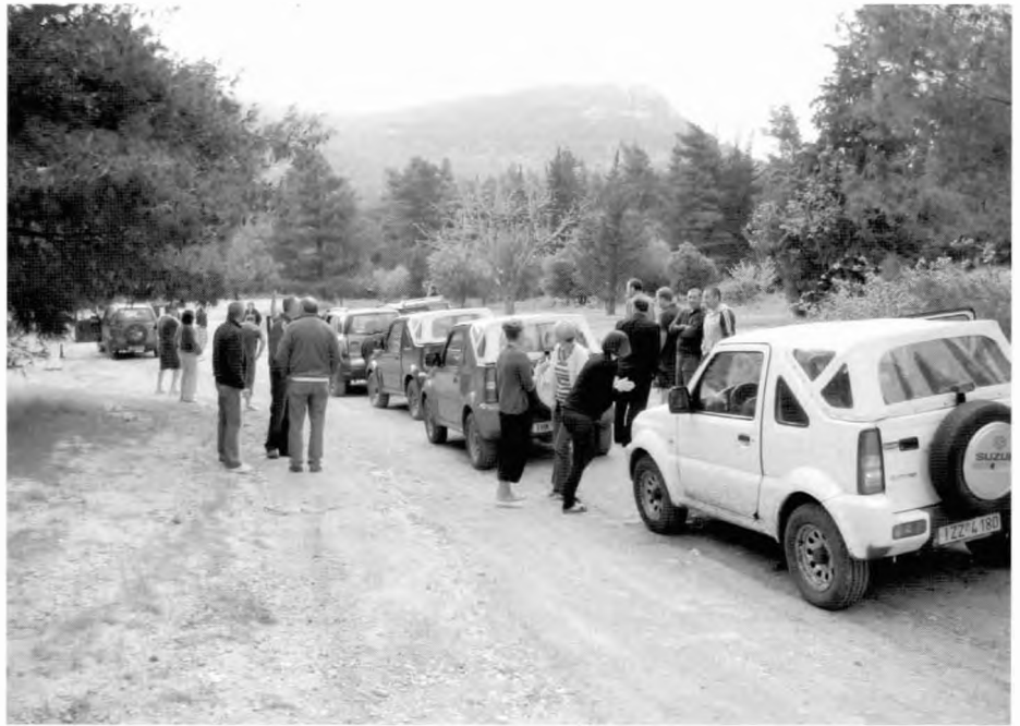
Ομάδα με τετράτροχα 4X4 έτοιμη για εξερευνησεις

έχουμε να κάνουμε με μία ποικίλη προσφορά, ζήτηση και κατανάλωση πόρων, οι οποίοι αποτελούν μέρος της αγροτικής, παραγωγικής και κοινωνικής δομής και τμήμα του αγροτικού τοπίου και περιβάλλοντος. Επίσης στον ίδιο χώρο συνυπάρχουν, συχνά ασύνδετες μ' αυτόν, μορφές τουριστικής δραστηριότητας και προσφοράς (υποδομή και υπηρεσίες) αστικού χαρακτήρα.