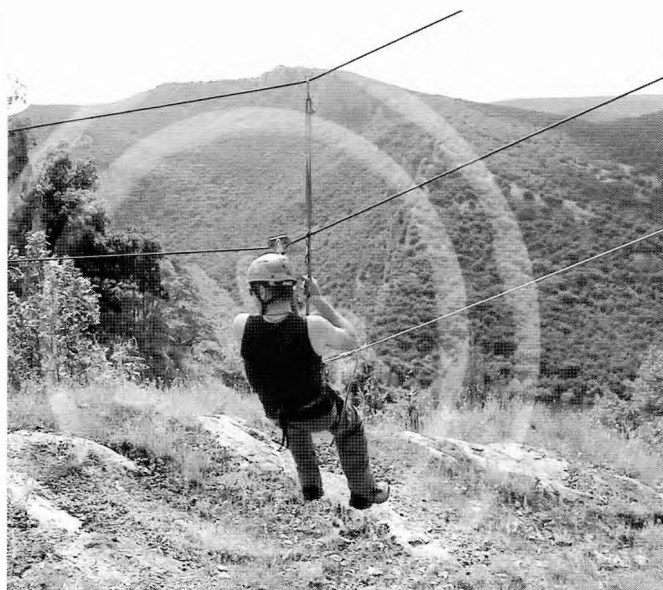
Εναέριο πέραςμα (rappel)