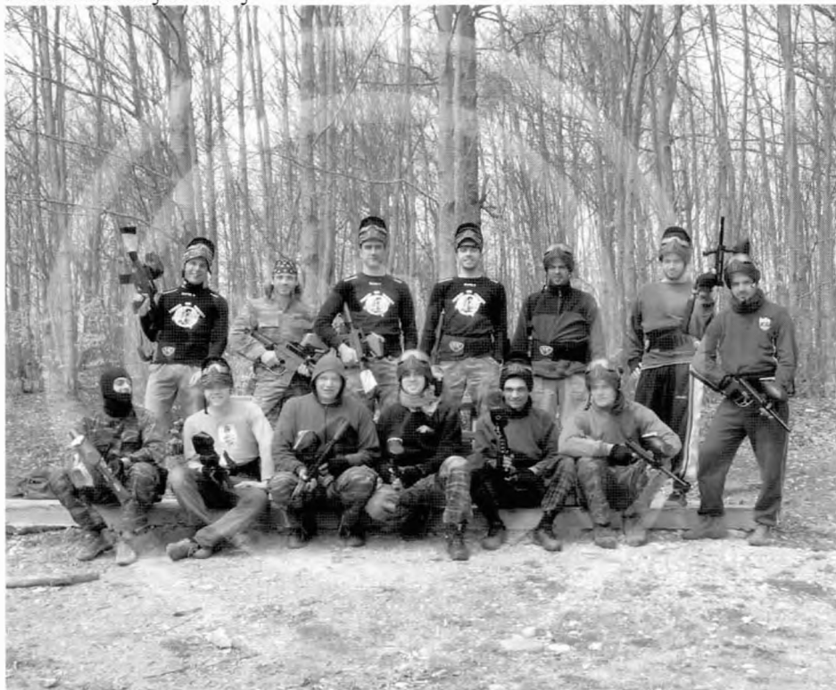
Ομάδα paintball στο δάσος