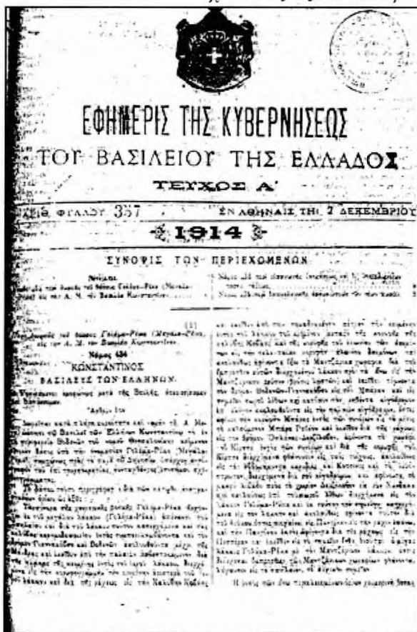
Το φύλλο της εφημερίδας της Κυβερνήσεως όπου δημοσιεύεται ο νόμος της δωρεάς

Ο παρών νόμος ψηφισθείς υπό της Βουλής και παρ Ημών σήμερα κυρωθείς δημοσιευθήτω