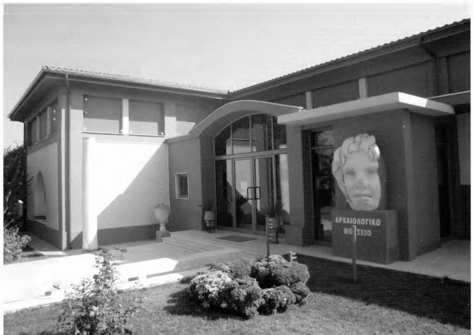
Η είσοδος του αρχαιολογικού μουσείου Βέροιας