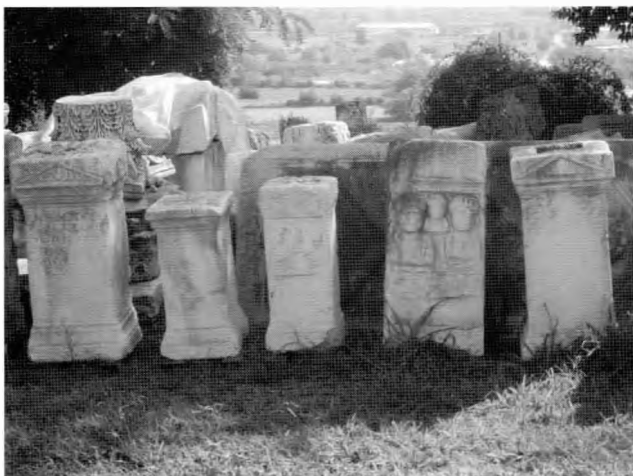
Αναθηματικές στήλες στον εξωτερικό χώρο του μουσείου

γανώθηκε το 1965 και έκτοτε δεν έχει ανανεωθεί ή εμπλουτιστεί το υλικό της. Χρονικά περιορίζεται στους ελληνιστικούς και ρωμαϊκούς χρόνους (δεν υπάρχει ενότητα για την προϊστορική εποχή στο Νομό Ημαθίας).... Η επανέκθεση του υλικού θα έχει στόχο την αντιπροσωπευτικότερη κατά το δυνατόν παρουσίαση του αρχαιολογικού πλούτου της Βέροιας απ' όλες τις χρονικές περιόδους, λαμβανομένου υπόψη του περιορισμένου διαθέσιμου χώρου».