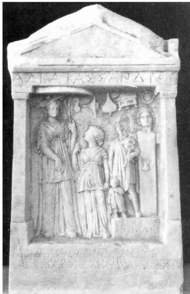
Η επιτύμβια στήλη της Αδέας

Στο άλλο μισό της αίθουσας Γ εκτίθενται αντιπροσωπευτικά δείγματα επιτύμβιων στηλών κατασκευασμένων στην Βέροια. Αν και το παλιότερο από τα εκθέματα αυτά είναι η φθαρμένη στήλη του Αμύντα, γιου του Στράτωνος (4 ος αι. π.Χ.),