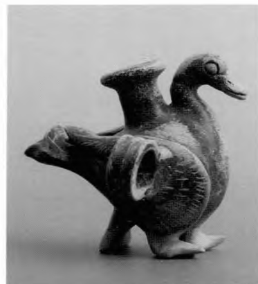
Χρυσά σκουλαρίκια και πήλινο θήλαστρο από τον τάφο του κοριτσιού της Μιέζας