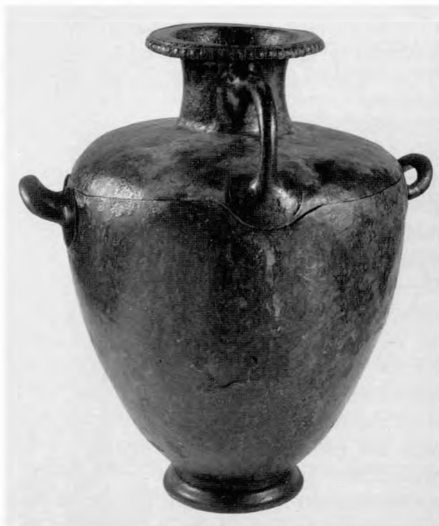
Χάλκινη τεφροδόχος υδρία

Η αίθουσα Α διαιρείται σε τρεις χώρους. Στον πρώτο εκτίθενται ευρήματα του αρχαϊκού, κλασσικού και ελληνιστικού νεκροταφείου. Στην πρώτη προθήκη αριστερά δύο χάλκινα αγγεία μας υπενθυμίζουν ότι στην Βέροια, παράλληλα με τον ενταφιασμό των νεκρών, ήταν σε (πιο σπάνια) χρήση και η καύση. Η χάλκινη υδρία και η κάλη χρησιμοποιήθηκαν ως οστεοδόχοι. Οι απέναντι προθήκες περιλαμβάνουν κτερίσματα αρχαϊκών τάφων που χρονολογούνται στο β΄ μισό του 6 ου αι. π.Χ. Τα αντικείμενα αυτά είναι