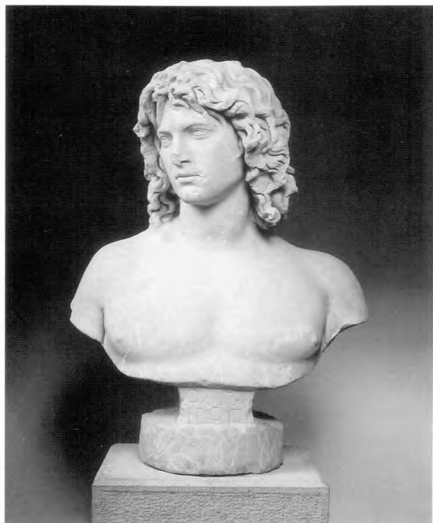
Η προτομή του Ολγάνου

Ο κεντρικός χώρος του Μουσείου καλωσορίζει τον επισκέπτη λουσμένος με πλούσιο φυσικό φωτισμό που μπαίνει από τα μεγάλα ανοίγματα του ανατολικού τοίχου. Το βλέμμα αφήνεται να ατενίσει τον ευρύ μακεδονικό κάμπο, πηγή πλούτου και ισχύος για τους αρχαίους Μακεδόνες, αλλά την επέκταση της σημερινής πόλης στα ανατολικά. Μπροστά μας, όμως, το ίδιο φωτεινή, απαυγάζοντας στην λευκή στιλπνότητα της μαρμάρινης ύλης, βρίσκεται μια οικεία για τους Ναουσαίους μορφή: είναι η προτομή του ποτάμιου θεού Όλγανου, που βρέθηκε στην περιοχή του Κοπανού, στα όρια της αρχαίας Μίεζας. Η προτομή του που επιγράφεται με το όνομά του σε δύο στίχους, χρονολογείται στο δεύτερο μισό του 2 ου αι. μ.Χ. Η διαφάνεια του μαρμάρου και η υγρότητα των μακριών βοστρύχων που πέφτουν στους ώμους κυματιστοί επιτείνουν την ποτάμια