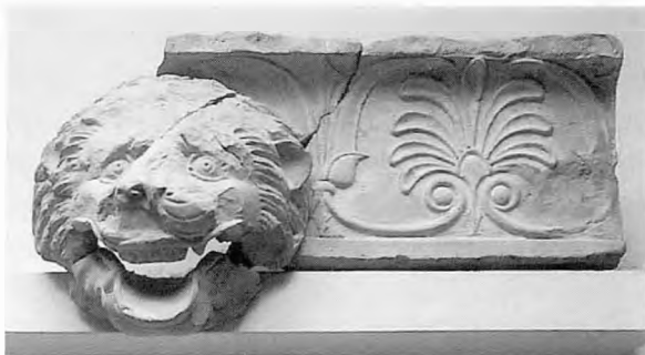
Πήλινη σίμη από τη σχολή Αριστοτέλους

Στην νεότερη νεολιθική χρονολογείται ο οικισμός του Πολυπλάτανου του δήμου Ειρηνούπο-