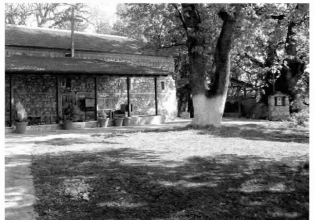
Το εκκλησάκι της Αγ. Παρασκευής κοντά στο οποίο εικάζεται ότι έγινε η δολοφονία

Χρόνια περνούν κι αιώνες ρέουν ανάμεσα ιστορικών ρηγμάτων, θυμάτων, ρωγμών... Νοιώθω τον Ελληνισμό πάντα σε επάλξεις... Γιαννακοχώρι μας αγρίεψες, πρωτίστως νιώσαμε οι «σκαπανείς» σου... Άξιος ο - αμισθί - μισθός... Δίχως τελεία Τέλος