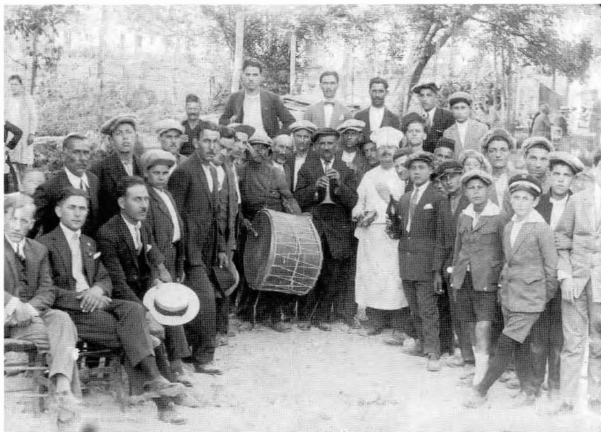
Γλέντι με το Μήτρο Χαιβάνο (μια από τις πολλές φωτογραφίες του βιβλίου)

Στο καθαρά χορευτικό κεφάλαιο του βιβλίου ο Χρήστος Ζάλιος παρουσιάζει τους χορούς του δρωμένου Μπούλες. Εφαρμόζει, όπως είπαμε, έναν συνδυασμό μεθόδων για την καταγραφή και την διδασκαλία τους. Ο χορός αναλύεται ρυθμικά, στην συνέχεια γίνεται η περιγραφική ανάλυση των βημάτων κατά την τρέχουσα σημειογραφία και με λόγια. Παρέχεται επίσης η μελωδία του χορού και όπου σώζονται, τα λόγια. Για τους «δύσκολους» μουσικά χορούς του πρώτου, Παπαδιά και Παλιά Παπαδιά, Νταβέλη, Σωτήρη, επιστρατεύτηκε η βυζαντινή