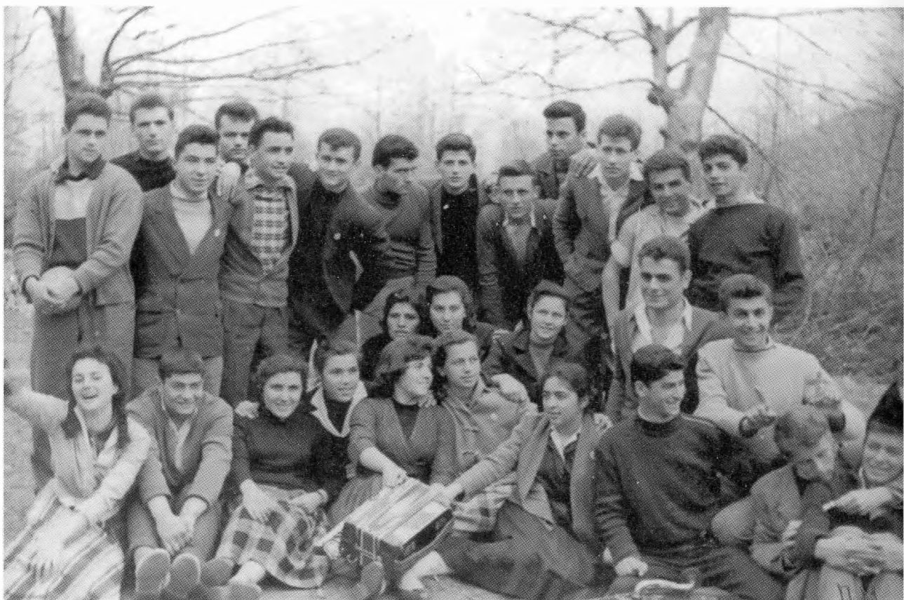
1958. Η τελευταία εκδρομή στον Άγιο Νικόλαιο