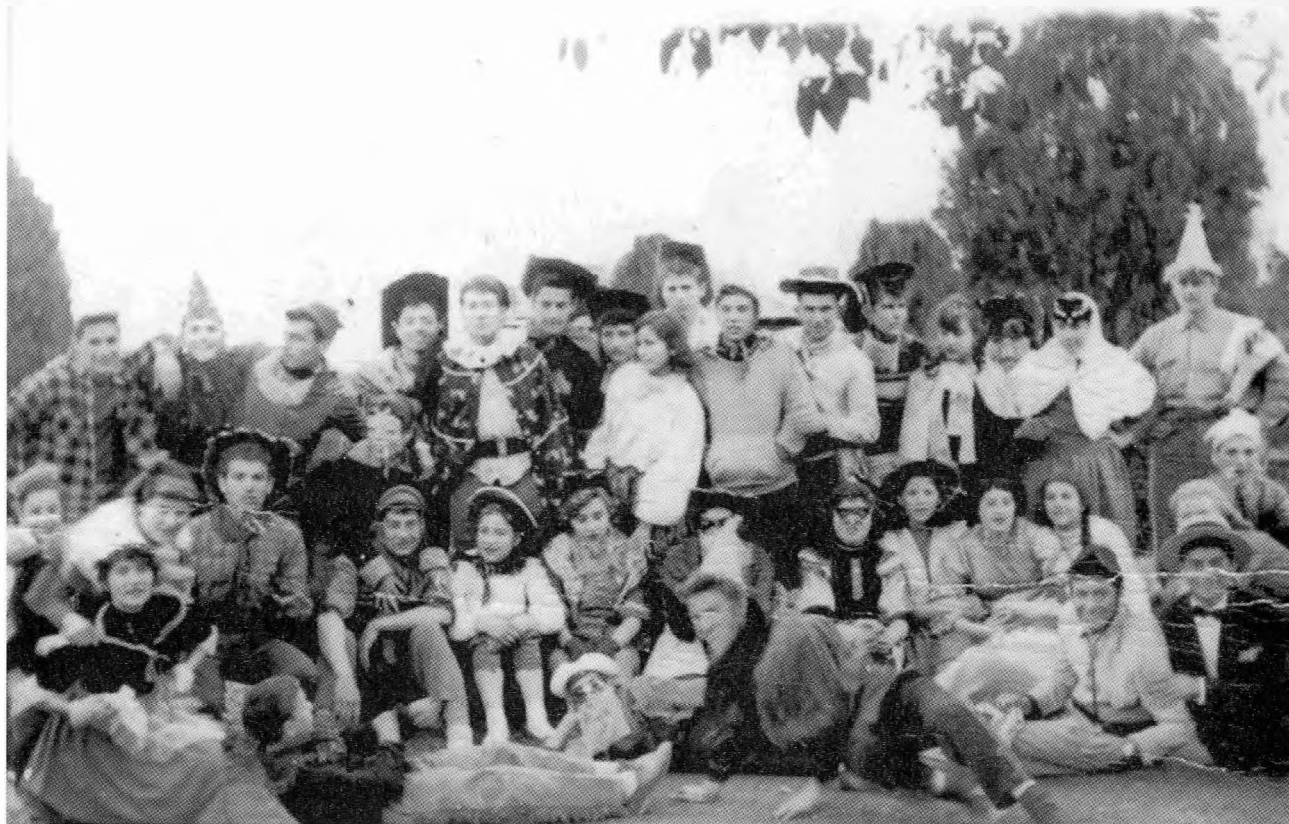
Καρναβάλια 1956. Η τάξη στο Κιόσι.