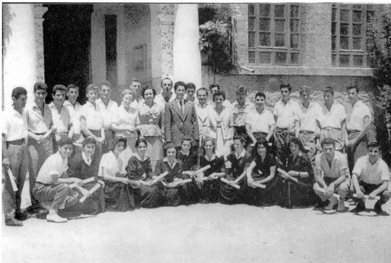
Η Η' Τάξη του Λαυπείου γυμνασίου Νάουσας, με τα απολυτήρια στο χέρι το 1958.

Ήταν πάντως όλοι εκεί, και ήταν πολλοί. Πενήντα επτά στην τάξη του '58. Τάξη μικτή, αγόρια κορίτσια, δίπλα-δίπλα, συμμαθητές αδέλφια.