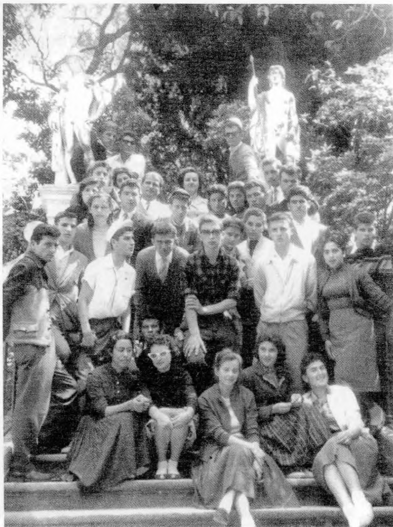
Από την εκδρομή στην Κέροικα