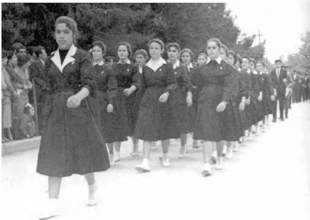
Τα κορίτσια παρελαύνουν με τις ποδιές.