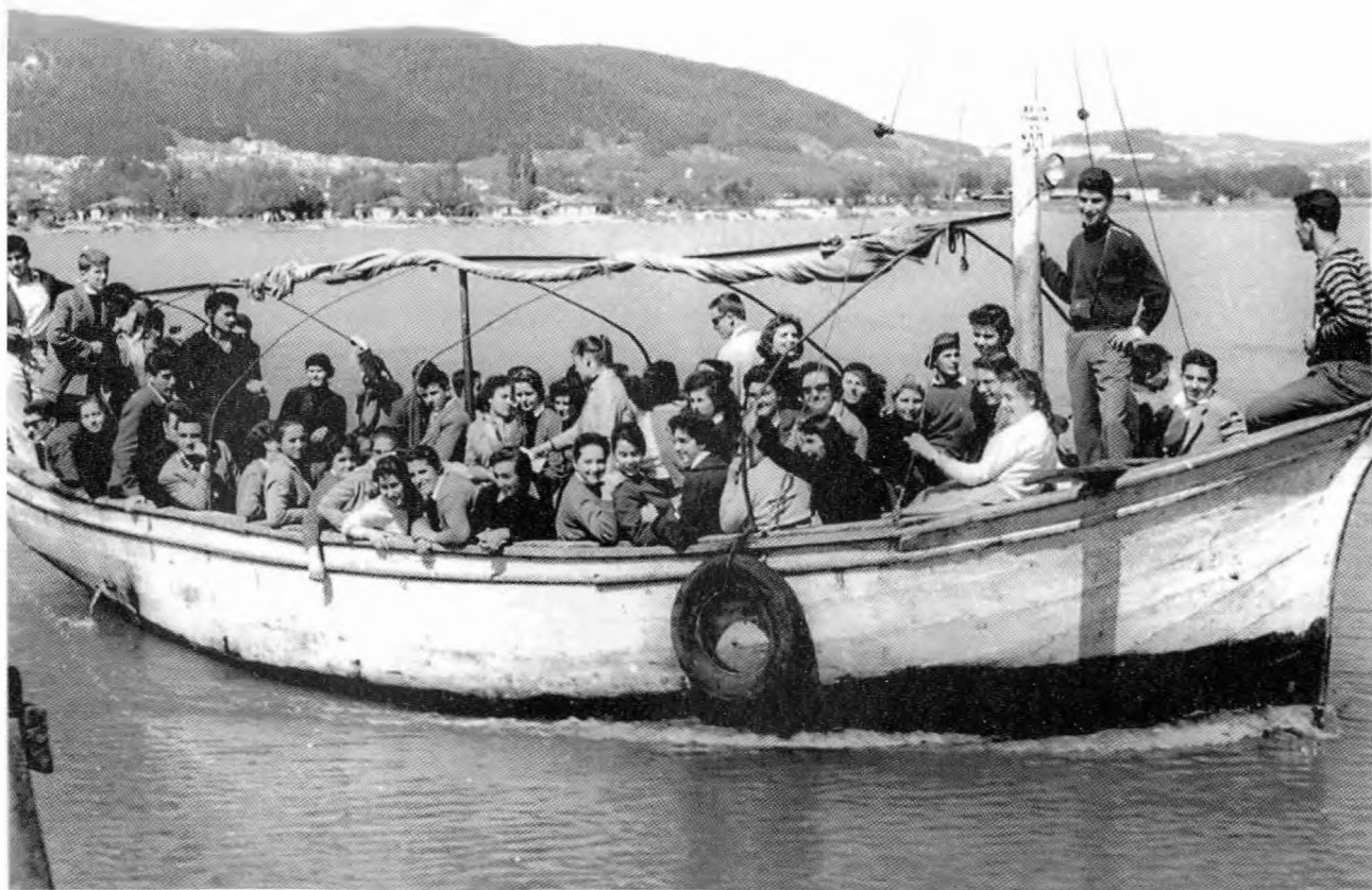
Από την εκδρομή στην Κέρκυρα.