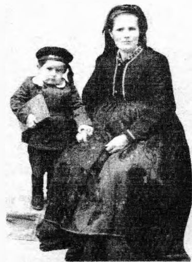
Έκδόσεις Πεταίβα Λόγος 2000