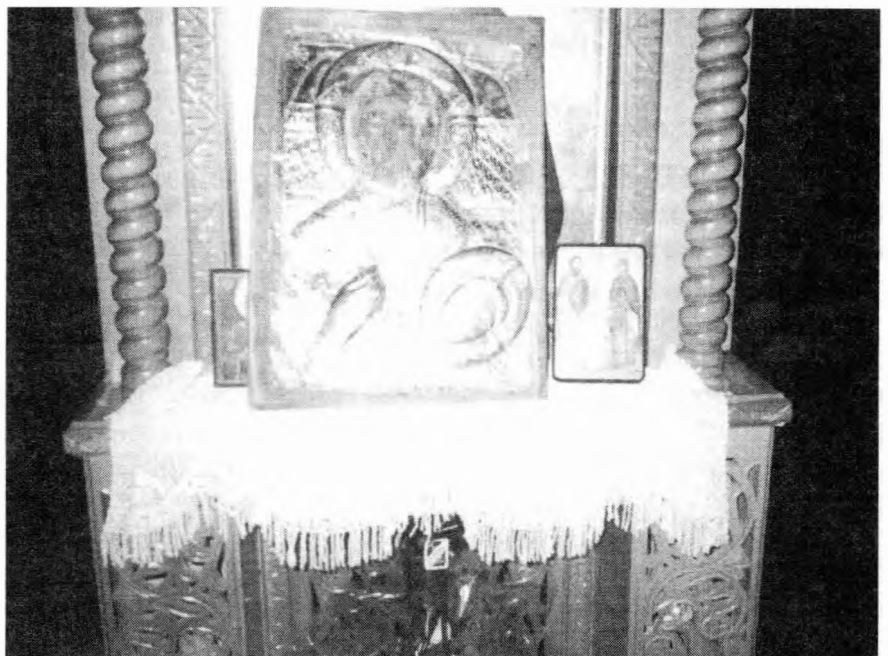
Η πληγωμένη εικόνα της Αγίας Παρασκευής

Οι Ναουσαίες κοπέλες που ελευθερώθηκαν, χάρη στη βοήθεια της Αγ. Παρασκευής και των Μαγερωτών, έστειλαν από ευγνωμοσύνη και ευλάβεια στην εκκλησία της Αγ. Παρασκευής, δύο στεφάνια από απόφιο ασήμι, όπου είχαν γραμμένα και τα ονόματά τους. Τα στεφάνια