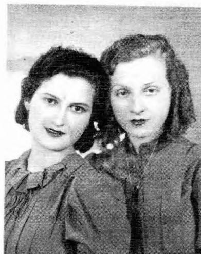
Οδός Ανταρτών Ελισάβετ Μπαμπιμαρέζου και Παν. Πάπα.

Τα σπίτια επί της πλατείας, αρχίζουν από αριστερά, γωνία με την σημερινή Καρατάσου από το σπίτι του Νταούτη. (Η Καρατάσου ή-