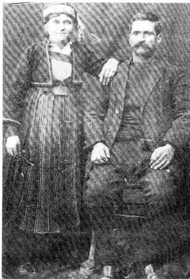
Το ζεύγος Ψαρά - οι γενάρχηδες -

που είχε και τον σουσαμόμυλο και του Νέστορα με το φούρνο του Μαϊδη, φάτσα στην πλατεία.