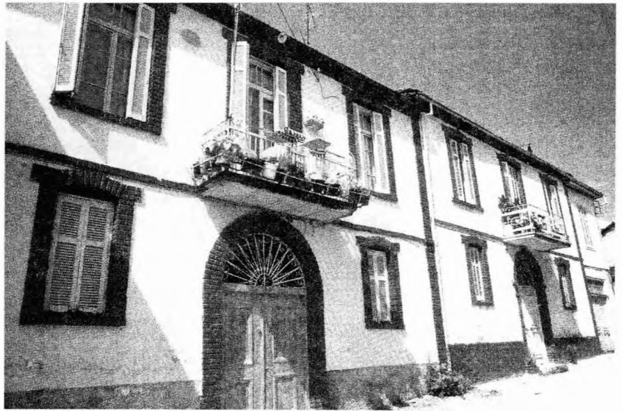
Αγίου Θεοφάνους σήμερα.

Στο ποτάμι που περνούσε μπροστά και από τον φούρνο του Μαϊδη, έριχνε παλιά και τον σταυρό τα Φώτα, η ενορία της Παναγιάς.