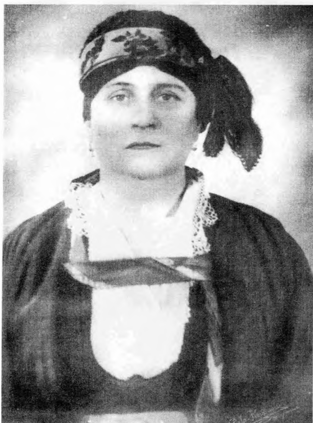
Οδός Αγίου Θεοφάνους