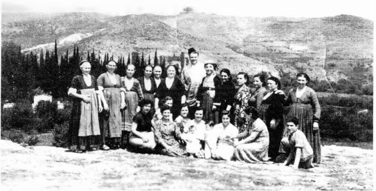
Όλος ο μαχαλάς από τον ψακό ενός Αμερικάνου. Δεληχρόστου - Μπόσκου - Πέϊου - Γιόζαλα - Λαδά - Πέτου - Βαλθολομαίου και τα μικρά της γειτονιάς.

Το χόμα που κάλυπτε την πλατεία ήταν πάντα καλοσκουπισμένο, άστραφτε ο τόπος, αφού οι γυναίκες απ'τα Αλώνια ήταν ξακουστές (και είναι) για την πάστρα τους και την φιλοτιμία τους.