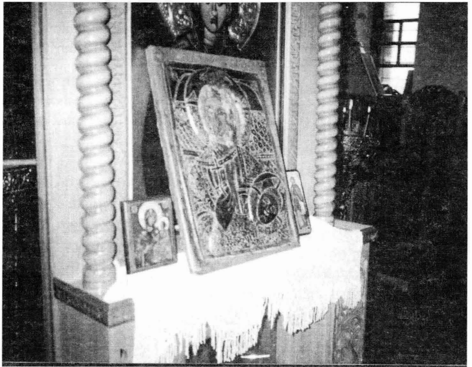
Η πληγωμένη εικόνα της Αγίας Παρασκευής από άλλη γωνία φωτογράφισης.

Υπάρχει εκόμη σχετική επιγραφή σε μαρμάρινη πλάκα στη Βόρεια πλευρά του ναού της Αγίας Παρασκευής, με υπογραφή της Φιλοπροοδευτικής Ένωσης Δασυλλιωτών "Αγ. Παρασκευή", η οποία γράφει επί λέξει: "Το 1804 οι κλεισμένες στην εκκλησία αυτή 15 Ναουσαίες κοπέλες αιχμάλωτες των Τουρκαλβανών που οδηγούνταν στο χαρέμι του Αλή Πασά από θαύμα της Αγίας Παρασκευής λύθηκαν τα δεσμά τους και με τη