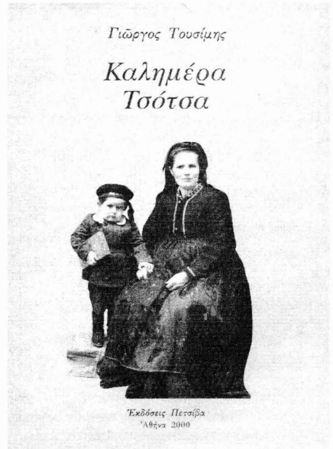
Το εξώφυλλο του βιβλίου του Γιώργου Τουσίμη.

Μα προπαντός για να σώσει από τα χέρια των Ντουρζήδων το πιο αξιοτίμητο προσκύνημα της πολιτείας.