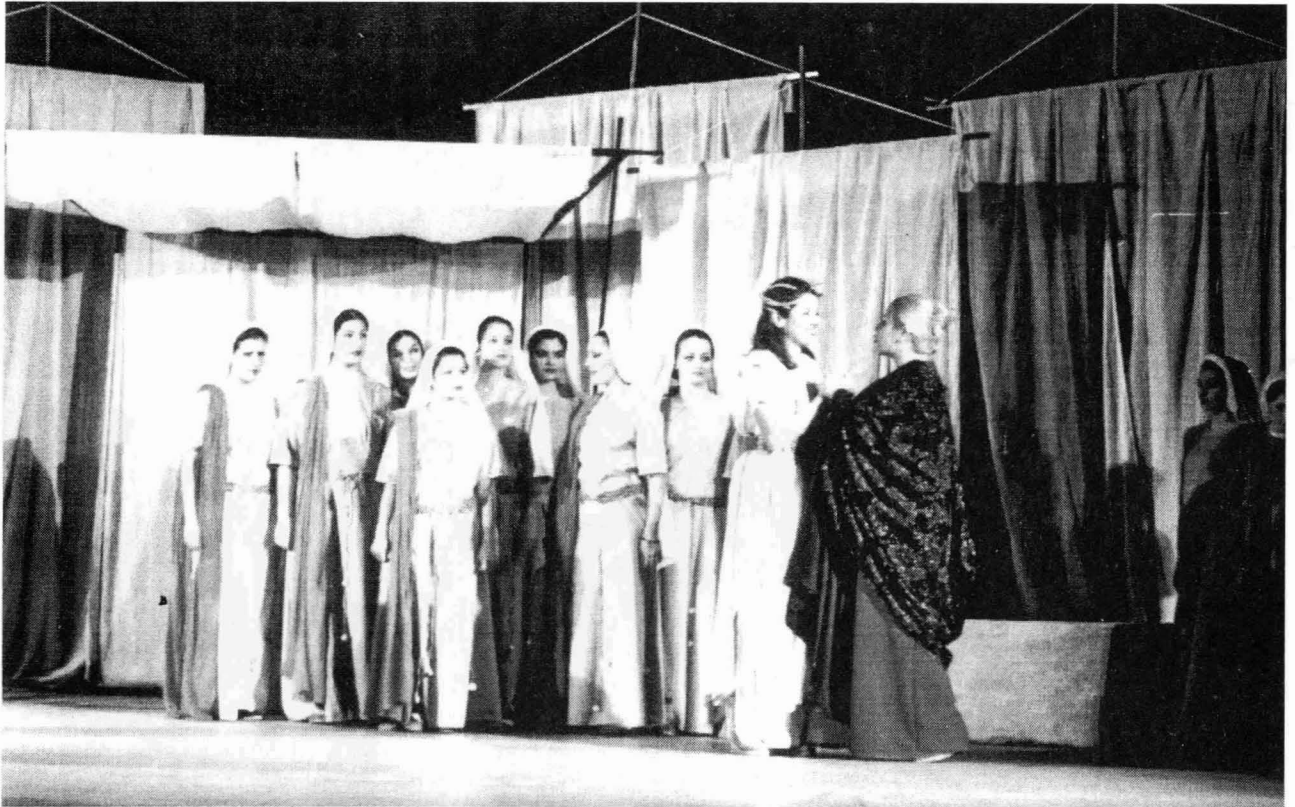
Φωτογραφία από την παράσταση: Χορός - Ιφιγένεια - Κλυταιμίστρα