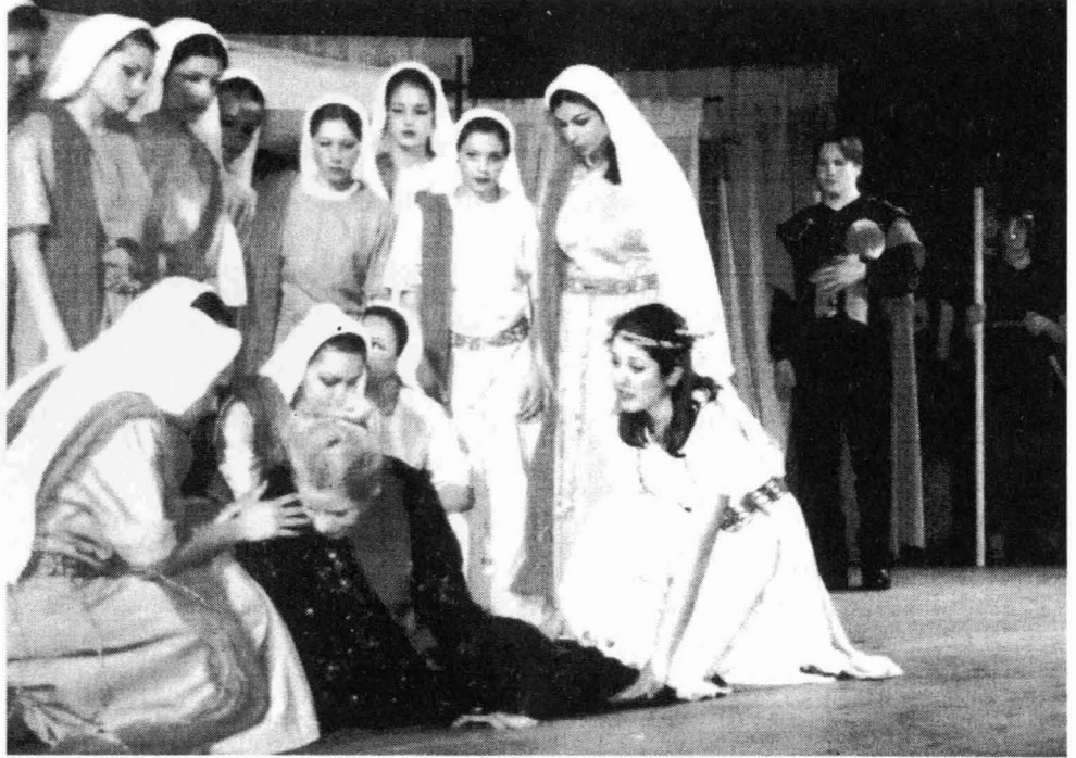
Φωτογραφία από την παράσταση: Χορός, Κλυταιμίστρα, Ιφιγένεια, Αχιλλέας, Φρουροί.

στον υποτιθέμενο γάμο. Τη λύση στην τραγωδία δίνει η Ιφιγένεια που δέχεται να θυσιαστεί για το καλό της πατρίδας. Την ώρα όμως που το μαχαίρι υψώνεται η Άρτεμη παίρνει την Ιφιγένεια και στη θέση της βάζει ένα ελάφι.