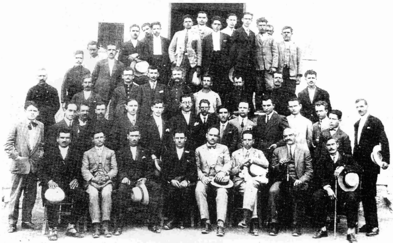
Φωτογραφία από συνέλευση Ναουσαίων αμπελουργών

Φυσικά το θέμα δεν είναι τόσο εύκολο όσο η αριθμητική αναγωγή του. Απλώς εμείς το παραθέτουμε αν θέλετε για ανοιχτή συζήτηση.