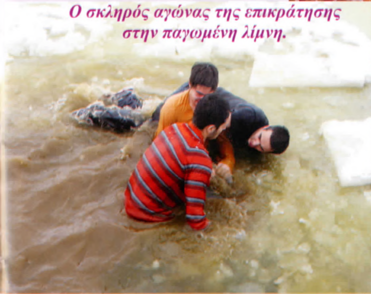
Ο σκληρός αγώνας της επικράτησης στην παγωμένη λίμνη.