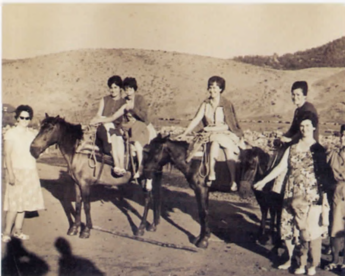
Ιππεύοντας στο Τσαϊρι το 1962