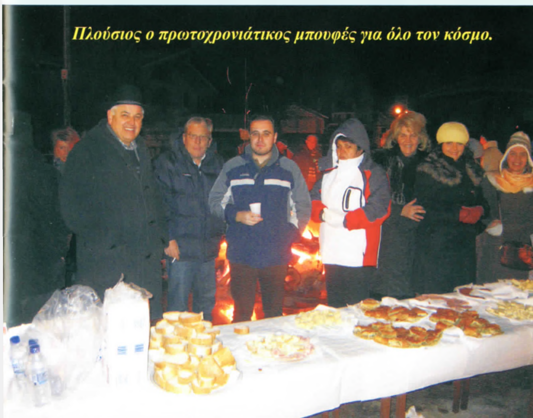
Πλούσιος ο πρωτοχρονιάτικος μπουφές για όλο τον κόσμο.

γιορτή προσκαλώντας όλους να πιαστούν στον χορό του πρωτοχρονιάτικου γλεντιού. Ο εορτασμός της βραδιάς συνεχίστηκε στα κέντρα του χωριού όπου οι Ξηρολιβαδιώτες και οι φίλοι του χωριού βίωσαν ακόμα μία γευστική και μουσική πανδαισία συνεχίζοντας το γλέντι τους.