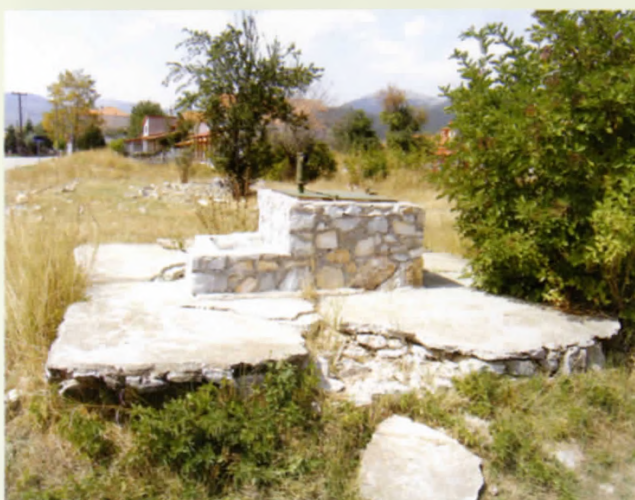
Το κοινοτικό πηγάδι στο Κάτω Μεσοχώρι