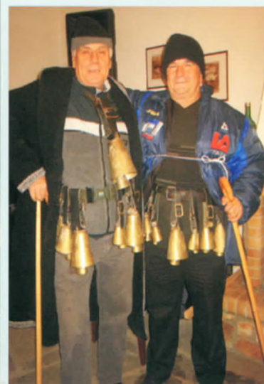
Οι λυγκουτσάρηδες του Ξηρολίβαδου