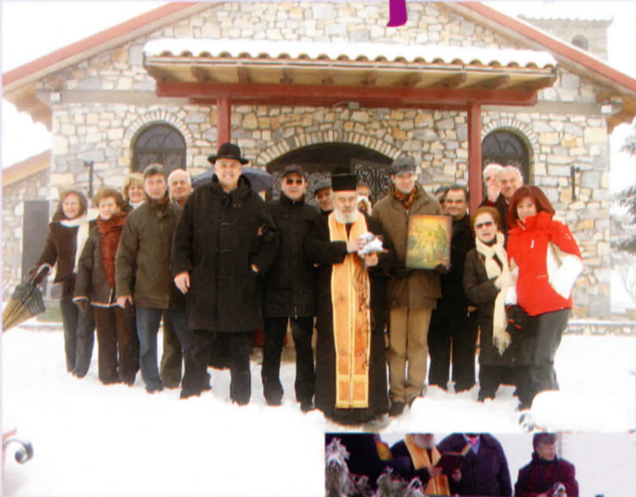
Το ξεκίνημα της Λιτάνευσης προς την Μπάρα