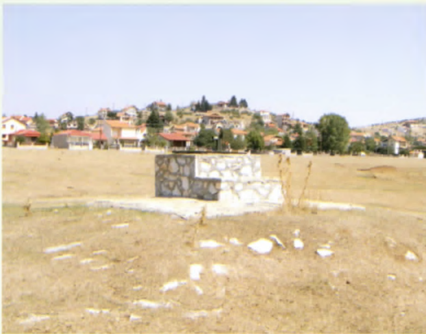
Το κοινοτικό πηγάδι «Μπούνα»

Το Ξηρολίβαδο δεν έχει επιφανειακά νερά στα βοσκοτόπια του, το νερό της βροχής το απορροφά όλο το ασβεστολιθικό πέτρωμα του και μόνο στο οροπέδιο με τα πηγάδια και την λίμνη (Μπάρα) βρίσκουν τα κοπάδια νερό να πιούνε. Επειδή λοιπόν δεν υπάρχουν επιφανειακές πηγές οι κάτοικοι αναγκάστηκαν να κατασκευάσουν πηγάδια για τις ανάγκες τους. Η τέχνη της κατασκευής των πηγαδιών τώρα έχει πιά εκλείψει. Τα πηγάδια στο Ξηρολίβαδο ήταν πάρα πολλά και διακρίνονταν σε δύο μεγάλες κατηγορίες, 1) σε αυτά που ήταν μέσα στον οικισμό και 2) σε αυτά που ήταν στο τσαϊρι. Βέβαια άλλα από αυτά ήταν κοινοτικά και άλλα ιδιόκτητα.. Μερικοί κτηνοτρόφοι με επικεφαλής κάποιον πλουσιότερο έφτιαχναν από κοινού συνεταιριστικά ένα πηγάδι για το πότισμα των κοπαδιών τους (πηγάδι του φαλκαριού του Χατζηγώγου).