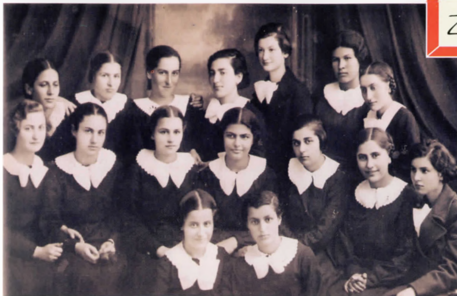
Ξηρολιβαδιώτισσες στο Λύκειο του Μπαζαρτζίκ το 1934

Με χαρά και ενθουσιασμό οι Ξηρολιβαδιώτες συμμετέχουν στην προσπάθεια του ΠΟΞ για την δημιουργία και οργάνωση του φωτογραφικού αρχείου του Ξηρολιβάδου και παραχωρούν συνεχώς και νέες φωτογραφίες που ανασύρονται από τα παλιά οικογενειακά αρχεία και αφού αποθηκευτούν ψηφιακά απο τον Όμιλο, επιστρέφουν στους κατόχους τους. Ενδεικτικά δημοσιεύονται στο παρόν τεύχος ορισμένες από αυτές.