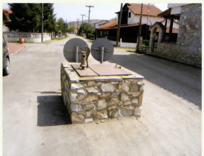
Το κοινοτικό πηγάδι στο Χάνι

Πηγαδίτσα και κάποια άλλα τα υπόλοιπα ήταν και είναι ιδιόκτητα και αποκαλούνταν με το όνομα του ιδιοκτήτη. Τα πηγάδια εξασφάλιζαν την ύδρευση του χωριού μέχρι την δεκαετία του 1970 οπότε κατασκευάστηκε η δεξαμενή πάνω από τα Σαρακατσάνικα καλύβια και το Ξηρολίβαδο απέκτησε υδρευτικό δίκτυο με νερό που προέρχεται από γεωτρήσεις. Προσωπικά εγώ ανήκω στην γενιά που έζησε την εποχή των πηγαδιών στο Ξηρολίβαδο και τα θυμάμαι με νοσταλγία.. Σήμερα αρκετοί από τους κατόχους των επιχωματισμένων και παραμελημένων πηγαδιών προχωρούν σε εργασίες καθαρισμού και υπέργειες κατασκευές, που τα αναδεικνύουν και πάλι σε αναπόσπαστο στοιχείο της φυσιογνωμίας του Ξηρολιβάδου.