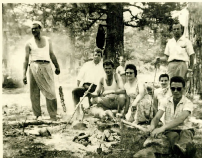
Οι Τσιαμητράϊοι (Κατσιμητράϊοι κατά τον αφηγητή) με φίλους επί το έργο του ψησίματος

Είναι γνωστό σε όλους, πως τίποτε δε μπορεί ν' αποσπάσει μια σύναξη βλάχων απ' το ψητό, ή μη μόνον μια γλυκόφωνη μπάντα χάλκινων με δυο κλαρίνα πρίμο-σεκόντο. Η μπάντα του Ανέστη, καθ' όλα