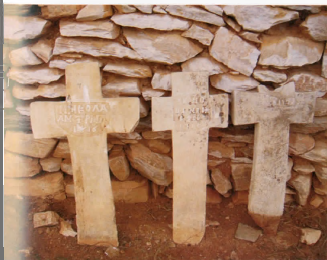
Μαρμάρيني σταυροί από το νεκροταφείο του οικισμού (ημερ. σταυρού 1616).