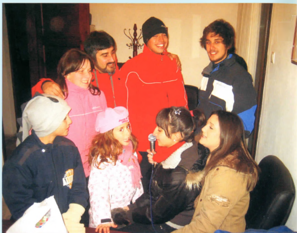
Τα πρωτοχρονιάτικα κάλαντα στα μεγάφωνα από τα παιδιά του χωριού

Μ ε ιδιαίτερα φαντασμαγορικό αλλά και παραδοσιακό τρόπο έγινε η υποδοχή του Νέου Χρόνου στο Ξηρολίβαδο με την συμμετοχή πολλών Ξηρολιβαδιωτών αλλά και φίλων του χωριού που αψήφησαν την πολύ χαμηλή θερμοκρασία που επικρατούσε και που έφθασε στους δεκαπέντε βαθμούς κάτω από το μηδέν, προκειμένου να φθάσουν στο αγαπημένο τους χωριό. Οι υπηρεσίες της Νομαρχίας είχαν φροντίσει να καθαρίσουν επιμελώς τον δρόμο από το χιόνι και τον πάγο και έτσι η άνοδος των αυτοκινήτων ήταν απολύτως ασφαλής. Το Πολιτιστικό Κέντρο του χωριού με τον εορταστικό του φωτεινό διάκοσμο για τον οποίο είχε επιληφθεί ο Δήμος Βέροιας προσέφερε στους επισκέπτες ένα πρώτο καταφύγιο θαλπωρής με το μεγάλο τζάκι να καίει ακατάπαυστα ενώ με την φροντίδα των μελών του ΠΟΞ