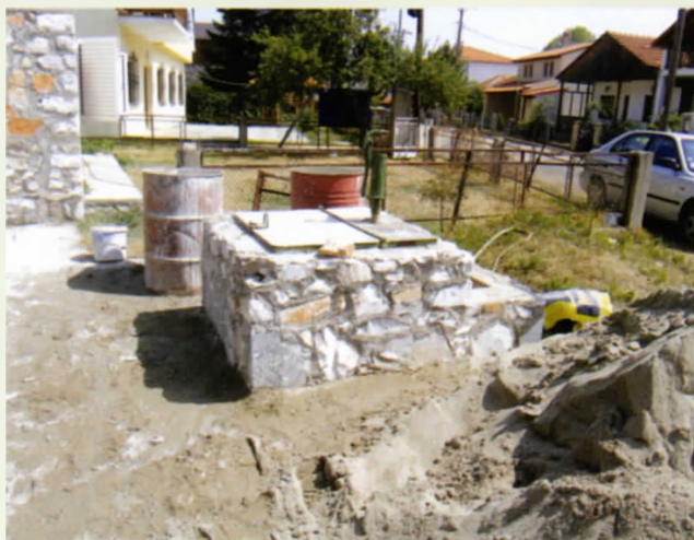
Το κοινοτικό πηγάδι στον Γκούμα

Άλλοι επίσης κατασκευάζουν και δικά τους πηγάδια και λόγω παράδοσης αλλά και λόγω της έλλειψης νερού η οποία συνεχίζεται να υφίσταται στους καλοκαιρινούς μήνες. Το νερό έβγαине συνήθως με σχοινί με κουβά. Δεν υπήρχαν τότε βαρούλκα. Αργότερα φτιάχτηκαν σε ορισμένα κοινοτικά πηγάδια αντλίες και για ένα αρκετό διάστημα οι περισσότεροι έπαιρναν το νερό με τις αντλίες, μερικοί όμως νοσταλγοί της άντλησης του νερού με τον κουβά άνοιγαν το σιδερένιο σκέπασμα που κάλυπτε κατά το ήμισυ το χτισμένο πηγάδι και έπαιρναν νερό με αυτό. Πολλές φορές έπεφτε ο κουβάς επειδή κόβονταν το σχοινί και οι άνθρωποι αναγκάζονταν να χρησιμοποιήσουμε την τεχνική με το τσιγκέλι για να βγει ο κουβάς. Η διαδικασία ήταν αρκετά δύσκολη και χρειαζόταν και ο παράγοντας τύχη εκτός της ικανότητας. Η άντληση του νερού με τους κουβάδες, είχε μια ιδιαίτερη γοητεία και μυστηριακότητα την οποία πάντα κρύβουν μέσα τους τα αρχέγονα πηγάδια που φέρνουν σε επικοινωνία τον άνθρωπο με τα τριςβαθα της γης και τα μυστικά της. Μετά τη κατασκευή της δεξαμενής το πηγάδι παραμελήθηκαν και οι αντλίες χάλασαν.