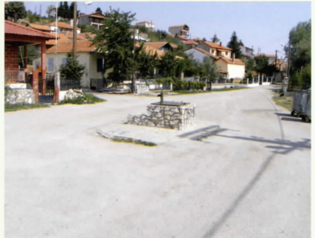
Το κοινοτικό πηγάδι στο Μεσοχώρι

Τα πηγάδια στο χωριό είχαν ποιοτικώς καλύτερο νερό και χρησιμοποιούνταν για πόση και μαγείρεμα. Τα πηγάδια στο τσαϊρι παρείχαν νερό για πλύση και για πότισμα των ζώων. Μοναδική εξαίρεση πηγαδιού στο Τσαϊρι ήταν η Μπούνα (καλό πηγάδι) που παραδόξως παρέχει το καλύτερο ποιοτικώς νερό. Λέγεται ότι ακόμα σε περιόδους μεγάλης ξηρασίας όπου όλα τα πηγάδια στέρευαν, η Μπούνα διατηρούσε κατακάθαρο νερό αρκετό για τις ανάγκες του χωριού. Απο ότι μας λένε οι παλιότεροι στην Μπούνα και στου Ντασταμάνη υπήρχε η περισσότερη «φλέβα» νερού από όλα τα άλλα πηγάδια. Συγκεκριμένα όλοι τότε οι αγωγιάτες και οι κερατζήδες έπαιρναν νερό από το πηγάδι του Ντασταμάνη. Στην Μπούνα τελείται ο επίσημος αγιασμός της ημέρας κατά τον εορτασμό του Προφήτη Ηλία. Εκτός από μερικά πηγάδια τα οποία ήταν κοινοτικά και βρίσκονταν σε δημόσιους χώρους όπως στο Μεσοχώρι, στο Χάνι, στο κάτω Μεσοχώρι, στην