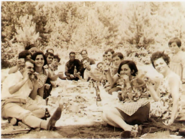
Γαστρονομική πανδαισία στα Πεύκα το 1969