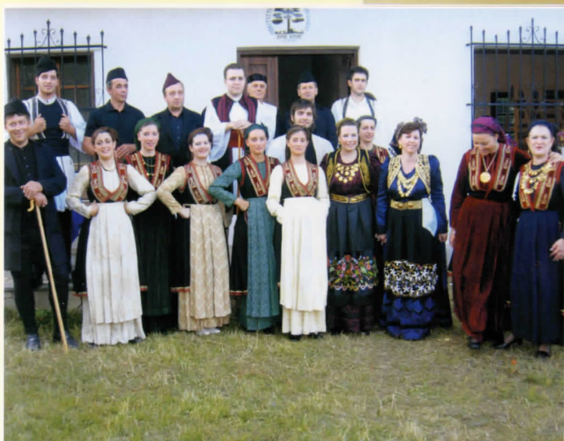
Η ανασύσταση του χορευτικού το 2004