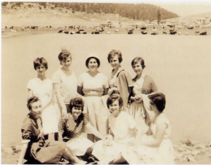
Απογευματινό στην Μπάρα το 1962