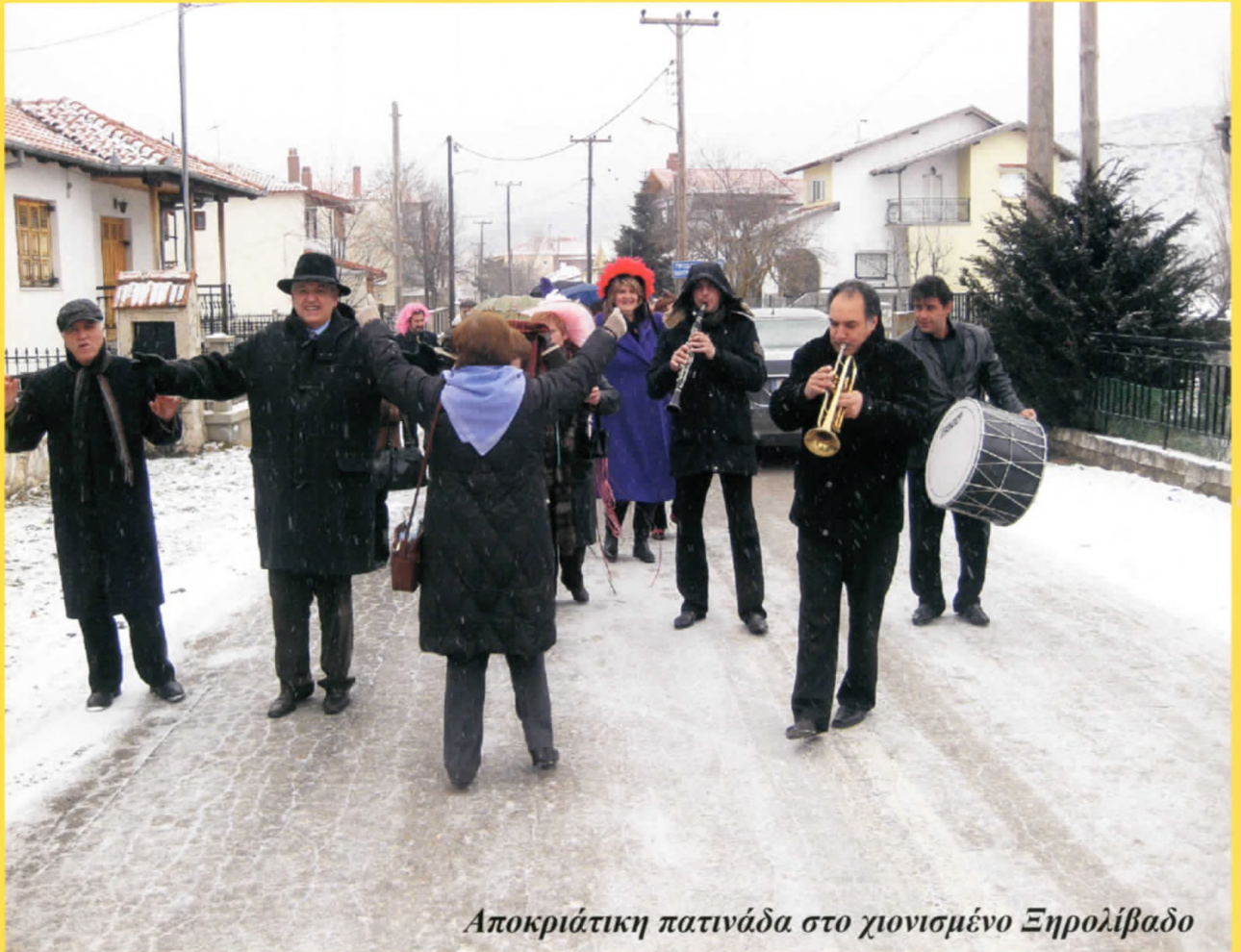
Αποκριάτικη πατινάδα στο χιονισμένο Ξηρολίβαδο

Παρά τις συνεχείς ανακοινώσεις των ραδιοτηλεοπτικών μέσων για επικείμενες έντονες χιονοπτώσεις, που απέτρεψαν πολλούς να ανηφορίσουν στο Ξηρολίβαδο και να συμμετάσχουν στα αντέτια της Αποκριάς, η διοργάνωση πραγματοποιήθηκε σύμφωνα με το πρόγραμμα του ΠΟΞ και σημείωσε μεγάλη επιτυχία αφήνοντας μια ξεχωριστή αίσθηση χαράς, κεφιού και νοσταλγίας σε όλους όσους συμμετείχαν.