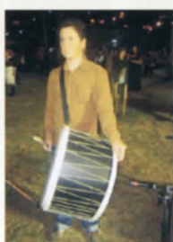
Η γκάιντα των Πιερίων και το ποντιακό νταούλι στο Ξηρολίβαδο