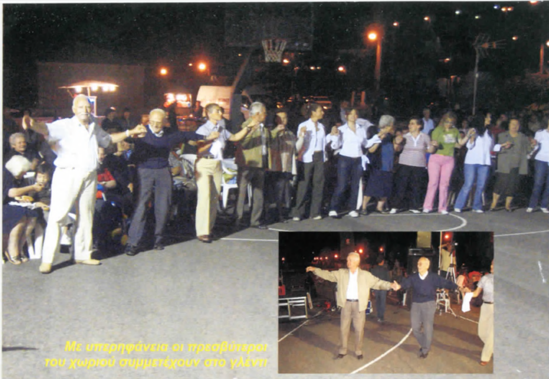
Με υπερηφάνεια οι προσβύτεροι του χωριού συμμετέχουν στο γλέντι

Οι Ξηρολιβαδιώτες και οι φίλοι του χωριού που συμμετείχαν στο γλέντι του αποχαιρετισμού θα έχουν πολύ ευχάριστες αναμνήσεις να τους συντροφεύουν στη διάρκεια του χειμώνα περιμένοντας να έρθει και πάλι το καλοκαίρι και να ξαναταμώσουν.