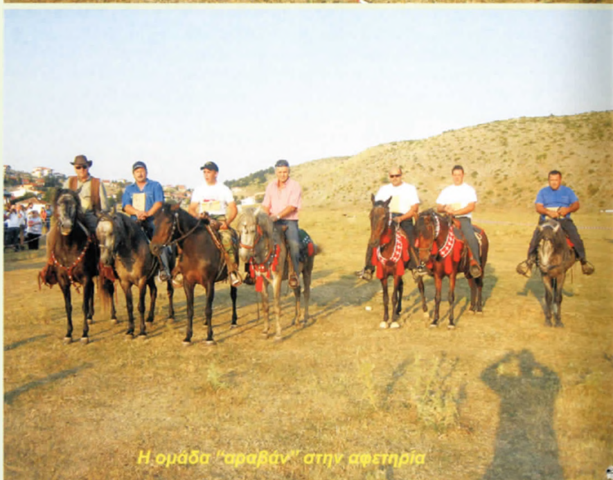
Η ομάδα "αραβάν" στην αφετηρία