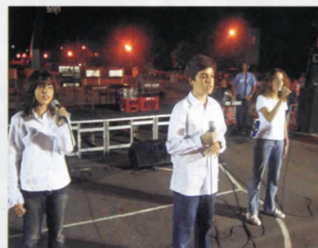
Τα νέα ταλέντα του Ξηρολιβάδου σε μεγάλες επιτυχίες