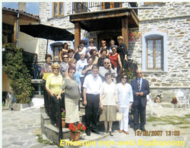
Επίσκεψη στην οικία Βαρβαρούση