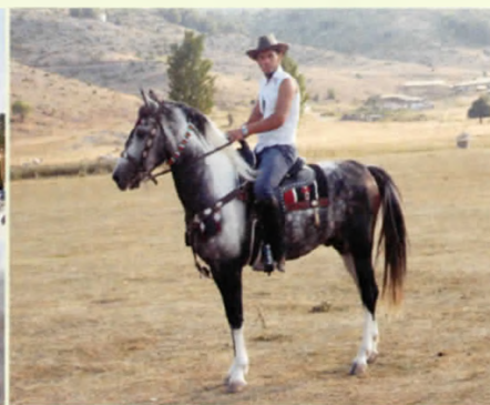
Ξεχωριστές ιππευτικές παρουσίες στο Ξηρολίβαδο