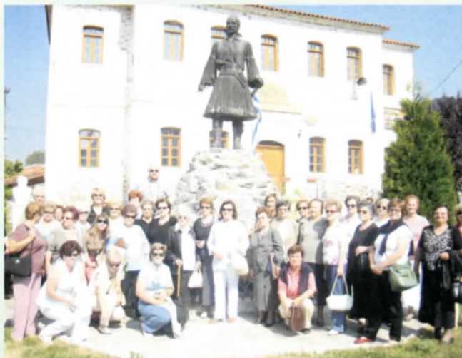
Απότιση τιμής στον ανδριάντα του ήρωα Φαρμάκη