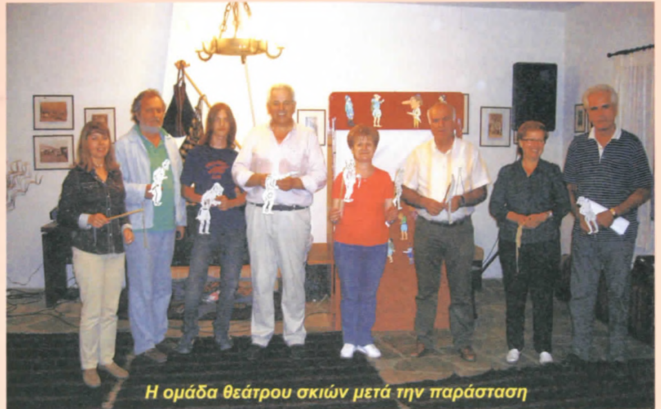
Η ομάδα θεάτρου σκιών μετά την παράσταση