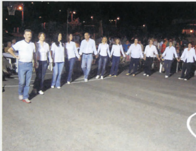
Τα χορευτικά συγκροτήματα του ΠΟΞ ενθουσίασαν και συγκίνησαν...