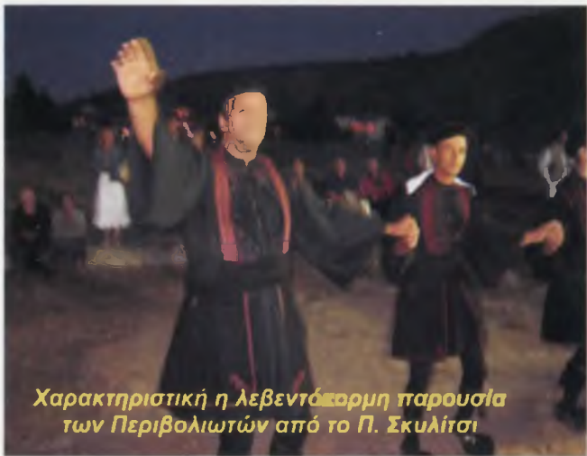
Χαρακτηριστική η λεβεντάκορμη παρουσία των Περιβολιωτών από το Π. Σκυλίτσι