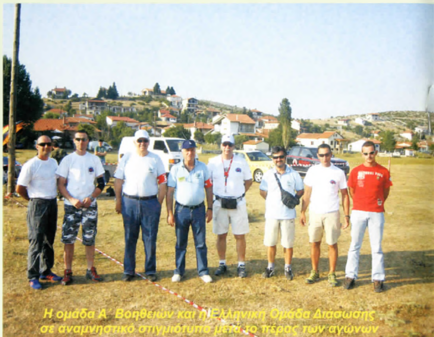
Η ομάδα Α' Βοηθειών και η Ελληνική Ομάδα Διάσωσης σε αναμνηστικό στιγμιότυπο μετά το πέρας των αγώνων