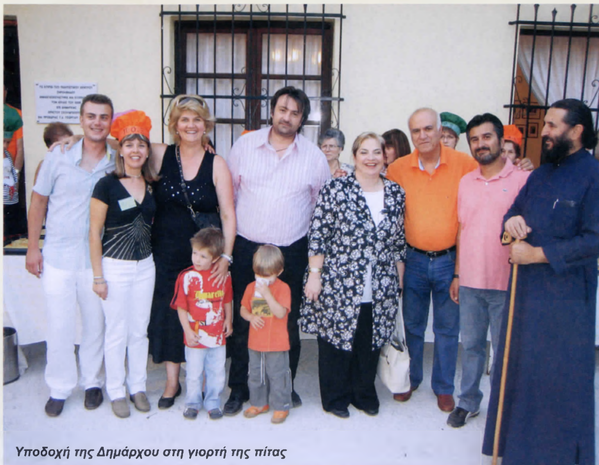
Υποδοχή της Δημάρχου στη γιορτή της πίτας