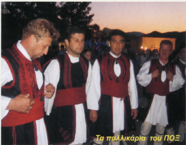
Τα παλλικάρια του ΠΟΞ