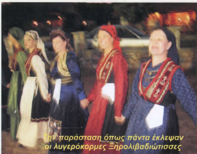
Την παράσταση όπως πάντα έκλεψαν οι λυγερόκορμες Ξηρολιβαδιώτισσες