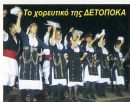
Το χορευτικό της ΔΕΤΟΠΟΚΑ