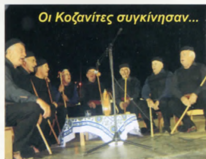
Οι Κοζανίτες συγκίνησαν...