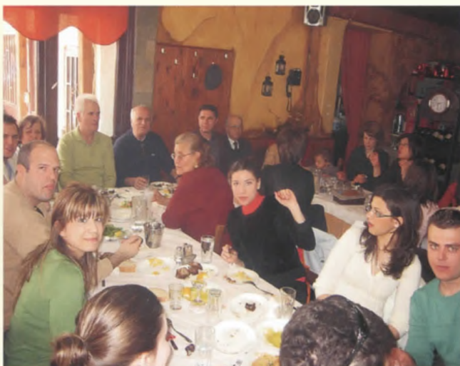
Ανωχωρίτες και Κατωχωρίτες Ξηρολιβαδιώτες σε αγαστή πασχάλινη ενωχία