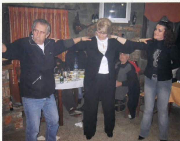
Χορευτικά στιγμιότυπα από τα χειμωνιάτικα γλέντια