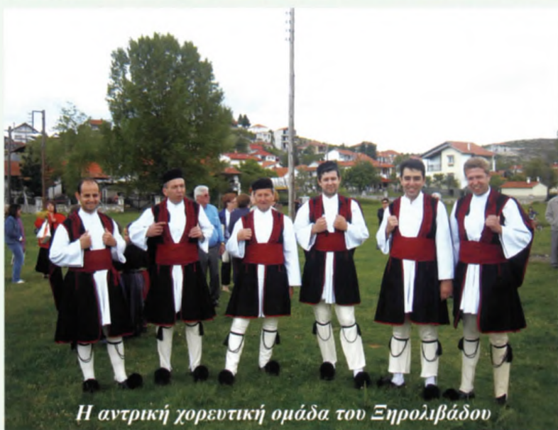
Η αντρική χορευτική ομάδα του Ξηρολιβάδου