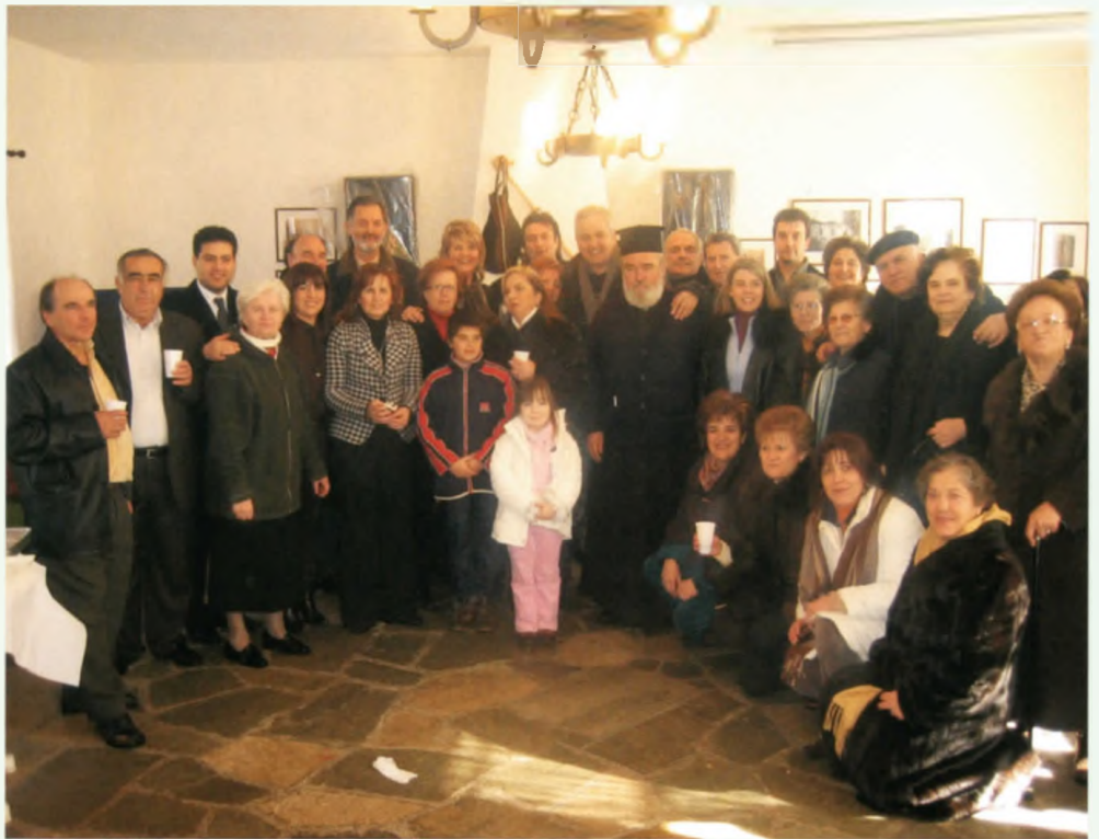
Η δήμαρχος Βέροιας Χαρούλα Ουσουλιτζόγλου εν μέσω Ξηρολιβαδιωτών και φίλων του χωριού στο Πολιτιστικό Κέντρο μετά την Κατάδυση

τον κόσμο στην αίθουσα του Πνευματικού Κέντρου του χωριού όπου ανταλλάχθηκαν ευχές και προσφέρθηκαν με μέριμνα των γυναικών παραδοσιακές πίτες, γλυκίσματα και άφθονο κρασί. Δεν ήταν δε λίγοι αυτοί που επέλεξαν να συνεχίσουν την γιορτή της ημέρας στα κέντρα του χωριού ΝΤΟΥΚΑΤΑ και ΓΡΕΚΙ ΤΟΥ ΒΑΣΙΛΗ όπου είχαν την ευκαιρία να γευτούν τα ξεχωριστά εδέσματα των γιορτινών ημερών. Τα Θεοφάνεια στο Ξηρολιβάδο έχουν καθιερωθεί στην κοινή συνείδηση σαν μία ξεχωριστή παραδοσιακή γιορτή του χωριού η οποία αναβιώνει με την έντονη δραστηριότητα που αναπτύσσει ο Πολιτιστικός Όμιλος Ξηρολιβάδου και συσπειρώνει κοινωνικά τους Ξηρολιβαδιώτες και τους φίλους του χωριού.