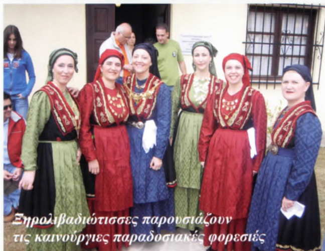
Ξηρολιβαδιώτισσες παρουσιάζουν τις καινούργιες παραδοσιακές φορεσιές

Ήδη ο κόσμος που ανέβηκε στο Ξηρολίβαδο για να πλαισιώσει τις εκδηλώσεις, είχε αρχίσει να αποχωρεί ενώ οι ευχές για καλό αντάμωμα το καλοκαίρι κυριαρχούσαν.