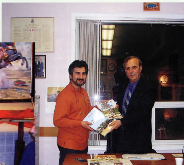
Παραδίδεται στον Πρόεδρο της Αδελφότητας "ΠΑΝΑΓΙΑ ΣΟΥΜΕΛΑ" το περιοδικό ΑΡΩΜΑ ΞΗΡΟΛΙΒΑΔΟΥ και το βιβλίο ΞΗΡΟΛΙΒΑΔΟ ΧΟΥΡΑ ΜΟΥΣΙΑΤΑ