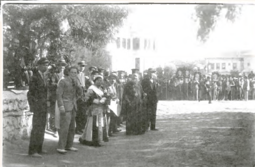
Ξηρολιβαδιώτες της εποχής συμμετέχουν σε πανηγυρική εκδήλωση στην Πλατεία Ωρολογίου στη Βέροια το 1931

Οι φωτογραφίες αυτής της σελίδας προέρχονται από το οικογενειακό αρχείο της Κορνηλίας Μύτιλη.