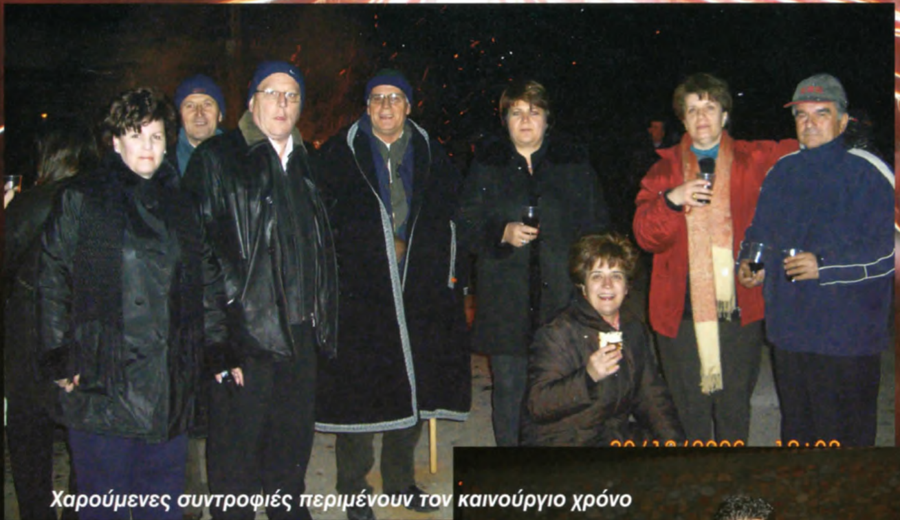
Χαρούμενες συντροφίες περιμένουν τον καινούργιο χρόνο