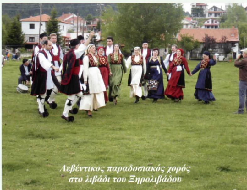
Λεβέντικος παραδοσιακός χορός στο λιβάδι του Ξηρολιβάδου