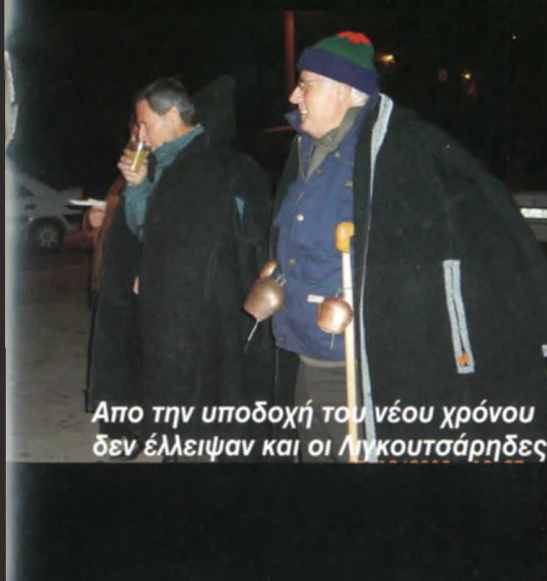
Απο την υποδοχή του νέου χρόνου δεν έλλειψαν και οι Ληγκουτσάρηδες