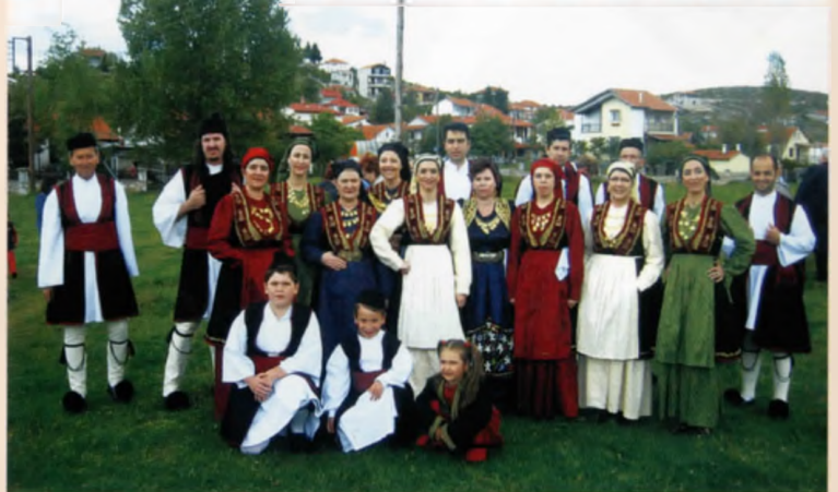
Το χορευτικό συγκρότημα του Ξηρολιβάδου με τις νεοαποκτηθείσες παραδοσιακές φορεσιές δίνει και το χρώμα στα ΞΗΡΟΛΙΒΑΔΙΩΤΙΚΑ 2007

Ο Πολιτιστικός Όμιλος Ξηρολιβάδου τα τελευταία χρόνια συστηματοποιεί όλες τις πολιτιστικές και κοινωνικές δραστηριότητες που αναπτύσσονται τους παραθεριστικούς μήνες στο χωριό κάτω από τον γενικότερο τίτλο ΞΗΡΟΛΙΒΑΔΙΩΤΙΚΑ.