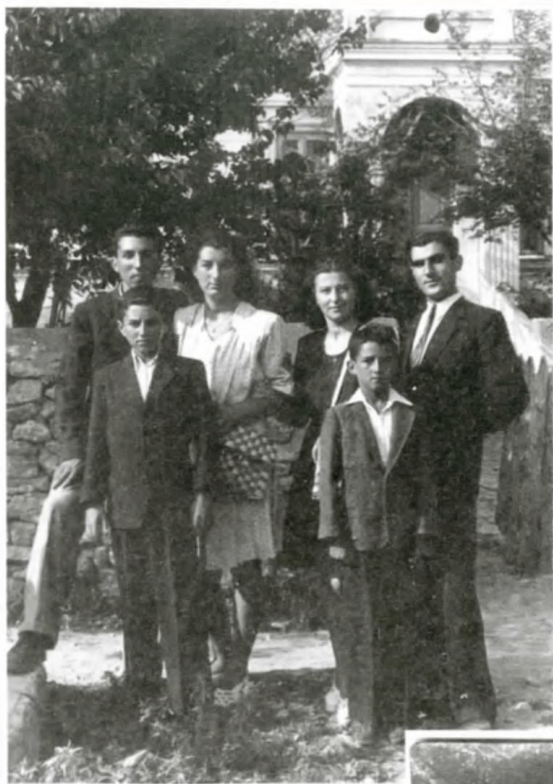
Ξηρολιβαδιώτες από τη Κωσταντσα Ρουμανίας το 1965

Από τα σεντούκια των Ξηρολιβαδιωτών ανασύρονται παλιές κιτρινισμένες φωτογραφίες οι οποίες ευχαρίστως παραχωρούνται στον Πολιτιστικό Όμιλο του χωριού και ψηφιακά αντίγραφά τους εμπλουτίζουν το πλούσιο αρχείο που δημιουργείται και αξιοποιείται.