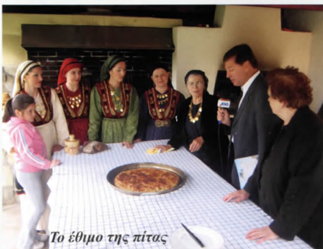
Το έθιμο της πίτας