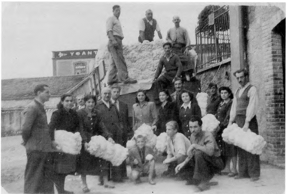
1948. Κορίτσια και αγόρια από τη Στραντζά έξω από την αποθήκη του εργοστασίου Λαναρά, φορτώνοντας «μπάλες» απο νήματα. Οι κοπέλες εργάτριες δούλευαν στις κουβαριστρες αλλά βοηθούσαν και στο φόρτωμα.