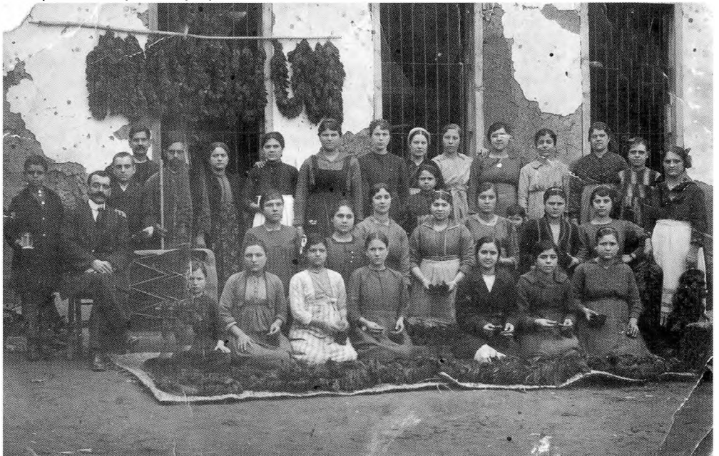
Κορίτσια της Στράντζας (Ανατολική Θράκη) ενώ αμαθιάζουν καπνά.

Ο τόπος που τους δόθηκε ως ανταλλάξιμος ήταν κυρίως τα βακούφικα της ημιορεινής περιοχής της Μονής Τιμίου Προδρόμου, που ανταποκρίνονταν στις ασχολίες των νέων κατοίκων, δηλ. την κτηνοτροφία, την παραγωγή ξυλοκάρβουνου και την σιτοπαραγωγή. Έτσι το 1925 δημιουργήθηκε ο οικισμός «Νέα Στράντζα» με 36