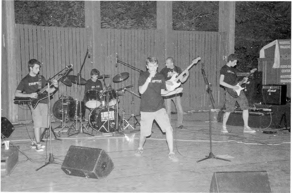
“Eruptus” (Γ. Οικονόμου, Κ. Κολοβός, Γ. Κύρου, Λ. Μιτσκόπουλος, Μ. Τσιρογιάννης).

Ο Τζόε Μακ Ντόναλντ με τους Country Joe & The Fish καυτηριάζει τον πόλεμο του Βιετνάμ στο τραγούδι «Αισθάνομαι σαν ετοιμοθάνατος» στους στίχους «... Ο θεός Σαμ χρειάζεται πάλι τη βο-