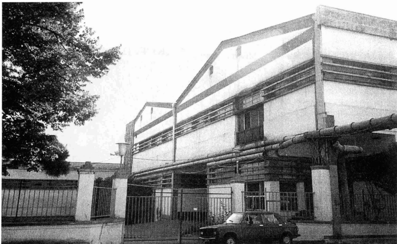
Μερική άποψη του εργοστασιακού συγκροτήματος της Βέτλανς - Νάουσα.

Μετά από αυτή την ευτυχή κατάληξη ο Δήμαρχος Νάουσας θεώρησε σκόπιμο, πριν εισαγάγει το θέμα στο Δημοτικό Συμβούλιο να έχει τις απόψεις και προτάσεις των εκπροσώπων των