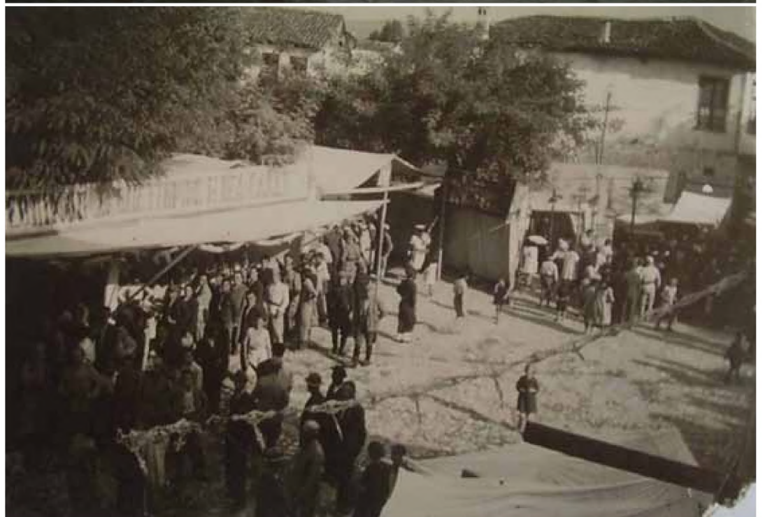
Στιγμιότυπα από την Εμποροπανήγυρη έξω από το Ναό του Αγίου Αντωνίου, στη Βέροια (μέσα 20 ου αι.)