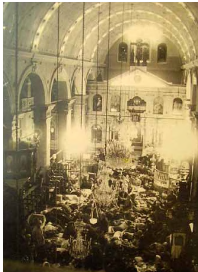
Το εσωτερικό του Ναού του Αγ. Αντωνίου

Από όλα τα χωριά της Ημαθίας συνέρρεε κόσμος για να χαρεί, να φάει και να πει στο πανηγύρι του Αγίου Αντωνίου. Τα χάνια ασφυκτιούσαν. Από το Ρουμλούκι προσέρχονταν όχι μόνο για τιμήσουν τον Άγιο και αργότερα να γλεντήσουν, αλλά και για να φωτογραφηθούν οικογενειακά ή με τους φίλους τους κρατώντας μετά τη φωτογραφία ως ενθύμιο από τη Βέροια όπως χαρακτηριστικά διαβάζουμε σε μια του 1930. Αλλά και από