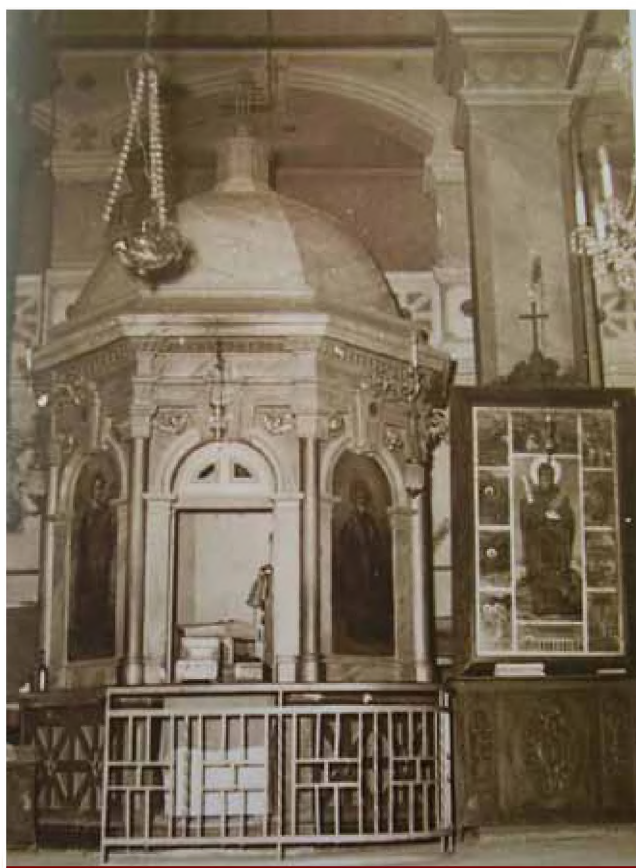
Το κουβούκλιο των λειψάνων του Αγίου