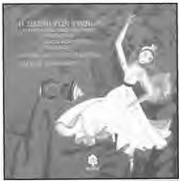
“Η λίμνη των κύκνων” Παραμύθι: Βλάντιμρ Πέτροβιτς Μπέγκιτσεφ, Βασίλι Φεντορόβιτς Γκέλτσεφ Μουσική: Πιοτρ Ίλιτς Τσαϊκόφσκι

Μ ια σειρά από παραμύθια που ...χορεύουν προτείνει ο εκδοτικός οίκος Κέδρος για μικρά και μεγαλύτερα παιδιά. Τα μικρότερα μπορούν να ακούσουν τα παραμύθια από τα cd που περιέχονται ένθετα στα βιβλία. Τα μεγαλύτερα παιδιά μπορούν να τα διαβάσουν μόνα τους ακούγοντας παράλληλα τα cd. Έτσι θα συνδέ-σουν την εικόνα με το λόγο και τη μουσική μεγάλων κλασικών συνθε-τών, κάνοντας ένα πρώτο απλό βήμα στο χώρο της μουσικής αγωγής. Σ’ αυτή τη σειρά κυκλοφορούν και: Η ωραία κοιμωμένη, Η σταχτοπούτα, Ρωμαίος και Ιουλιέτα, Το πουλί της φωτιάς, Χίλιες και μία νύχτες, Ο μαθητευόμενος μάγος, Ζιζέλ, Η ιεροτελεστία της άνοιξης, Το φιλί της νεράιδας, κ.α.