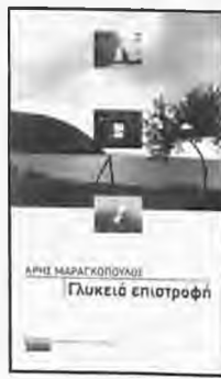
“Γλυκιά επιστροφή” Του Άρη Μαραγκόπουλου Εκδόσεις Ελληνικά Γράμματα

Α πό τη μυθική αρχαιότητα στο άγριο 2040 μ.Χ. ταξι-δεύουν οι ήρωες του βιβλίου, με την ευκολιά ενός περιπάτου. Ζουν, ως εξαφάνιστες τον εκάστοτε κανόνα της ζωής χάρη στην προκλητική τους πίστη σε ένα προσωπικό όραμα. Γι’ αυτό και όλοι τους ποθούν μια διαφορετική ζωή και σ’ αυτήν επιστρέφουν. Ο συγγραφέας γεννήθηκε στην Αθήνα ένα χρόνο πριν το τέλος του εμφυλίου. Έχει γράψει έξι λογοτεχνικά βιβλία, ένα δοκίμιο και έκανε πολλές μεταφράσεις, ενώ συνεργάζεται με άρθρα και βιβλιοκριτικές με μεγάλες εφημερίδες.