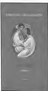
“Ερωσις - Ηρωσις” Του Αλεξανδρου Παπαδιαμαντη Εκδόσεις Ιανός

Α πό τον “Ιανό” κυκλοφορούν για τους αναγνώστες που δεν διαθέτουν πολύ χρόνο για διάβασμα μικρά διηγήματα και συλλογές γρήγορα στην ανάγνωση και πολύ ουσιαστικά στο περιεχόμενό τους. Από τους κλασικούς προτείνουμε Αλεξάνδρο Παπαδιαμάντη,