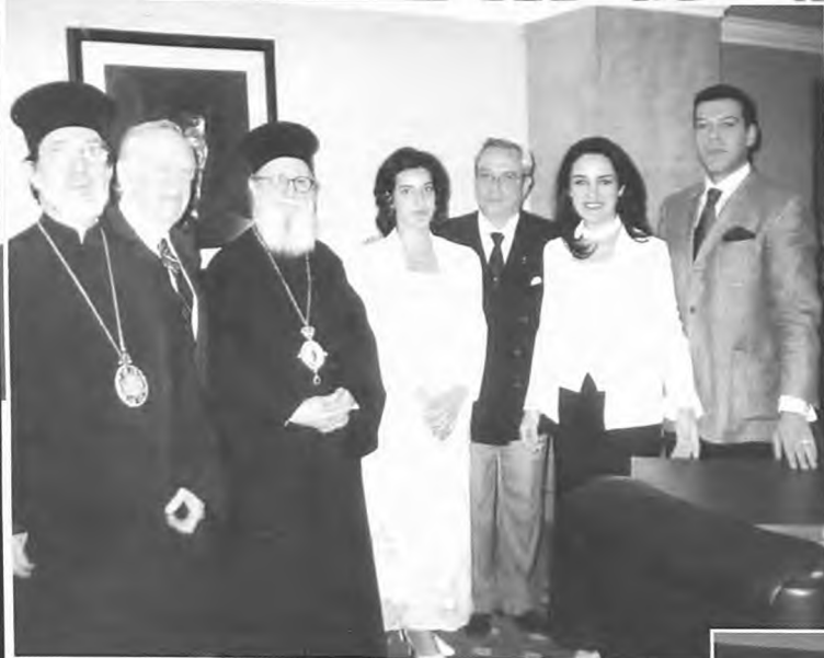
Με το τέως βασιλικό ζεύγος, τον πρίγκηπα Νικόλαο, τον Μητροπολίτη Μπουένος Άιρες καθώς και τον Ελληνοαμερικανό επιχειρηματία Τζον Κατσιματίδη.