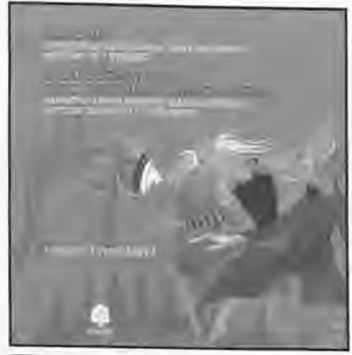
“Κοπελιά” Παραμύθι: Έρνστ Τέοντορ Βίλχελμ Όσμαν Μουσική: Λέο Ντέλιμπ “Ο καρνοβαύστης και ο βασιλιάς των ποντιακών” Παραμύθι: Έρνστ Τέοντορ Βίλχελμ Όσμαν Μουσική: Πιοτρ Ίλιτς Τσαϊκόφσκι

Α πό τη μυθική αρχαιότητα στο άγριο 2040 μ.Χ. ταξι-δεύουν οι ήρωες του βιβλίου, με την ευκολιά ενός περιπάτου. Ζουν, ως εξαφάνιστες τον εκάστοτε κανόνα της ζωής χάρη στην προκλητική τους πίστη σε ένα προσωπικό όραμα. Γι’ αυτό και όλοι τους ποθούν μια διαφορετική ζωή και σ’ αυτήν επιστρέφουν. Ο συγγραφέας γεννήθηκε στην Αθήνα ένα χρόνο πριν το τέλος του εμφυλίου. Έχει γράψει έξι λογοτεχνικά βιβλία, ένα δοκίμιο και έκανε πολλές μεταφράσεις, ενώ συνεργάζεται με άρθρα και βιβλιοκριτικές με μεγάλες εφημερίδες.