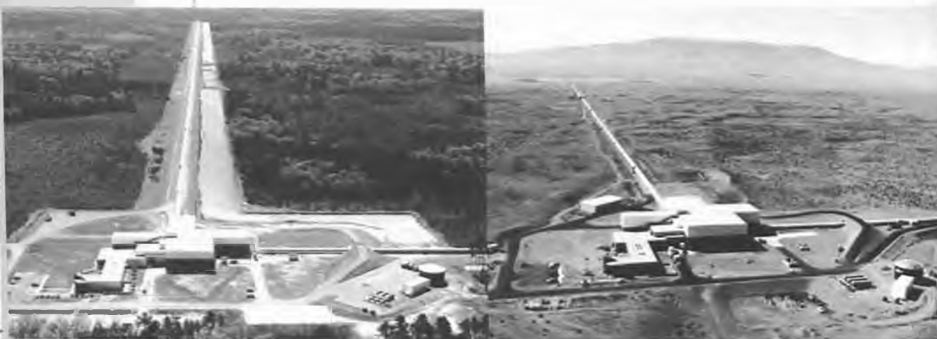
Από τα πειράματα που γίνονται στο MIT.

Νέα Περιφεριακή Οδός Βεροίας Τηλ. 23310 - 76111, Fax 23310 - 76112