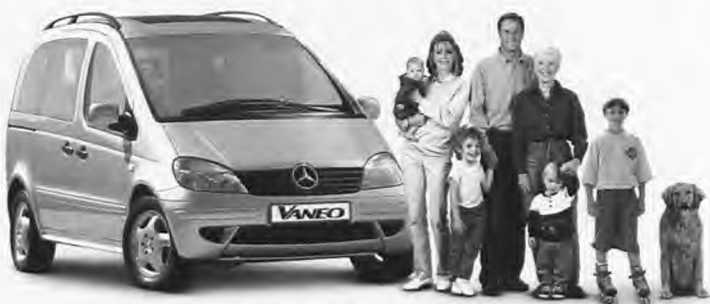
Σαββατοκύριακο: "Θέλω χώρο για βόλτα με την οικογένεια"...

Mercedes-Benz - ένα προϊόν του ομίλου DaimlerChrysler