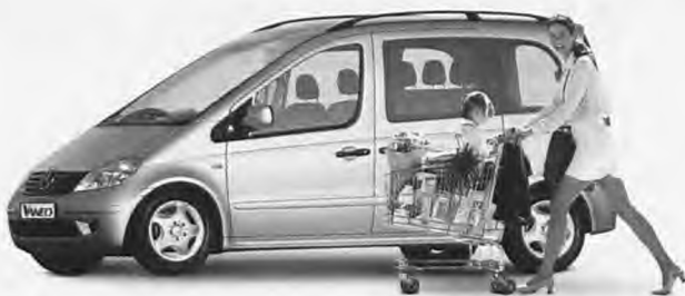
Τρίτη: "Θέλω χώρο για ψώνια"...