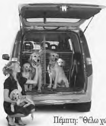
Πέμπτη: "Θέλω χώρο για τους φίλους μου"...