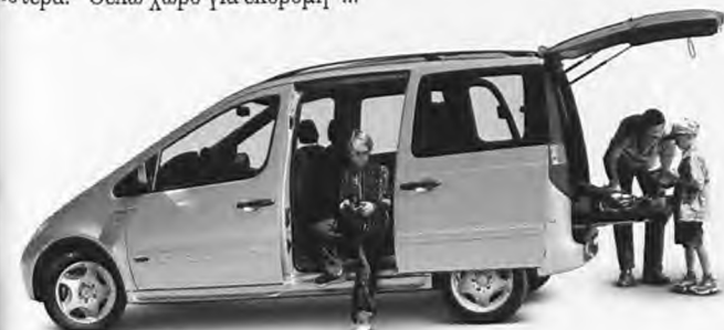
Τετάρτη: "Θέλω χώρο για παιχνίδια"...