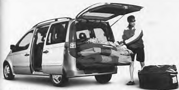
Δευτέρα: "Θέλω χώρο για εκδρομή"...

Vaneo, το μεγάλο πολυμορφικό της Mercedes-Benz.