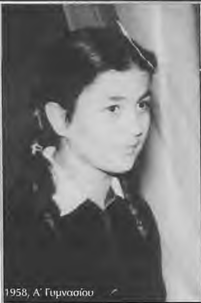
1958, Α' Γυμνασίου