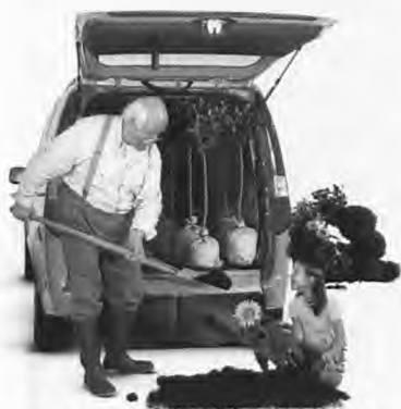
Παρασκευή: "Θέλω χώρο για τα χόμπι μου"...