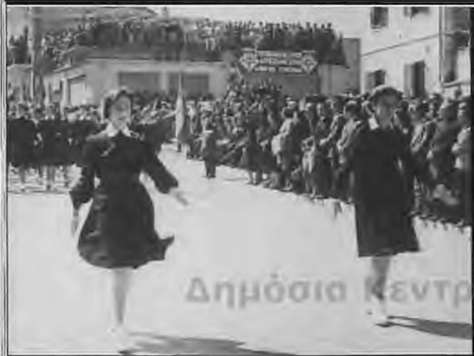
1958 Πόρτα Μ. Γυμνασίου Παν. Αθηνών στις 28 Οκτωβρίου

Ο Ρουφογάλης, παρ' ότι επαγγελματίας εργένης της έκανε πρόταση γάμου γιατί θεωρούσε ότι δεν ήταν