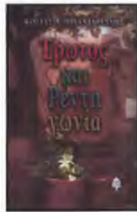
Ερωτος και Ρέντη γωνία Του Κώστα Τριανταφύλλη Εκδόσεις ΚΕΔΡΟΣ

Με αφορμή τις επιστολές της αγαπημένης κόρης του Γαλιλαίου, της Αδελφής Μαρίας Τσελέστε που έζησε από μικρή σε μοναστήρι, η σπγγραφέας παρουσιάζει τις άγνωστες πτυχές του μεγάλου επιστήμονα, «πατέρα» της σύγχρονης φυσικής. Οι επιστολές αυτές αναπλάθουν την ιστορία του Γαλιλαίου και δίνουν νέο χρώμα στην προοπτικότητα και τον αγώνα ενός μυθικού ανθρώπου και επιστήμονα φωτίζοντας πλευρές της κοπιαστικής επιστημονικής του εργασίας, της προσωπικής του ζωής και του χαρακτήρα του.