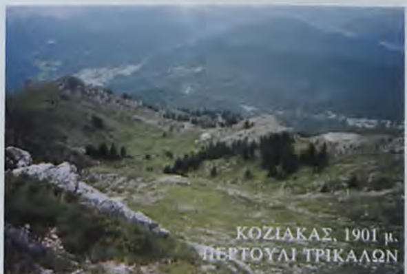
ΚΟΖΙΑΚΑΣ, 1901 μ. ΠΕΡΤΟΥΛΙ ΤΡΙΚΑΛΩΝ