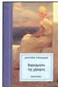
Βαρκάρισσα της Χίμαιρας Της Αλκωνής Παπαδάκη Εκδόσεις ΚΑΛΕΝΤΗΣ

Τα ασαφή και συχνά ασυμβίβαστα όρια αγάπης και αφοσίωσης, σ' έναν άντρα, σ' ένα λαό, σε μια χώρα, εξερευνά το ΣΟΥΛΧΑ, λυρικά και συναρπαστικά. Είναι η ιστορία μιας γυναίκας που αναγκάζεται να φύγει μακριά από τις ανέσεις του σπιτιού της στον Καναδά και να ζήσει με τους Βεδουίνους στην έρημο του Σινά. Προδομένη από την πατρίδα της,