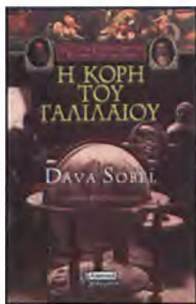
Η κόρη του Γαλιλαίου Της Dava Sobel Εκδόσεις ΕΛΛΗΝΙΚΑ ΓΡΑΜΜΑΤΑ

Η σπγγραφέας αναδεικνύει τις προσπάθειες του Γαλιλαίου να ξεπεράσει το σχίσμα μεταξύ επιστήμης και θεολογίας αναπληρώνοντας σπγγρόνως και μια ολόκληρη ιστορική περίοδο, της Ιταλίας του 16ου και 17ου αιώνα.