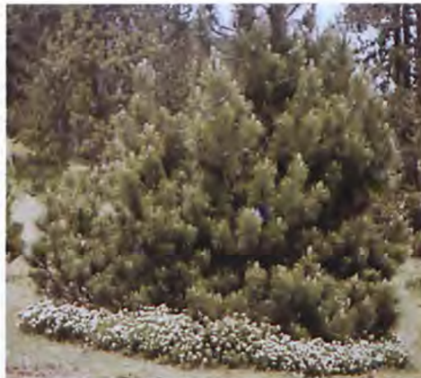
Και η φύση στολίζει τα δημιουργήματα της με γιρλαντες απο αγριολουλουδα.