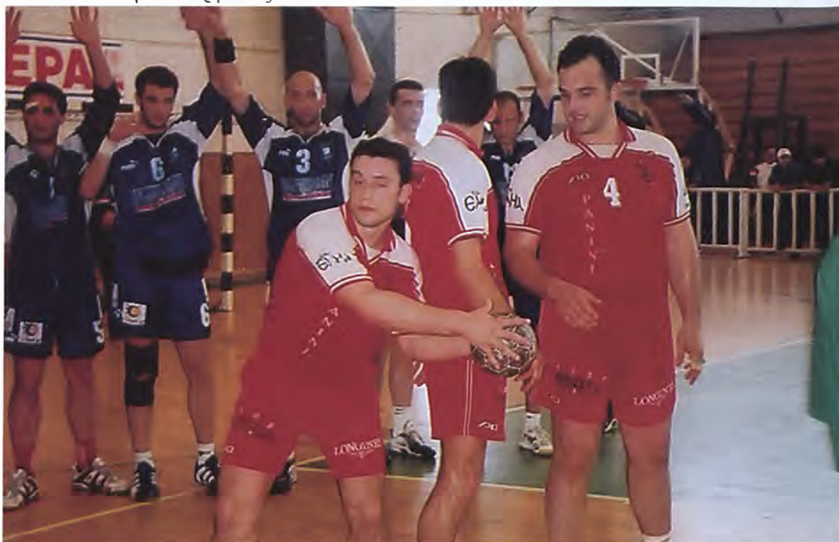
Τον τίτλο του πρωταθλήματος εξασφάλισε ο Δούκας στην περυσινή περίοδο νικώντας τον Φίλιππο μέσα στη Βέροια (19-21) στον τέταρτο αγώνα του τελικού απ’ όπου και το στιγμιότυπο.