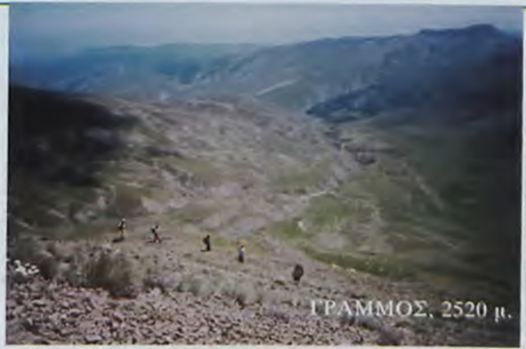
ΓΡΑΜΜΟΣ, 2520 μ.

ο στόχος φαντάζει μακρινός, δύσκολος και σε κάποιες περιπτώσεις ακατόρθωτος.