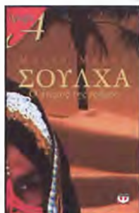
ΣΟΥΛΧΑ Ο άνεμος της ερήμου Της Μάλκα Μαρομ Εκδόσεις ΨΥΧΟΓΙΟΣ

Σ' ένα ξενοδοχείο της Αμοργού, επτά άνθρωποι παραδίδονται σε μια περίεργη ιστορία. Επτά διαφορετικοί άνθρωποι μέσα στη δίνη της μοναξιάς και της μοίρας, του έρωτα και της προδοσίας, του χρόνου και της φυγής, σ' ένα τέλειο σπγγικό ενός άγριου τόπου που μαλακώνει όμως βαθιά. Ο Θεσσαλονικιός σπγγραφέας πλέκει με μυστήριο ένα υπαρξιακό παιχνίδι ανάμεσα στο φαίνασθα και το είναι, στο παρελθόν και το παρόν.