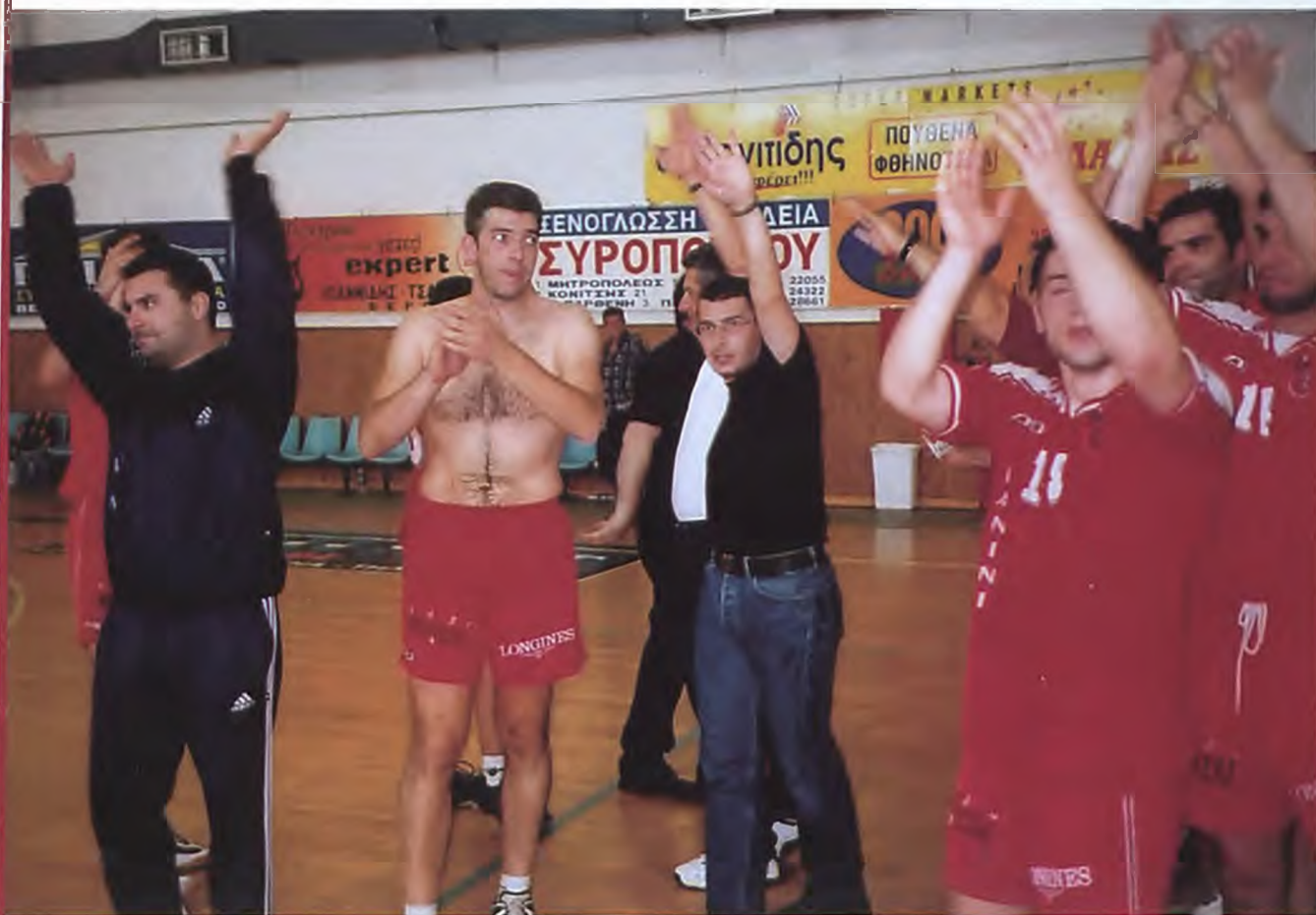
Οι παίκτες του Φιλίππου χαιρετούν το φιλάθλο κοινό τους, αμέσως μετά τη λήξη του τέταρτου στη σειρά αγώνα του τελικού με τον Δούκα, όπου γνωρίζοντας την ήττα αναδείχθηκαν δευτεραθλητές στο φετινό πρωτάθλημα.