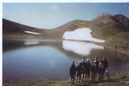
Ορειβατικές αποδρασεις παντος καιρου