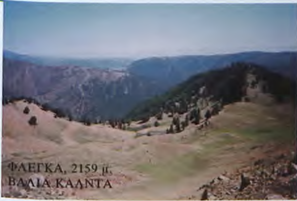
ΦΑΕΓΚΑ, 2159 μ. ΒΑΣΙΛΙΑ ΚΑΛΝΤΑ