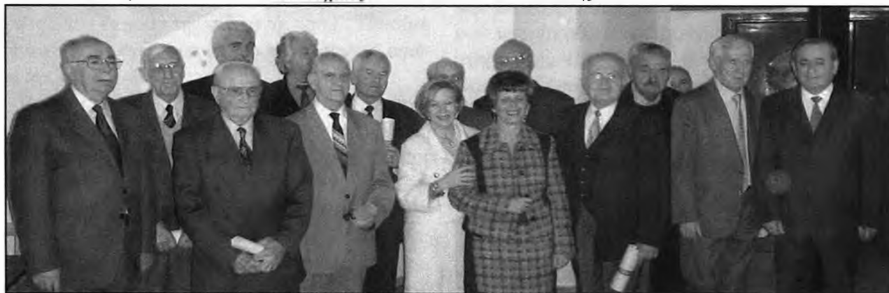
Οι τιμώμενοι με μέλη της Πολιτιστικής Εταιρείας Νάουσας