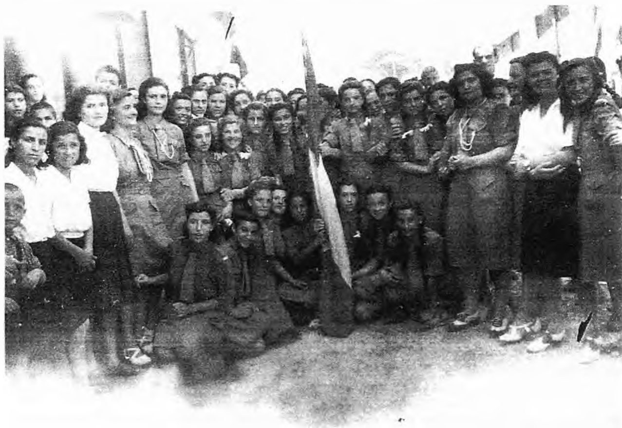
Αναμνηστική φωτογραφία μετά από παρέλαση της 25ης Μαρτίου στα μέσα της δεκαετίας του '40.

Για να πετύχει το σκοπό αυτό, το "οδηγικό πρόγραμμα" προσφέρει μια ποικιλία από ασχολίες και δραστηριότητες, όπως παιχνίδια, τρα-