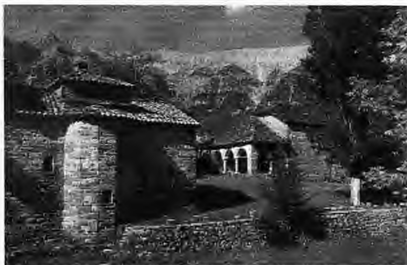
Μονή Αγ. Γεωργίου Μυρόφυλλο. Πολυετής αγώνες της Ε.Ε. για να μη βυθιστεί από τα έργα εκτροπής του Αχελώου

της ΕΕ να μπορούν να λαμβάνουν ενεργό μέρος στις περιοχές και στα θέματα που τα ενδιαφέρουν. Έτσι ο ρυθμός εργασίας έχει γίνει πολύ πιο εντατικός και αποτελεσματικός, ιδιαίτερα στο χώρο της εκπαίδευσης με την ενεργό συμμετοχή εκπαιδευτικών και μαθητών από 170 σχολεία από όλη την Ελλάδα και την Κύπρο, που είναι μέλη των δύο Δικτύων Περιβαλλοντικής Εκπαίδευσης "ΤΟ ΣΠΟΡΑΚΙ, πηγή ζωής" και "Ο ΝΑΥΤΙΛΟΣ ταξιδεύει...".