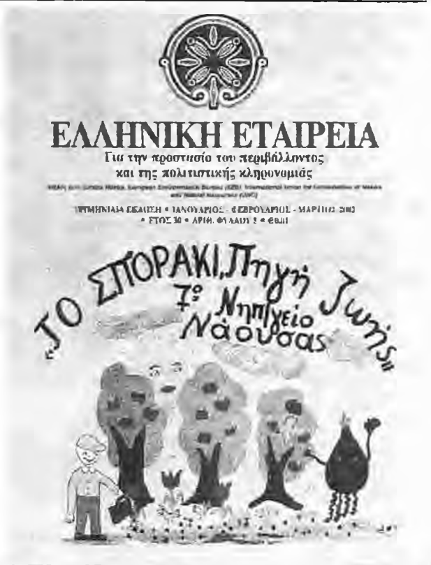
Εξώφυλλο του περιοδικού της Ελληνικής εταιρείας σχετικό με τη Νάουσα

Ενώ αυξάνεται ο ρυθμός με τον οποίο πραγματοποιούνται οι διεθνείς συνεδριάσεις για το πε-