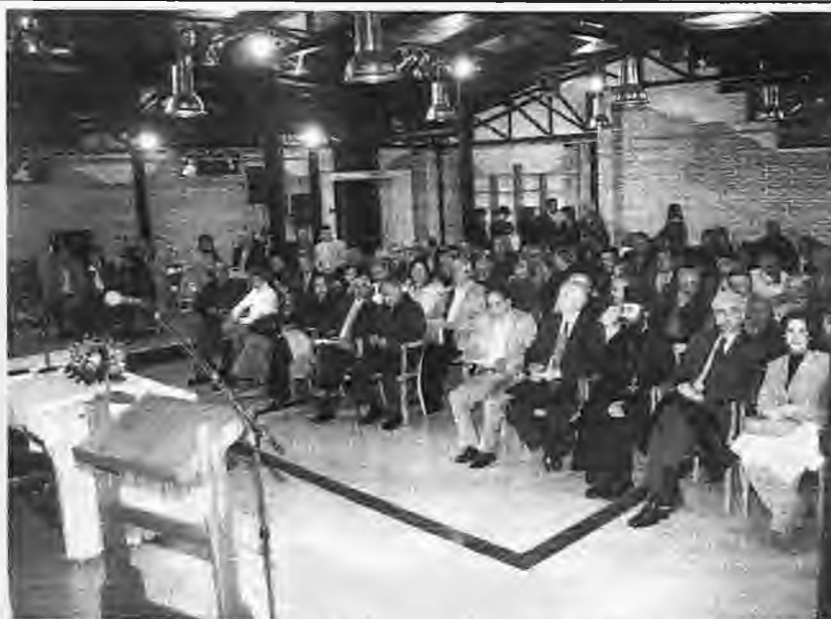
Απο την παρουσίαση του βιβλίου στο Στέκι Νεολαίας του Δήμου Νάουσας

ντικότερη παρακαταθήκη γνώσης και ιστορικής μαρτυρίας και πρόκειται αναμφισβήτητα να σηματοδοτήσει έναν ακόμη πύλο στην διαρκή προσπάθεια ενδελεχούς αναηλίφησης της ιστορίας του τόπου μας. Το πλούσιο αρχαιολογικό υλικό, τα έγγραφα και τα χειρόγραφα που περιλαμβάνονται στην έκδοση, 690 συνολικά, επιβεβαιώνουν την τεράστια προσφορά και συμβολή της Νάουσας, κομβικό σημείο δράσεως κατά τη διάρκεια του Μακεδονικού Αγώνα. Η συλλογή των χειρογράφων αποτελείται από ένα μεγάλο αριθμό επιστολών και