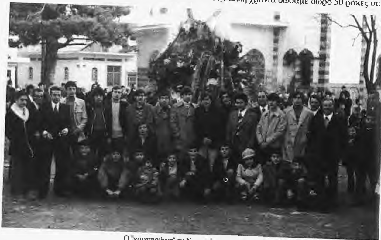
Ο "καρτσιούνος" τα Χριστούγεννα του 1937

Την άλλη χρονιά δώσαμε δώρο 50 ρόκες στον