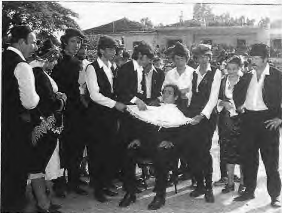
Το ξύρισμα του γαμπρού

Την Κυριακή, μία εβδομάδα πριν από τις σέψεις, στο σπίτι του γαμπρού κατασκεύαζαν τέσσερα κανίσκια, με τα οποία προσκαλούνταν για τον γάμο ο κουμπάρος, η νύφη και τα δύο μπρατίμια και δινόταν το μήνυμα ότι άρχιζε η εβδομάδα του γάμου.