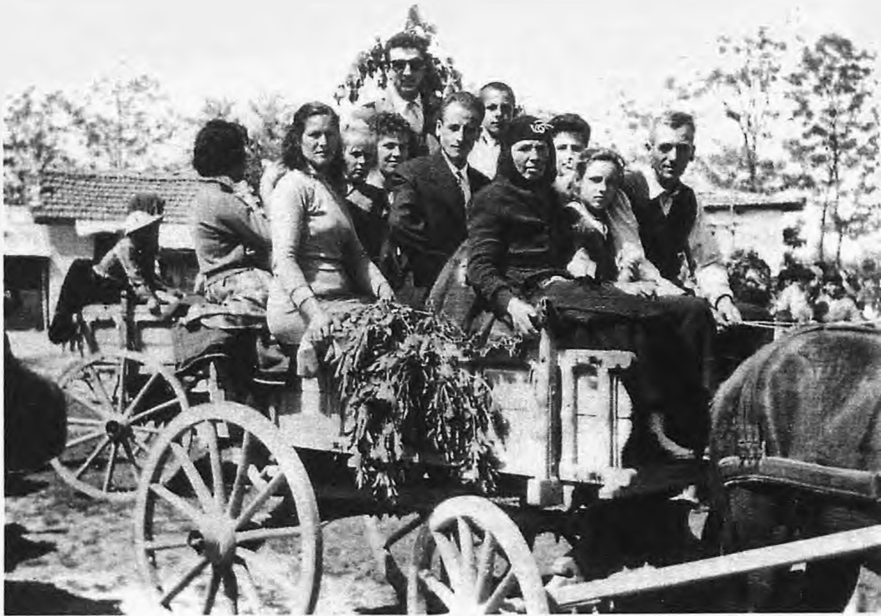
Μεταφορά της προίκας

Η τελετή γινόταν πάντοτε Κυριακή, ενώ οι ετοιμασίες και τα έθιμα διαρκούσαν από την Κυριακή, μία εβδομάδα πριν από τις στέψεις έως και την συμπλήρωση 22 ημερών μετά απ' αυτές.