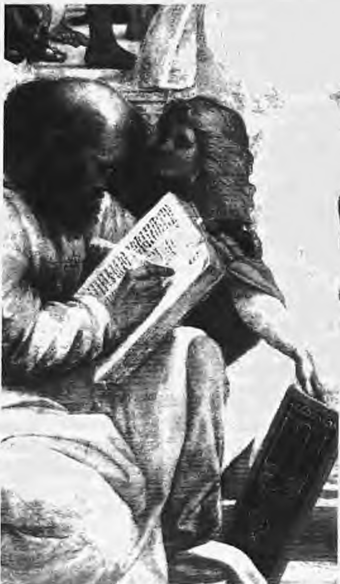
Ο Πυθαγόρας όπως απεικονίζεται στον πίνακα του Ραφαήλ "Η Σχολή των Αθηνών". Λεπτομέρεια, Μουσείο Βατικανού

αυτά που είναι ευχάριστα για τις αισθήσεις. Και από όλες τις στιγμές της μέρας σε δύο επιστούσε ιδιαίτερα την προσοχή. Σ' αυτήν πριν από τον ύπνο και την στιγμή της εγέρσεως από αυτόν. Προέτρεπε λοιπόν "Να μην δεχθείς τον ύπνο στα μαλακά σου μάτια πριν τρεις φορές εξετάσεις καθένα από τα έργα της ημέρας και πεις 'πή παρέβην; τί δ'έρεξα; τί μοι δέον ουκ επετελέσθη;" δηλ. τι παρέλειψα; τι δεν έπραξα; τι ενώ έπρεπε να γίνει από εμένα δεν έγινε; Και πριν σηκωθείς από τον ύπνο να ρωτήσεις τον εαυτόν σου "Τι πρακτέον;" Τι πρέπει να κάνω σήμερα: