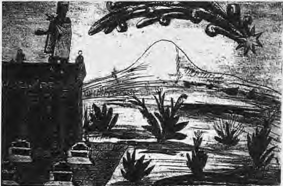
Ένας κομήτης, το "αστέρι που καπνίζει" προειδοποίησε τον Μοντεζούμα για τον επερχόμενο κίνδυνο, λίγο πριν την άφιξη του Κορτεζ στο Μεξικό (1519)

Ανεξάρτητα όμως από την ιστορική πραγματικότητα του άστρου των Χριστουγέννων, αξίζει το άστρο αυτό για άλλη μια χρονιά σύμβολο ελπίδας για όλους τους ανθρώπους της Γης τις άγιες αυτές ημέρες.