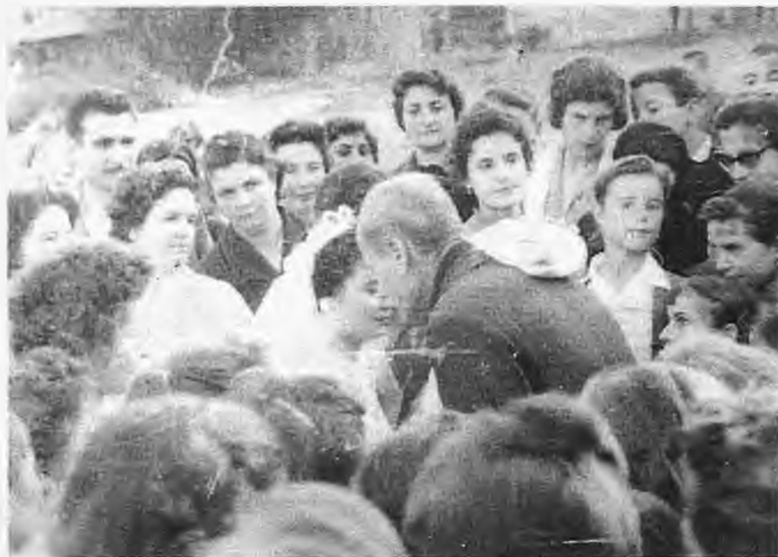
Η νύφη προσκυνάει και δωρίζει τον πεθερό της