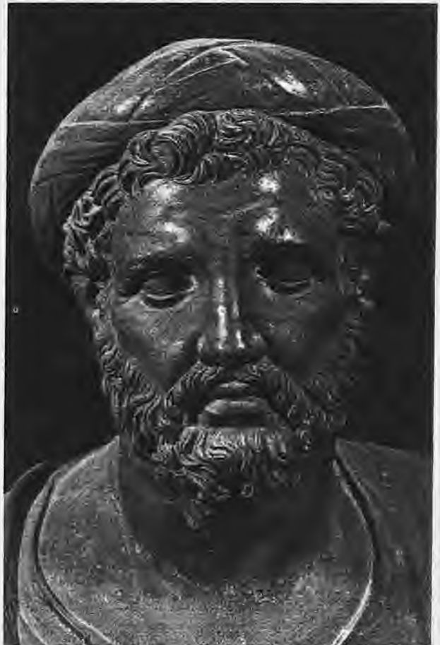
Πυθαγόρας ο Σάμιος (Ρωμαϊκό αντιγραφο χάλκινης κεφαλής του Ε' αιώνα π.Χ., Νεάπολη, Εθν. Μουσείο)

Ο Πυθαγόρας γεννήθηκε περί το 586 π.Χ. Όπως μαρτυρούν οι βιογραφίες των δύο Νεοπλατωνικών Πορφυρίου και Ιάμβλιχου αλλά και αποσπάσματα απο το έργο του Αριστοτέλη "περί Πυθαγορείων" οι αρχαίοι απέδιδαν στον Πυθαγόρα Θεϊκή καταγωγή. Ο πατέρας του ο