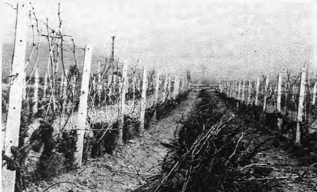
Κάθαρος τον Δεκέμβριο σε αμπέλι ροζακί στη Χαλκιδική

Μερικοί εντούτοις αμπελουργοί κάνουν και τον “κάθαρο” και το κλάδεμα μαζί. Νομίζουμε ότι ανάλογα μπορεί ο καθένας κατά την κρίση του να ενεργήσει, κόβοντας και κάνοντας με τον καθαρο τις βασικές τομές σε κούτσουρα που πρέπει να διορθώσει το σχήμα τους ή να κόψει με το πριόνι ή με το ψαλίδι ξυλοποιημένα μέρη τους. Πάνω στο πρέμνο αφήνει μόνο τις καλές, παραγωγικές κληματίδες που θα τις κλαδέψει