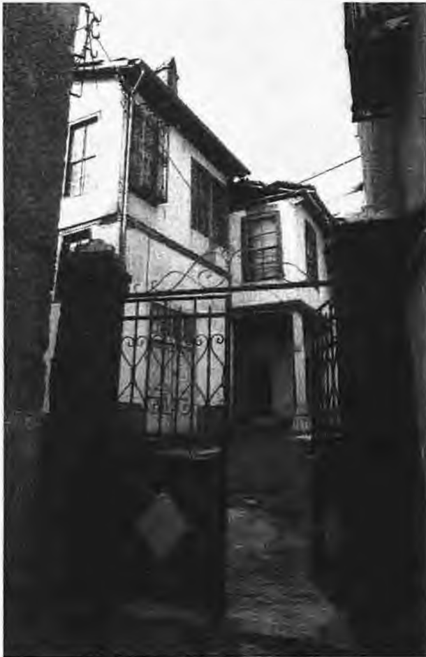
Το στενό του Κόλλου

Τόσο οι άνδρες από την Πουλιάνα, όσο και οι γυναίκες, χιλιοτραγουδήθηκαν στα παλαιά