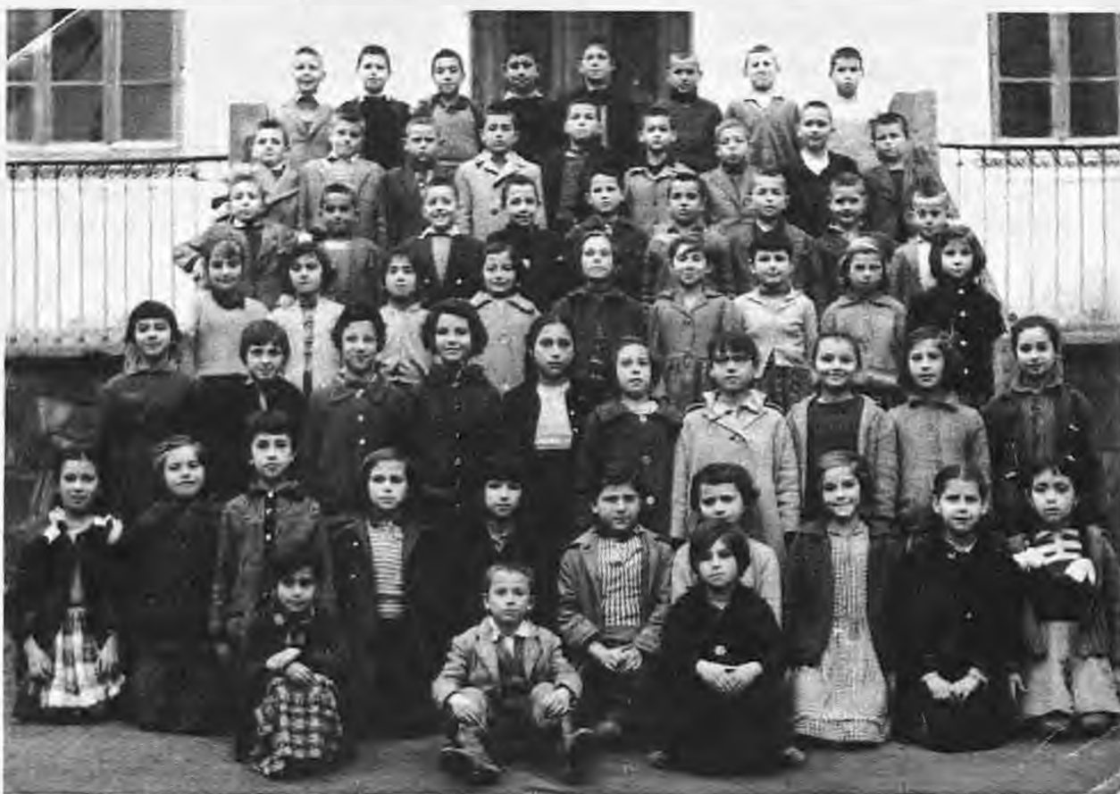
Το νηπιαγωγείο της Μεταμόρφωσης στα σκαλιά του παλιού παρθενγωγείο το 1958

Απέναντι από το στενό αυτό ήταν του Ζώτου, του Ζιάνη, ένα μικρό στενό με έναν αυλόγιο.