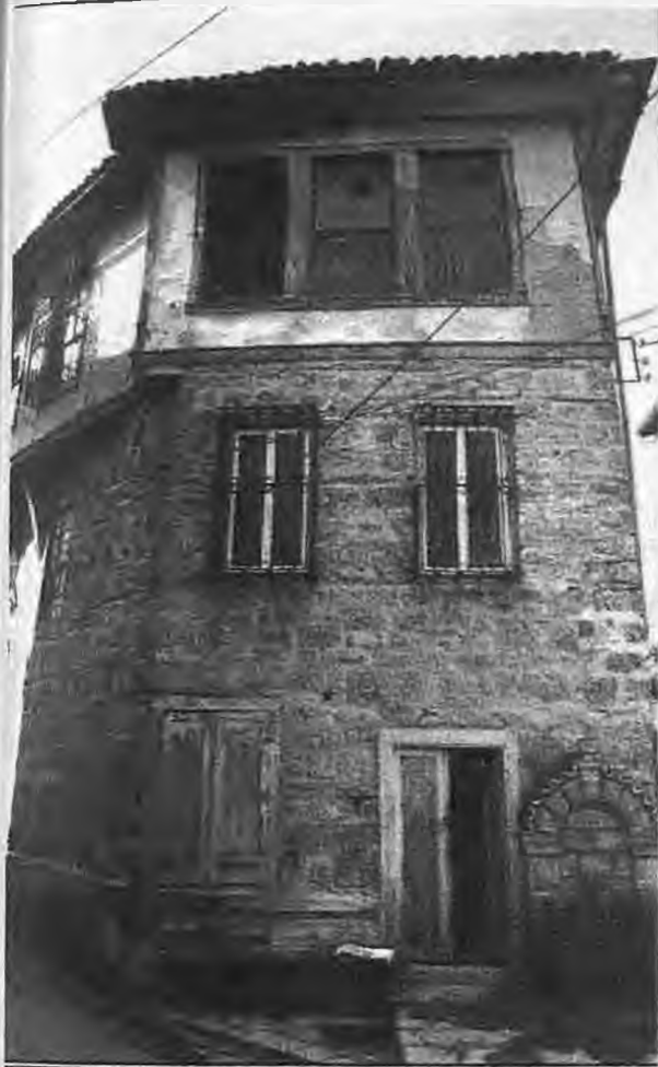
Η οικία Μούγγρη στην πλατεία Πουλιάνια

του ΑΠΘ και του Σωκράτη, που ήταν δικηγόρος και σπουδαίος ποιητής και στην συνέχεια του Αγγελάκη του Μούγγρη που δεσποζεί στην Πουλιάνια και ανοίγει το στενό του Τσιούτα για την Παναγιά του Γκέκα.