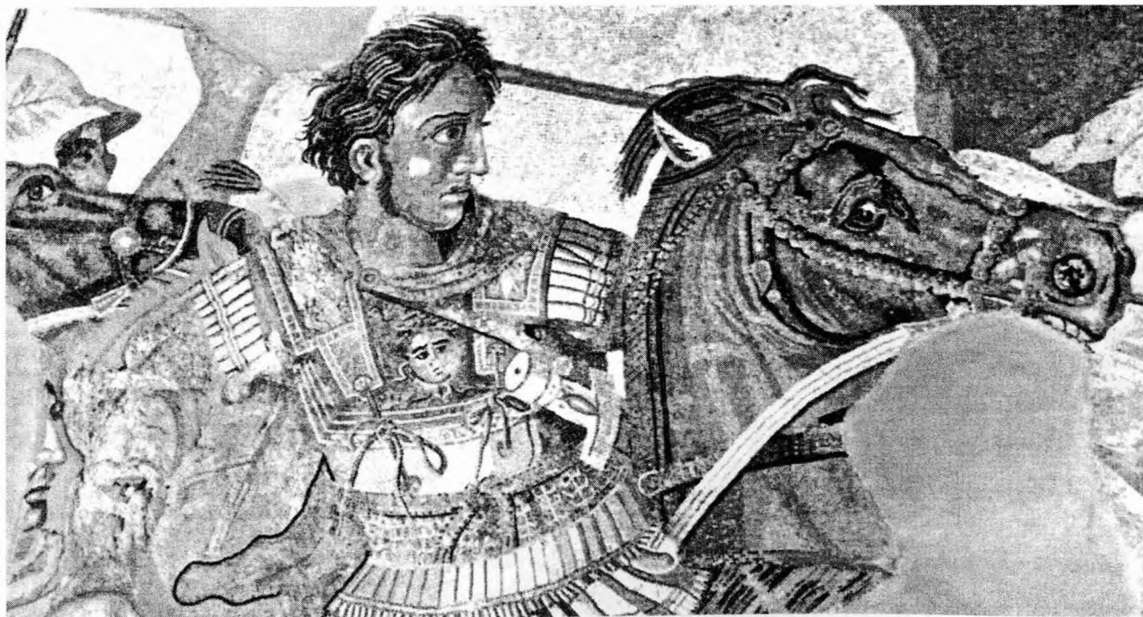
Ο Μέγας Αλέξανδρος. Ψηφιδωτό από την Πομπηία. Αρχαιολογικό μουσείο Νάπολης

Ιστορικοί, αρχαιολόγοι, πάσης φύσεως ερευνητές αλλά και εργάτες, υπάλληλοι, στρατιωτικοί ακόμη και μέντιουμ έχουν ασχοληθεί κατά καιρούς με την ανεύρεση του τάφου, ενώ κάθε φορά που μια καινούρια θεωρία περί αυτού ανακοινώνεται, αμέσως δημοσιεύεται σε όλο τον Παγκόσμιο τύπο.