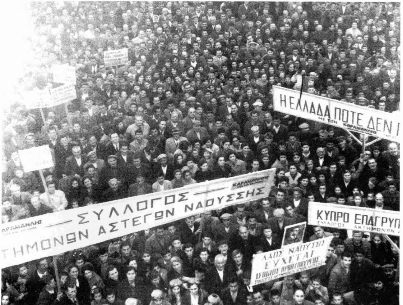
Νάουσα 1956: Συλλαλητήριο των Ναουσιαιών για την διάσωση των εργοστασίων κατά την έλευση του Κωνσταντίνου Καραμανλή στην πόλη

Βέβαια εκ πρώτης όψεως τα μέτρα εκείνα της