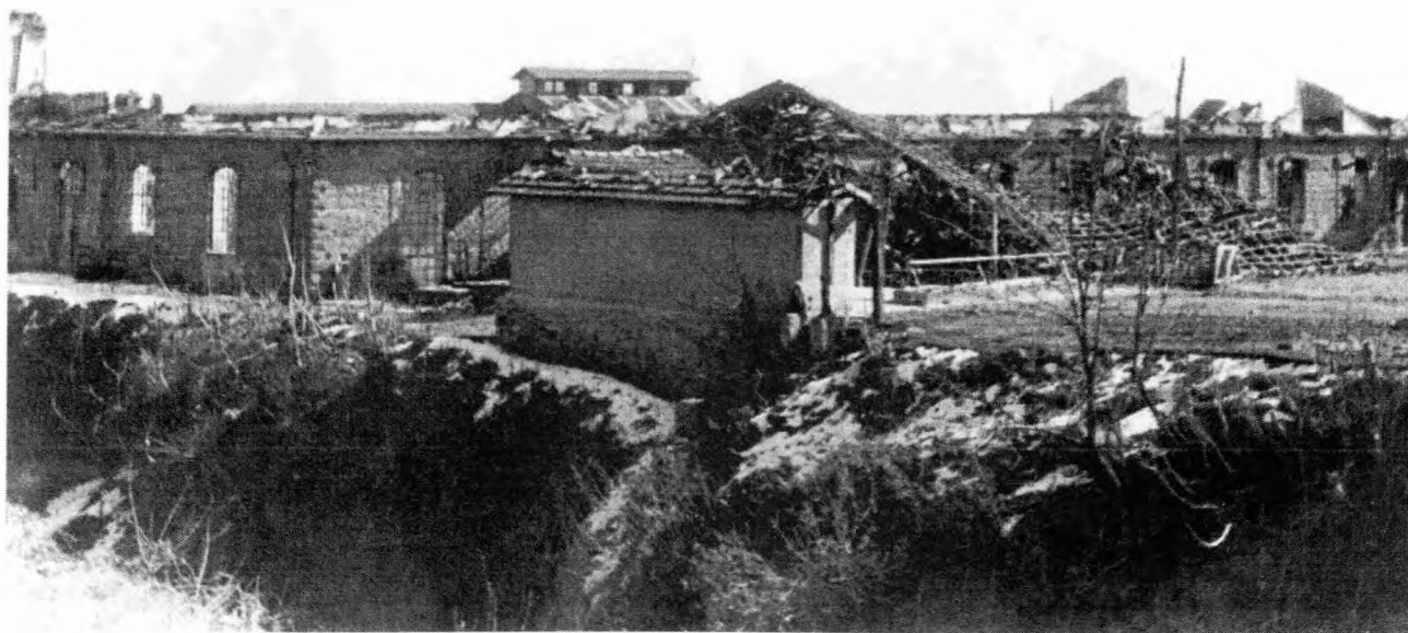
Τα ΕΡΙΑ καμμένα

βιομηχανία της Νάουσας πλήρως απαξιωμένη, με τεράστιες καταστροφές σε κτίρια και μηχανολογικό εξοπλισμό. Αλλά με συγκριτικά πλεονεκτήματα, άριστο ειδικευμένο προσωπικό, τεχνικό και εργατικό. Ιδιοκτήτες - επιχειρηματίες ικανούς, έντιμους και με άριστη γνώση του αντικειμένου και βέβαια μια μεγάλη παράδοση και τεχνογνωσία. Όμως αυτά, μολονότι σημαντικά, εν τούτοις δεν έφθαναν για την κερδοφόρα επαναλειτουργία των εργοστασίων. Απαιτούνταν νέες επενδύσεις σε μηχανολογικό εξοπλισμό, εκσυγχρονισμοί και προσαρμογή στις νέες συνθήκες. Μ' άλλα λόγια απαιτούνται κεφάλαια. Όπως όλα δείχνουν η οικογένεια Λαναρά δεν έκανε πίσω και ίσως είναι από τις λίγες, πανελληνίως, οικογένειες βιομηχάνων, που συνεισέφεραν δικά τους κεφάλαια για την επαναδραστηριοποίηση των εργοστασίων. Όπως γράφει ο αείμνηστος Θεόδωρος Λαναράς σε επιστολή του προς τον τότε Υπουργό Βιομηχανίας και Εμπορίου Παπαληγούρα, η οικογένεια Λαναρά εισέφερε περί τις 20.000 χρυσές λίρες (βλέπε φωνή της Ναούσης, φύλλο της 28/4/1975).