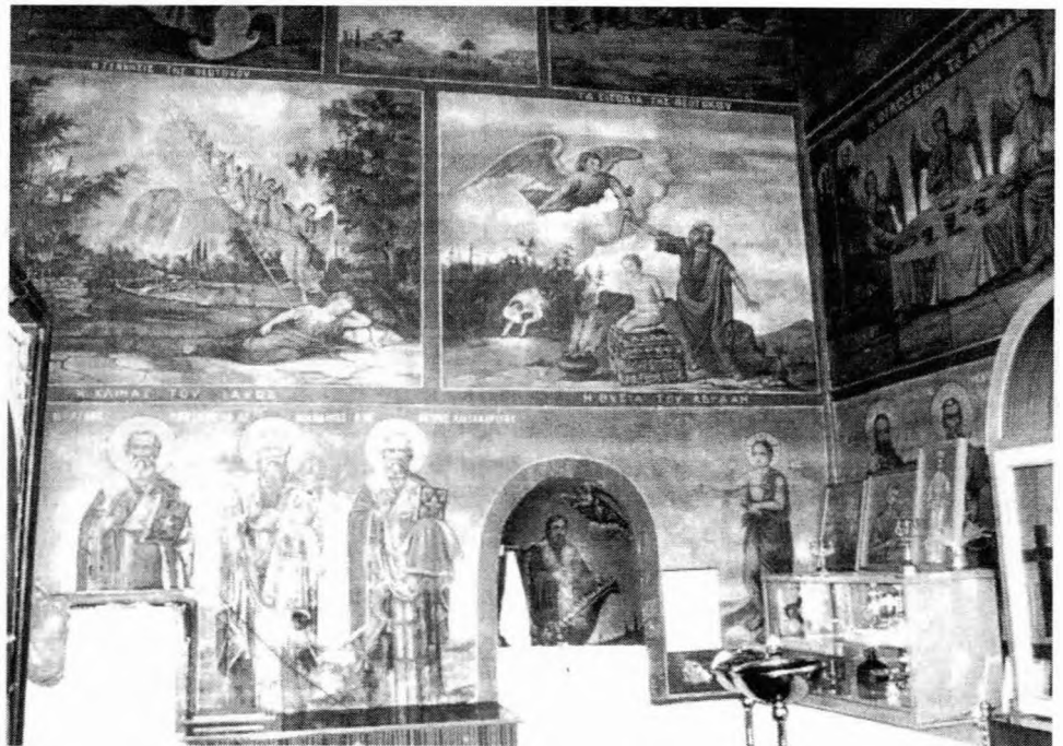
Τοιχογραφίες στο εσωτερικό του Ιερού Βήματος