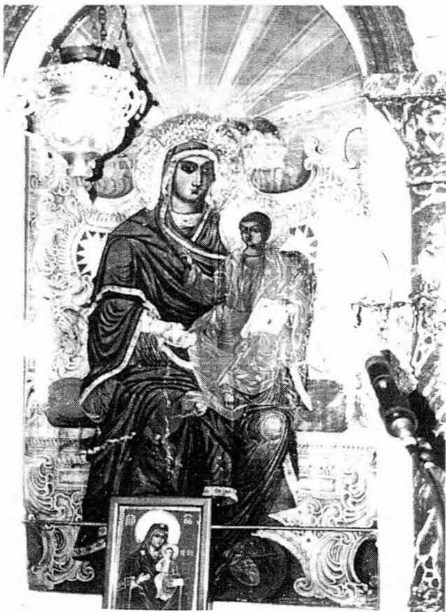
Η Παναγία Βρεφοκρατούσα