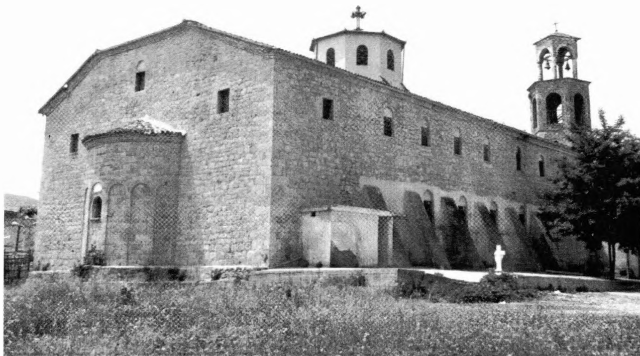
Βορειανατολική άποψη του ναού

περιουσιακά στοιχεία, δεν διαθέτουμε πολλές πληροφορίες σχετικά με τη διαχείρισή τους. Ενδεικτικά αναφέρουμε Πωλητήριο - έγγραφο του 1868 με το οποίο ο Ναός πωλεί κτήμα του στη θέση Παπαράντος. Διαβάζουμε σχετικά: