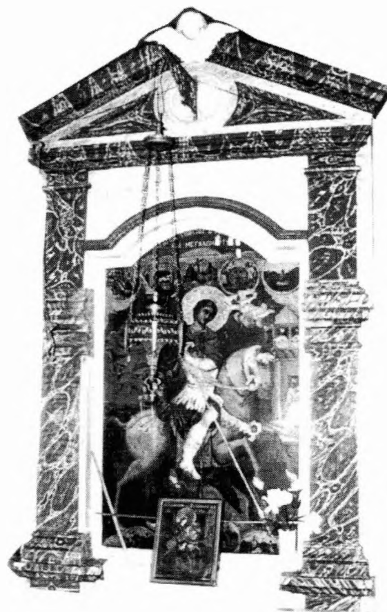
Το προσκηνητάρι με τον Άγιο Γεώργιο

Η επόμενη εικόνα του τέμπλου είναι αφιερωμένη στο πρόσωπο του Αγίου Κλήμη αρχιεπισκόπου Οχριδών του Θαυματουργού. Ο Άγιος με πλήρη αρχιερατική στολή (μούσσο) με το δεξί του χέρι ευλογεί, ενώ με το αριστερό κρατά κλειστό ιερό Ευαγγέλιο. Το εξώφυλλο του Ευαγγελίου είναι διακοσμημένο με την ολόσωμη μορφή του ευλογούντα Χριστού. Παράλληλα με το δεξί του χέρι ο Άγιος συγκρατεί την αρχιερατική ποιμαντική του ράβδο.