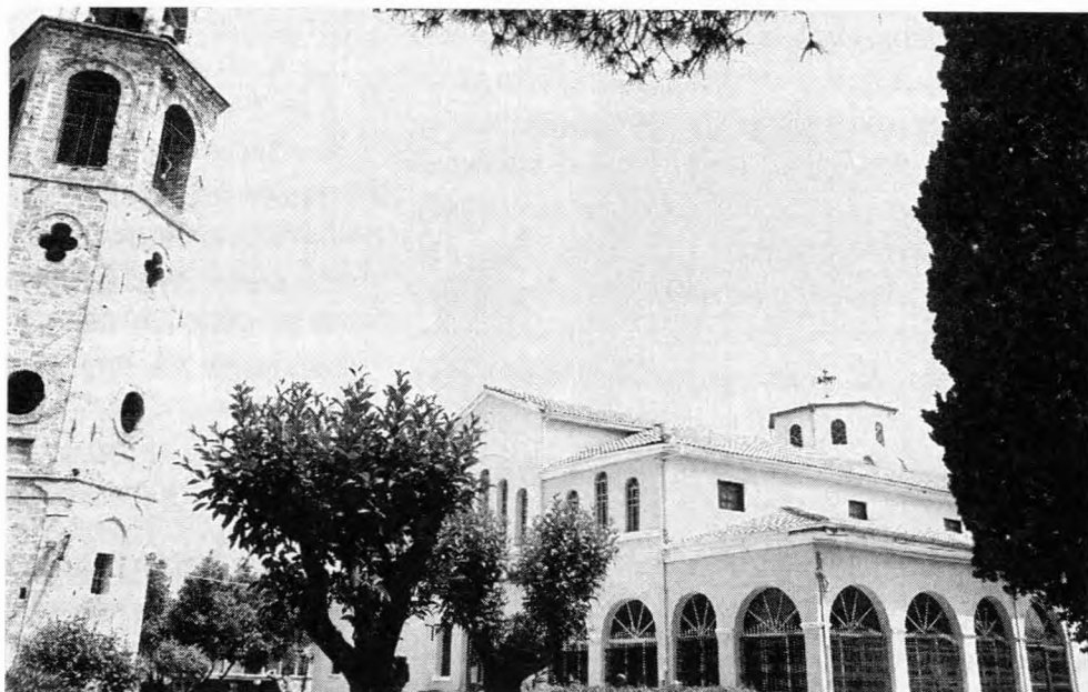
Γενική άποψη του Ναού και του καμπαναριού από τα νοτιοδυτικά

Να πως περιγράφει στο μνημειώδες έργο του Ε. Στουγιαννάκης τα γεγονότα των πρώτων ω-