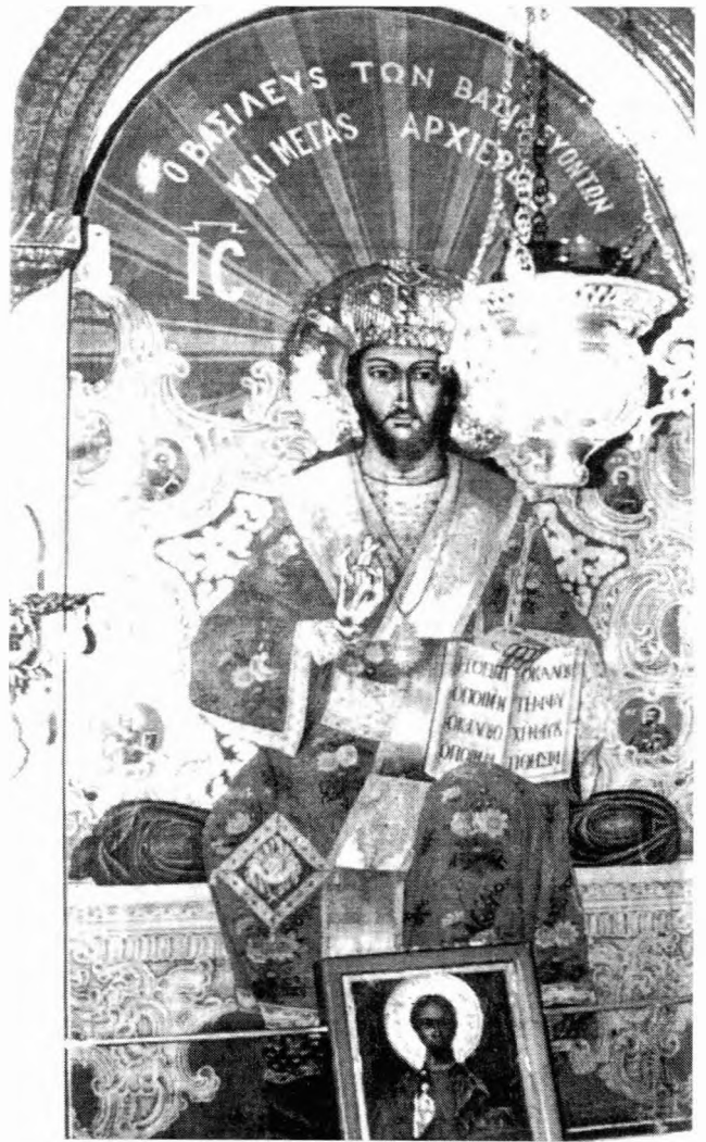
Ο Βασιλεύς των Βασιλέων και μέγας Αρχιερεύς