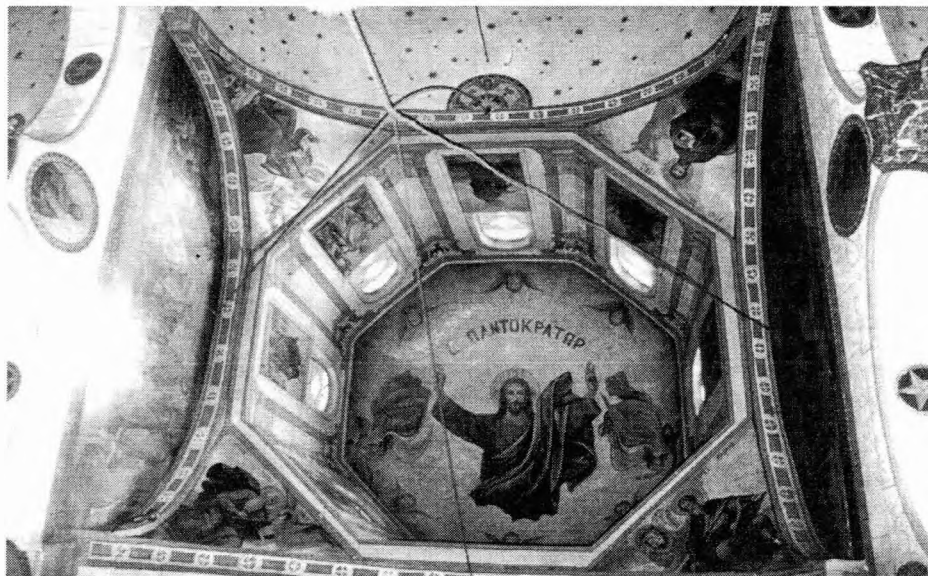
Ο τρούλος του του ναού (μεταγενέστερη προσθήκη)

ΕΓΩ ΕΙΜΙ / Ο ΠΟΙ- ΜΗΝ / Ο ΚΑΛΟΣ Ο / Ο ΠΟΜΗΝ Ο ΚΑΛΟΣ / ΤΗΝ ΨΥΧΗΝ ΑΥΤΟΥ / ΤΙΘΗΣΙΝ