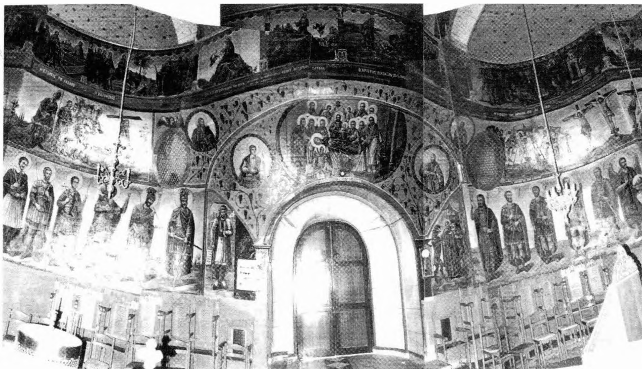
Οι τοιχογραφίες της δυτικής πλευράς του ναού γύρω και πάνω από την είσοδο

Εντιμοτάτων Κυρίων ζοσταράδων δια Γρ: 400 ων η μνήμη αιωνία 1843 Νοεμβρίου 11 χειρ αποστο- λάκη παπά Δημητρ βερροιαίου