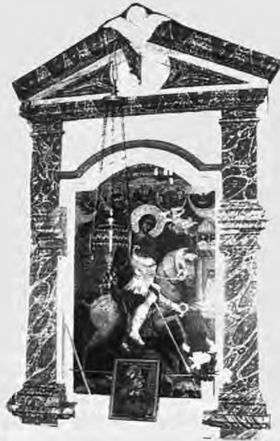
Το προσκυνητάρι με τον Άγιο Γεώργιο

Η επόμενη εικόνα του τέμπλου είναι αφιερωμένη στο πρόσωπο του Αγίου Κλήμη αρχιεπισκόπου Οχριδών του Θαυματουργού. Ο Άγιος με πλήρη αρχιερατική στολή (μπούστο) με το δεξί του χέρι ευλογεί, ενώ με το αριστερό κρατά κλειστό ιερό Ευαγγέλιο. Το εξώφυλλο του Ευαγγελίου είναι διακοσμημένο με την ολόσωμη μορφή του ευλογούντα Χριστού. Παράλληλα με το δεξί του χέρι ο Άγιος συγκρατεί την αρχιερατική ποιμαντική του ράβδο.