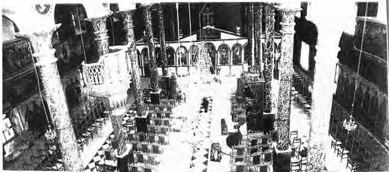
Γενική άποψη του εσωτερικού χώρου του ναού

Το δάπεδο του ναού ήταν επιστρωμένο με τοιμεντοκονίαμα. Πρόσφατα όμως (Φθινόπωρο του 1997) επιστρώθηκε με μαρμάρινες πλάκες σε απλούς δίχρωμους γεωμετρικούς σχηματισμούς.