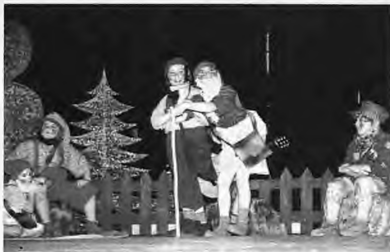
4ο Δημοτικό σχολείο Νάουσας: "Κι έτσι σώθηκε το δάσος"

Το παραμύθι που επιλέχτηκε έχει θέμα την καταστροφή του περιβάλλοντος εξαιτίας της τεχνολογικής ανάπτυξης του ανθρώπου. Η ιστορία διαδραματίζεται σ' ένα δάσος όπου ζουν ευτυχισμένοι και αμέριμνοι, οι ήρωες του έργου, οι νάνοι. Ο ερχομός όμως ενός νάνου από μια μεγαλούπολη φέρνοντας μαζί του και το σύγχρονο τρόπο ζωής, διχάζει τους νάνους. Οι πιο νέοι ασπάζονται το νέο αυτό τρόπο με αποτελέσματα καταστροφικά για το δάσος. Η λύση δίνεται με