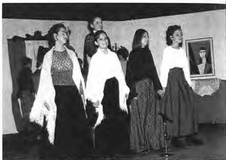
3ο δημοτικό σχολείο Νάουσας: "Παραμύθι χωρίς όνομα"

προς των πυλών! Κανείς δεν έχει διάθεση να πολεμήσει. Μια συντροφιιά όμως καταφέρνει να ξεπνήσει το λανθάνον φιλότιμο των υπολοίπων πατριωτών και έτσι ξεκινάει η προσπάθεια αντίστασης. Και ω! του θαύματος οι χωριανοί αντιτάσσουν, κόντρα στον πανίσχυρο στρατό που τους απειλεί, την ελπίδα, και καταφέρνουν να κερδίσουν με την ψυχική τους δύναμη τον πειθαιναγκασμό των όπλων.