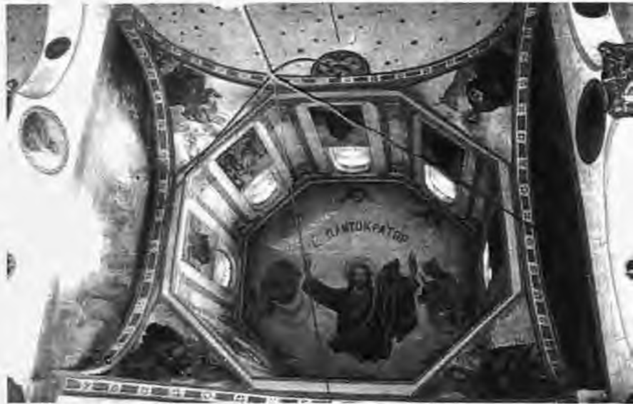
Ο τροίλος του του ναού (μεταγενέστερη προσθήκη)

Επόμενη εικόνα του τέμπλου είναι του Αγίου Ιωάννη του Προδρόμου. Το κεντρικό τμήμα της εικόνας καταλαμβάνει η μορφή του Αγίου που πλαισιώνεται από οκτώ παραστάσεις από τη ζωή και το μαρτύριο του Αγίου, όπως στην περίπτωση του Αγίου Νικολάου, Ο Άγιος με το