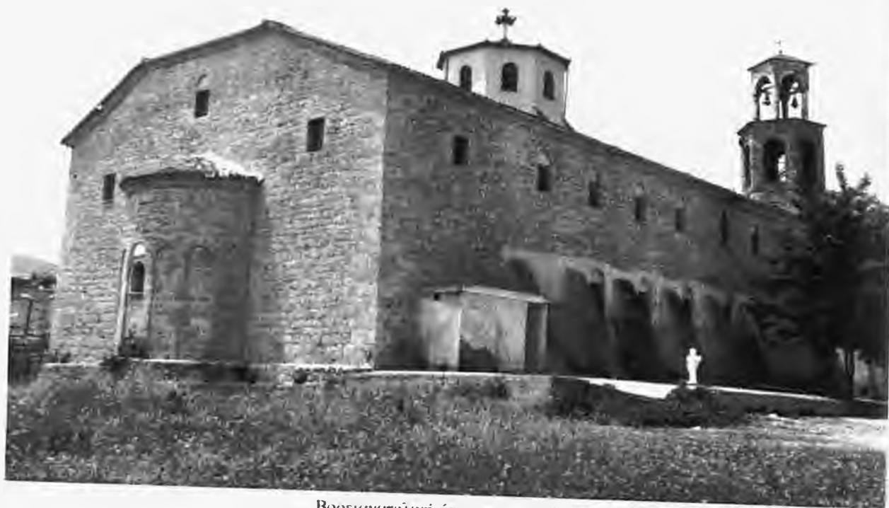
Βορειανατολική άποψη του ναού

περιουσιακά στοιχεία, δεν διαθέτουμε πολλές πληροφορίες σχετικά με τη διαχείρισή τους. Ενδεικτικά αναφέρουμε Πωλητήριο - έγγραφο του 1868 με το οποίο ο Ναός πωλεί κτήμα του στη θέση Παπαράντος. Διαβάζουμε σχετικά: