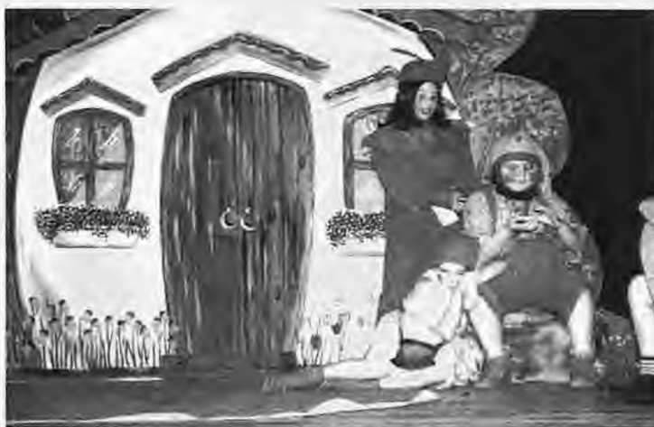
4ο Δημοτικό σχολείο Νάουσας: "Κι έτσι σώθηκε το δάσος"

Κι όλα αυτά το παιδί τα επιτυγχάνει μέσα από ευχαρίστηση, διασκέδαση και προσωπική επιλογή. Να γιατί το θέατρο είναι ένας διαφορετικός δρόμος για την παιδεία.