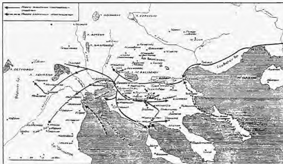
Κινήσεις ελληνικών και τουρκικών στρατευμάτων κατά την επανάσταση Χαλκιδικής και Ολύμπου - Νιούσης

Τα πράγματα βρίσκονταν σ' αυτό το σημείο όταν ο Αβδούλ-Αμπντού βγήκε από της Βέροια με 15 χιλιάδες άνδρες και στις 11 Απριλίου έφθασε εμπρός στη Νάουσα με 12 κανόνια. Υστερ' από σύντομη, αλλά ηρωική άμυνα η πόλη κυριεύθηκε με έφοδο και οι 15 χιλιάδες μουσουλμάνοι στρατιώτες, που τους ακολουθούσε ένα πλήθος Κονιά