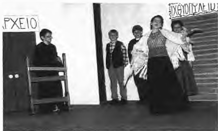
3ο δημοτικό σχολείο Νάουσας: "Παραμύθι χωρίς όνομα"