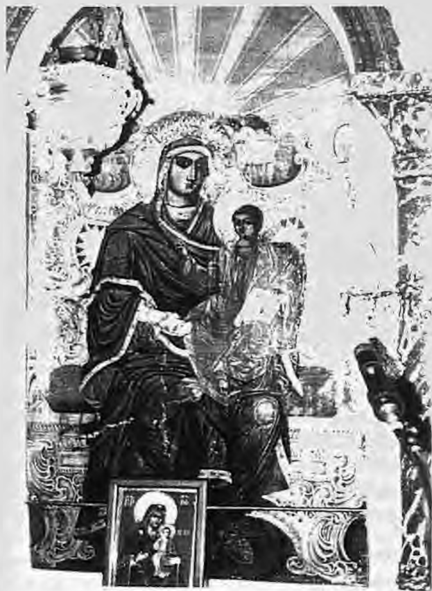
Η Παναγία Βρεφοκρατούσα