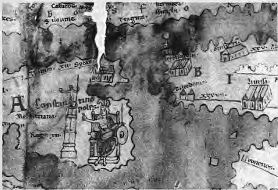
Απεικόνιση της Κωνσταντινούπολης ως γυναίκα στεφάνημένη επάνω σε θρόνο που δείχνει με το χέρι της κίονα από πορφύρεη λίθο με τον ανδριάντα του Κωνσταντίνου ως "λάμποντας Ηλιος" (Βιέννη, Αυστριακή εθνική βιβλιοθήκη)

...του "μαγικού", όπως χαρακτηρίζεται, κύκλου. Ασφαλώς και μαγικός και αποτροπαικός είναι. Αλλά είναι πρώτιστα ιερός, αφού αποτελεί τμήμα της ουρανιας Ιερουσαλήμ, και σκοπός του είναι να τη μεταφέρει στον χώρο. Αυτή η κρίσιμη συμβολική διάσταση παρέμεινε στη νεότερη Ελλάδα στο περιθώριο της συμβολικής σκέψης, αφήνοντας όμως τα ίχνη της. Ο οικισμός που μετατρέπεται σε ουράνια Ιερουσαλήμ είναι καθαγιασμένος, όπως κι εκείνη, τα όριά του είναι προστατευμένα, όπως και σ' εκείνη και ζει αιώνια, όπως κι εκείνη, έχει δηλαδή όλα τα συμβολικά χαρακτηριστικά που διαπιστώσαμε για τον ελληνικό παραδοσιακό οικισμό. Λιγότερο ή περισσότερο ορατή στον εξωτερικό γεωγραφικό χώρο, η ουράνια Ιερουσαλήμ είναι πρώτιστα ένας σημειωτικός εσωτερικός θρησκευτικός τόπος και από αυτό το συμβολικό γεγονός αντλεί την αξία του ο υλικός οικισμός.