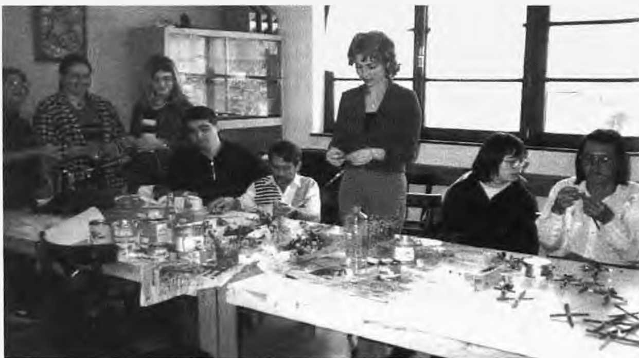
Τα παιδιά του εργαστηρίου επι το έργον με την δασκάλα του