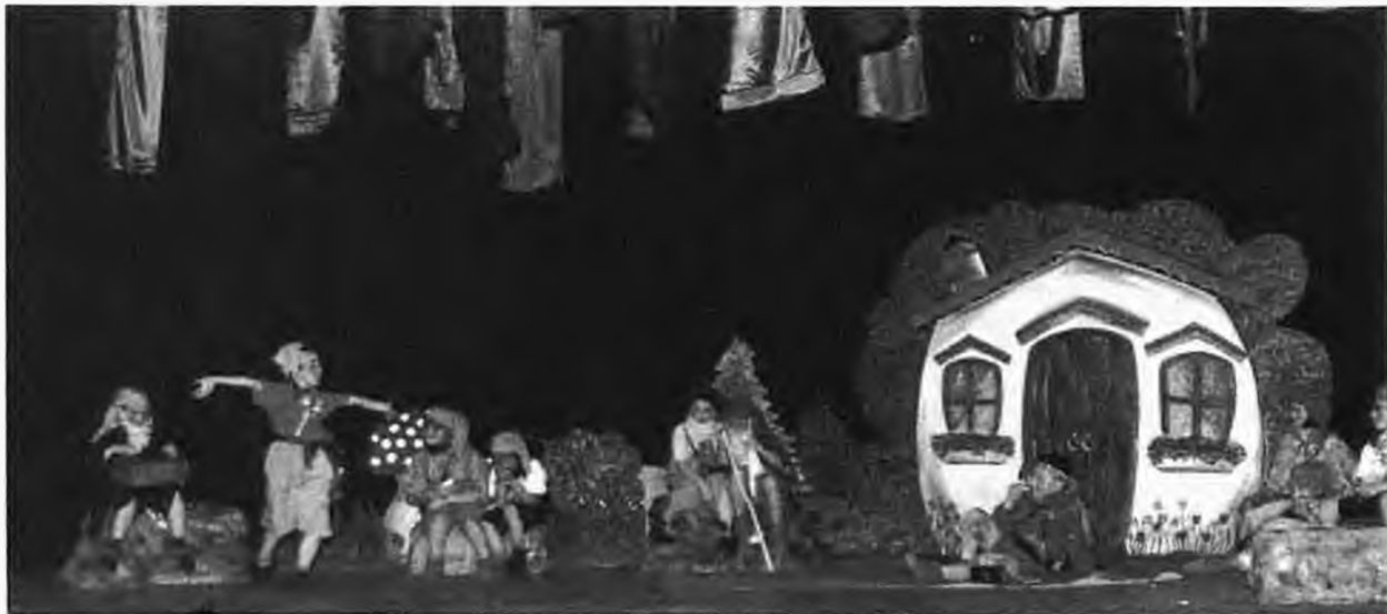
4ο Δημοτικό σχολείο Νάουσας: "Κι έτσι σώθηκε το δάσος"

Μα και στην κοινωνικοποίηση του παιδιού το θέατρο προσφέρει τα μέγιστα. Καθώς το παιδί αντιλαμβάνεται πως είναι μέλος μιας ομάδας με ξεχωριστό ρόλο που βοηθάει στην πραγμάτωση