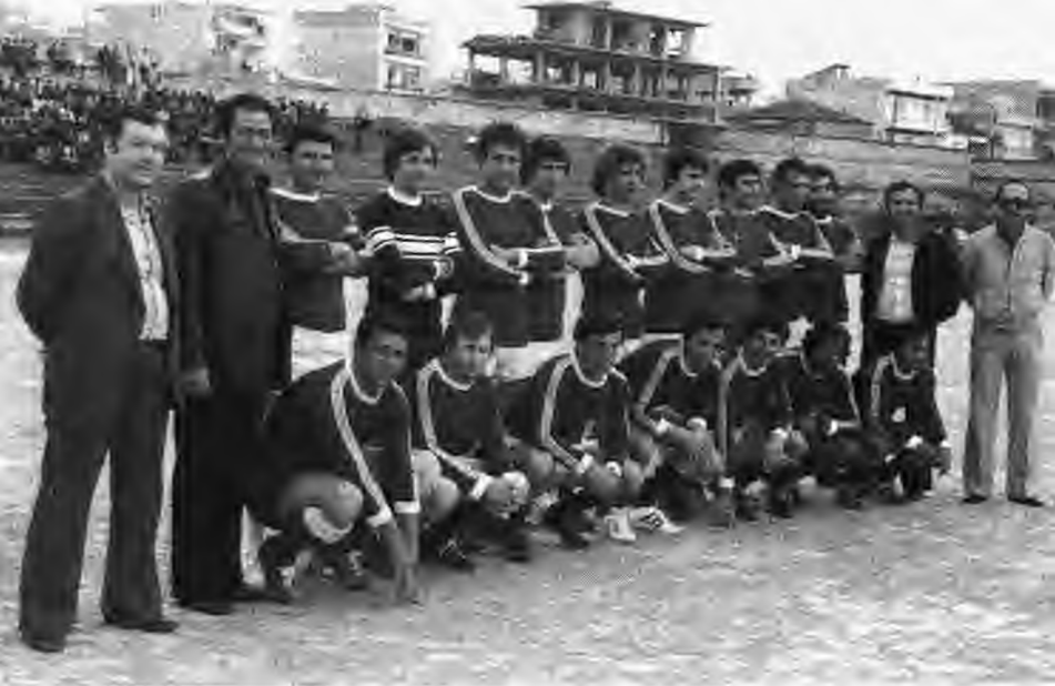
Δημόσιο Κεντρική Βιβλιοθήκη Βεροίας