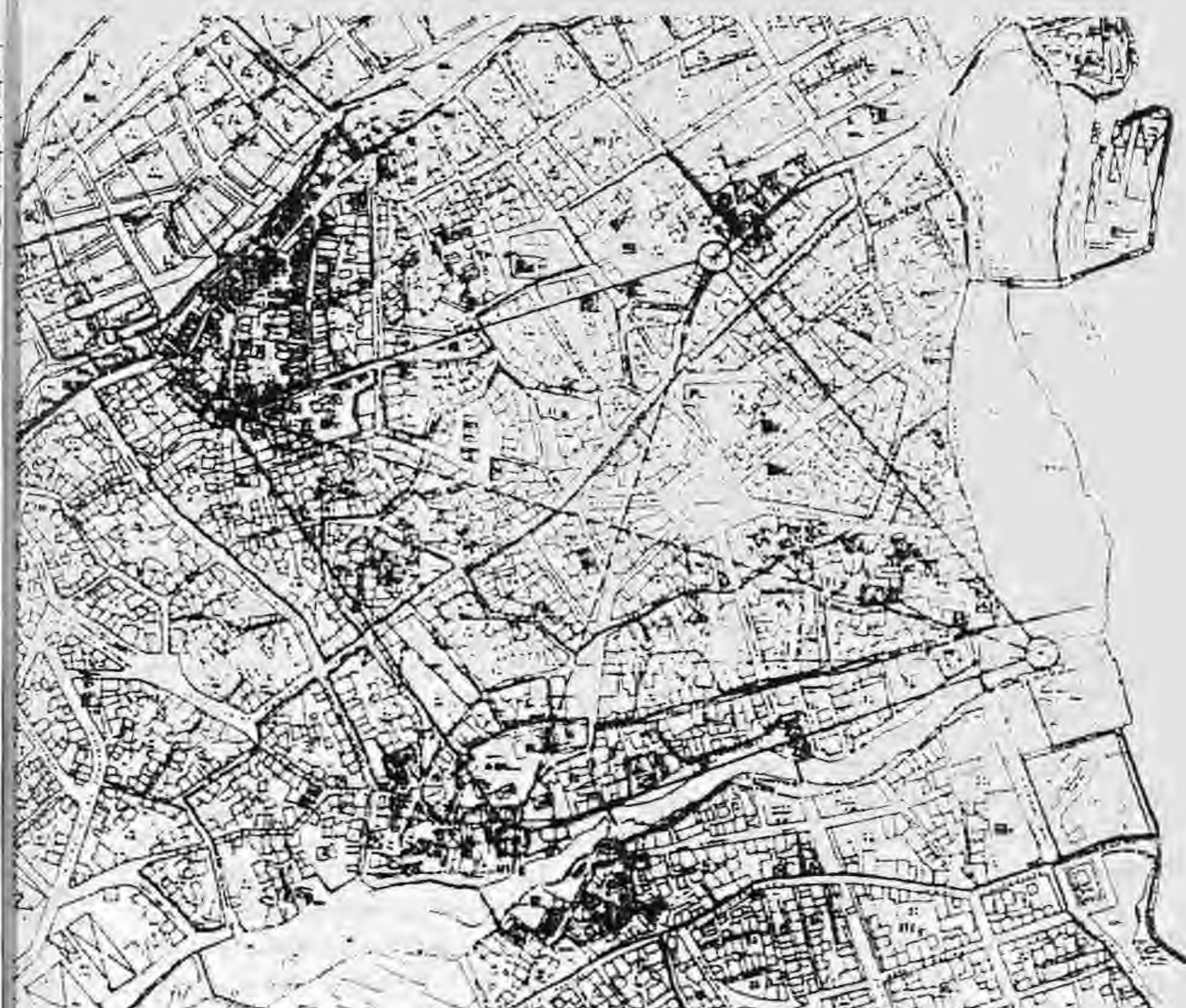
Ακριβείς θέσεις των τεσσάρων πλατάνων

θέσω την περιγραφή του. Το σκέλος του σταυρού Α-Δ είναι μεγαλύτερο και έχει απόκλιση από την ανατολή κατά 18 μοίρες προς νότο. Ο ανατολικός βραχίονάς του έχει μήκος 396 μ. και ο δυτικός 377 μ., είναι δηλαδή μικρότερος του πρώτου κατά 19 μ. και ανέρχεται στα 95% του μήκους του. Ως προς το σκέλος Β-Ν, που έχει την ίδια απόκλιση από τον βορρά προς την ανατολή, ο νότιος βραχίονάς του έχει μήκος 314 μ. και ο βόρειος 278 μ. είναι λοιπόν μικρότερος του πρώτου κατά 36 μ. και ανέρχεται στα 88,5% του μήκους του. Έτσι, το σκέλος Α-Δ έχει συνολικό μήκος 773 μ. και το σκέλος Β-Ν ισούται με 592 μ., δηλαδή το δεύτερο σκέλος είναι τα 76,5% ή τα 3/4 περίπου, του πρώτου. Το περίγραμμα γύρω