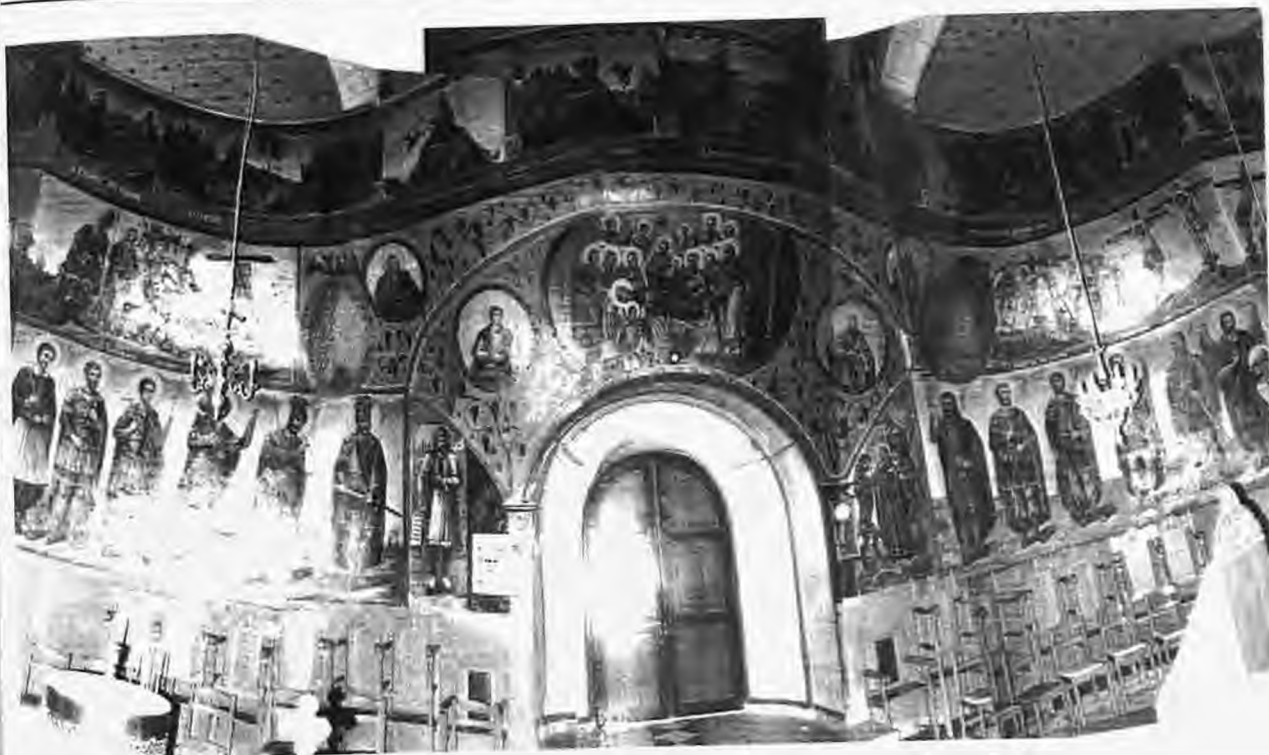
Οι τοιχογραφίες της δυτικής πλευράς του ναού γύρω και πάνω από την είσοδο

Εντιμοτάτων Κυρίων ζοσταράδων δια Γρ: 400ων η μνήμη αιωνία 1843 Νοεμβρίου 11 χειρ αποστο- λάκη παπά Δημητρ βερροιαίου