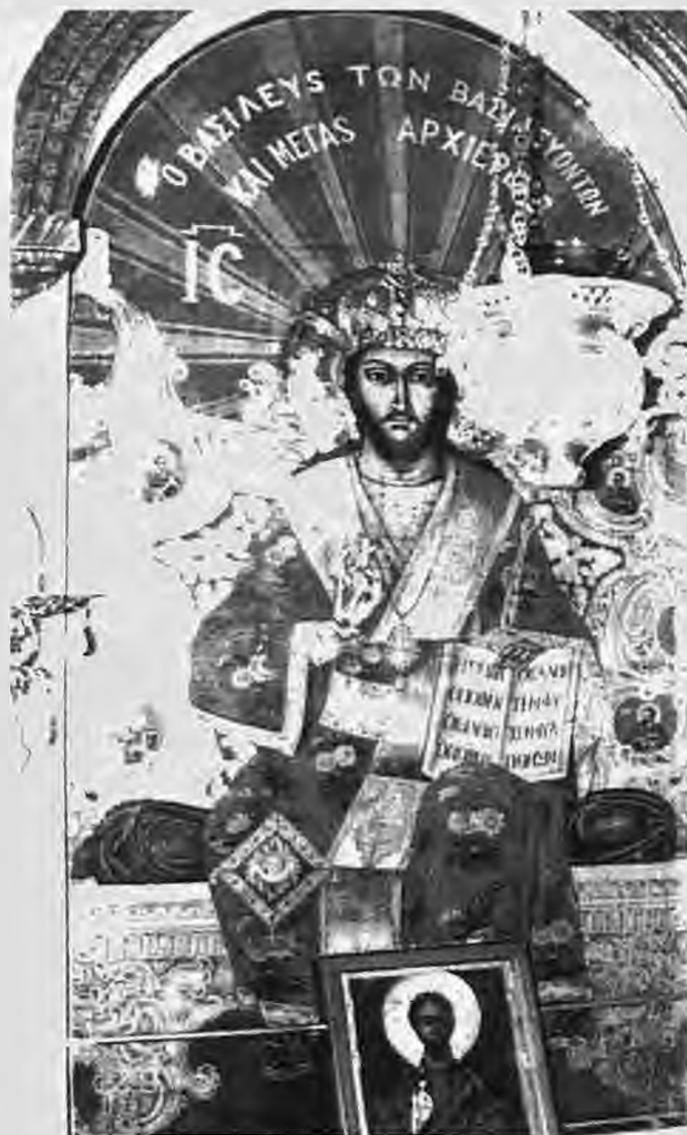
Ο Βασιλεύς των Βασιλέων και μέγας Αρχιερεύς