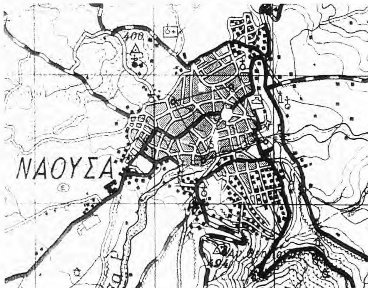
Νάουσα, σταυρωμένη πόλη. Προσεγγιστικές θέσεις των τεσσάρων πλατάνων (υπόβαθρο, χάρτης της Γεωγραφικής Υπηρεσίας Στρατού, κλίμ. 1:20.000 - σχετική έγκριση τη Γ.Υ.Σ.).

Περιζωση μπορεί να γίνει και με ιερά τεχνητά στοιχεία. Είναι ιεροί χώροι διαφόρων κλιμάκων και ειδικότερα ναοί, παρεκκλήσια, εξωκλήσια και εικονοστάσια. Τα χωριά που περιβάλλονται από τέτοια ιερά ορόσημα μπορεί να θεωρούνται ως σταυρωμένα (βλ. Σταμούλη - Σαραντή 1938: