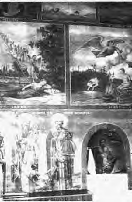
Τοιχογραφίες στο εσωτερικό του Ιε

3. Επιμέλεια Γ. Τουσίμ προς Υπουργό Εξωτερικ 8.1.1868 - Ιστορικό Αρχει κελος 1868 Προξενείου τ