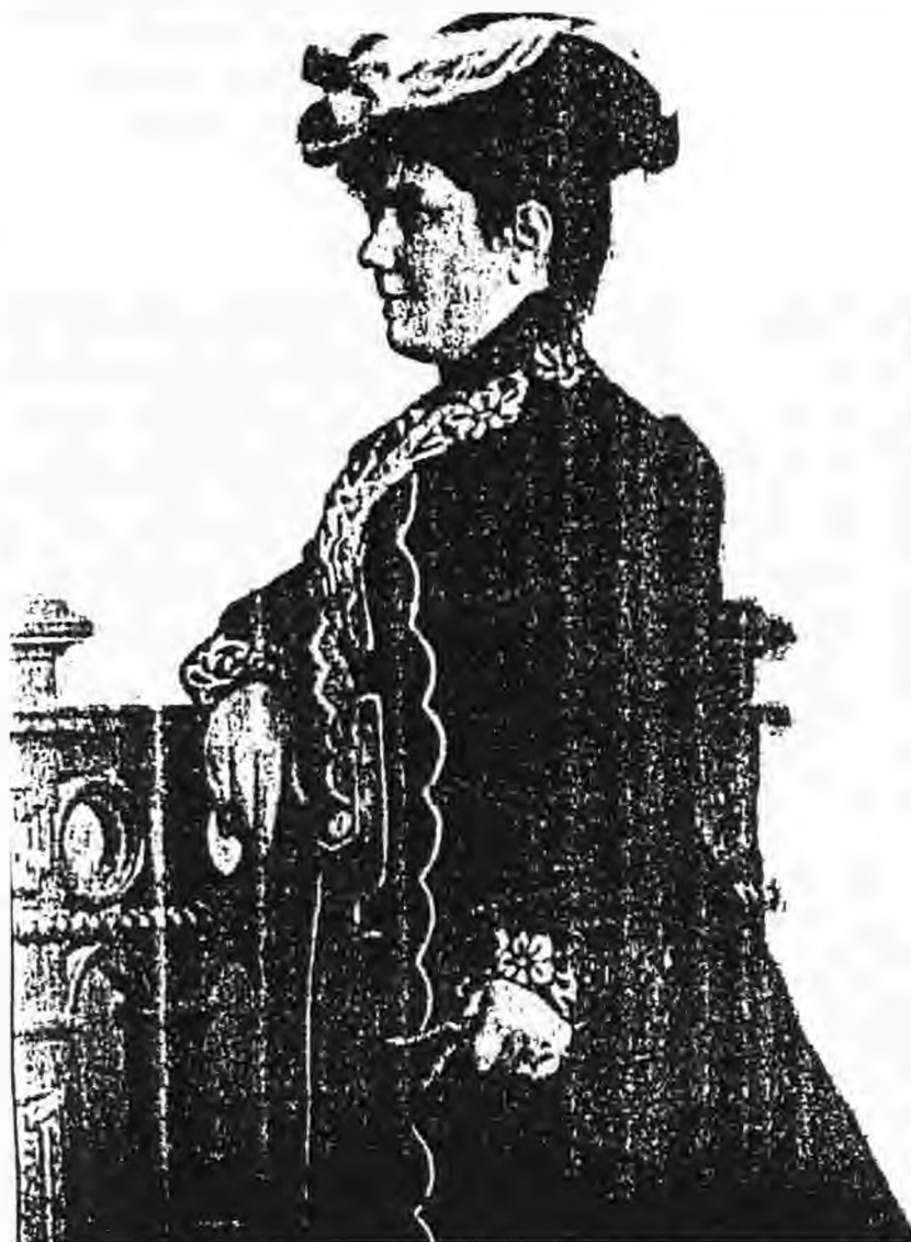
Η Καλλιρόη Παρέν-Σιγανού (1856-1940) είναι η πρώτη Ελληνίδα δημοσιογράφος. Το όνομά της συνδέθηκε με το ξεκίνημα του αγώνα για την οικονομική και τυπική κατοχύρωση των δικαιωμάτων των Ελληνίδων.

πρωτοβουλία, που αναλαμβάνει εξ ολοκλήρου αυτό το έργο.