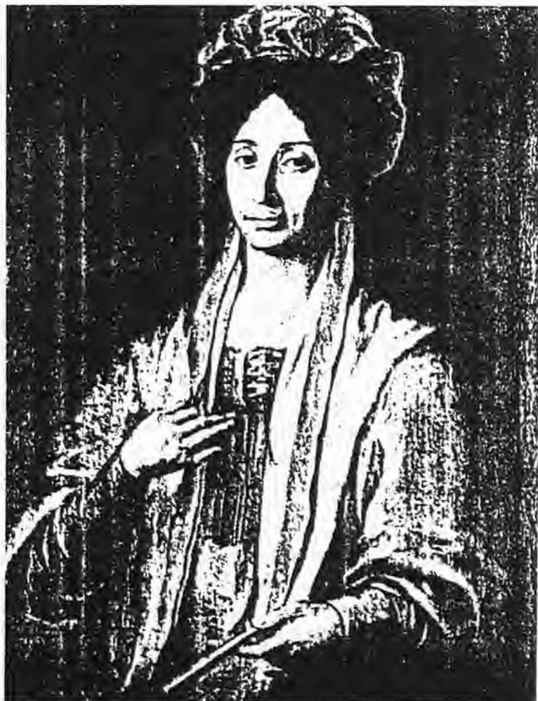
Η Ελισάβετ Μοντζάν-Μαρτανέγκου (1801-1832) είναι η πρώτη Ελληνίδα πεζογράφος. Το λογοτεχνικό της έργο χάθηκε, διασώθηκε μόνο η αυτοβιογραφία της, με εύστοχες παρατηρήσεις για τη ζωή των γυναικών.

Δεν είναι όμως μόνο οι ιστορικοί που δεν αναφέρονται στη συμμετοχή των Ελληνίδων στην Επανάσταση. Το επίσημο ελληνικό κράτος αντιδρά με ένα ιδιαίτερα “ενδιαφέροντα” τρόπο στην αίτηση της Μαντώ Μαυρογένους για συνταξιοδότησή της. Η σύνταξη της χορηγείται μεν αλλά ως “χήρας οπλαρχηγού και απόμαχης”. Η ίδια αντιδρά με επιστολή της στο βασιλιά Οθωνα, όπου δηλώνει “ούτε απόμαχος ήμουν ούτε, αλλά ούτε υπανδρευομένη διά να είναι δυνατόν να