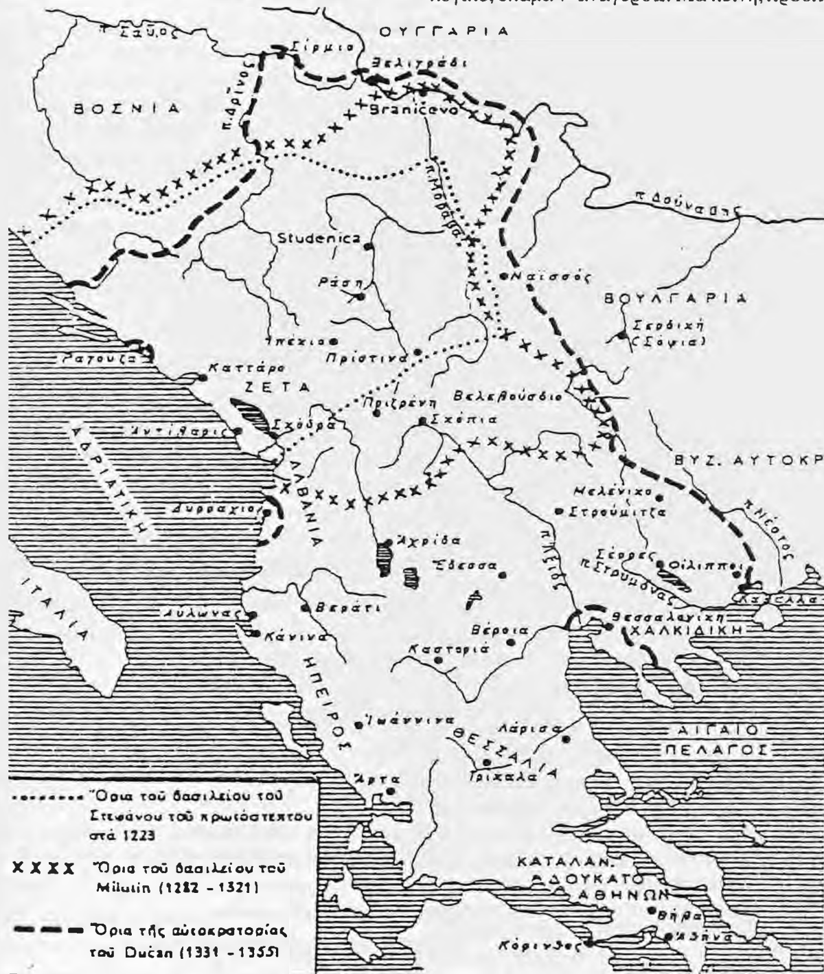
9. Το σερβικό κράτος των Νεμάνια (G. Ostrogorsky, Ιστορία του βυζαντινού κράτους , τόμ. Ι', σελ. 229).

Τότε εγώ, ταραγμένος και με σκοτισμένο το λογικό, έκαμα ν' αναγερθώ. Μα κείνη, προσπα-