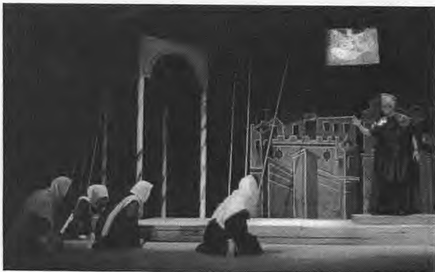
Μια χαρακτηριστική σκηνή από την Γ' πράξη του έργου "Κωνσταντίνος Παλαιολόγος"