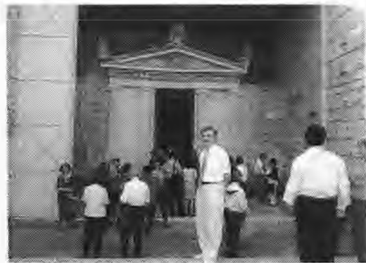
Από την επίσκεψη των συνεδριών στον Τάφο των Ανθεμίων στα Λευκάδια

Στο συνέδριο παρουσιάστηκαν και άλλες εισηγήσεις, όπως εκείνες που ασχολήθηκαν με την ζωγραφική και τις άλλες τέχνες στη Μακεδονία, τα ταφικά έθιμα των Μακεδόνων, τις πόλεις που ίδρυσε ο Αλέξανδρος στην Ανατολή και τις επιδράσεις του ελληνικού πνεύματος στις περιοχές αυτές. Δυστυχώς όμως δεν κατατέθηκαν στη γραμματεία του συνεδρίου τα κείμενα αυτών των εισηγήσεων