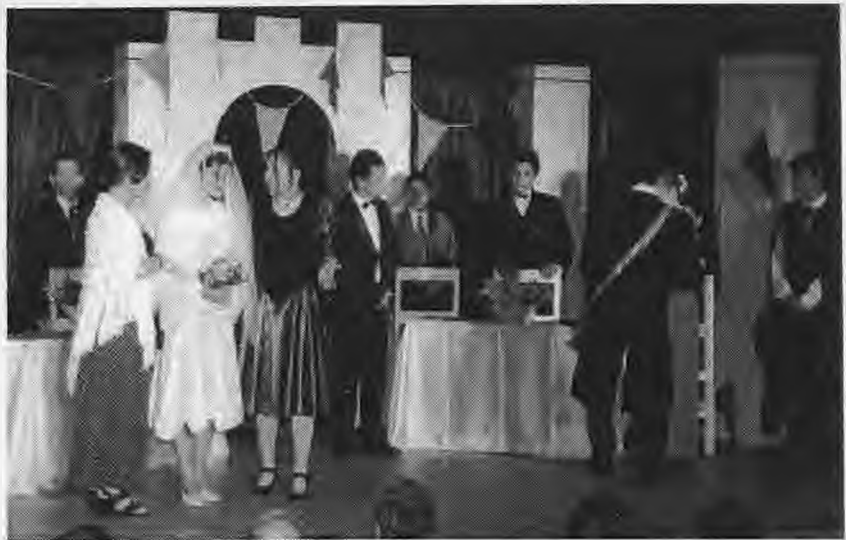
Μια χαρακτηριστική σκηνή από την Γ' πράξη του έργου "Ο Δράκος"

Όλοι εμείς λοιπόν που ξεκινήσαμε και θα συνεχίσουμε αυτή την προσπάθεια, δουλεύοντας συλλογικά, και με σεβασμό στα παιδιά και τις δυνατότητές τους, πιστεύουμε πως ανοίγουμε δρόμο και για άλλες τέτοιες προσπάθειες, που θα βρουν εκτίμηση και συμπάρασταση και που θα συμβάλουν σε ένα σχολείο δημιουργικό, ανοιχτό στην τοπική κοινωνία και τα προβλήματά της.