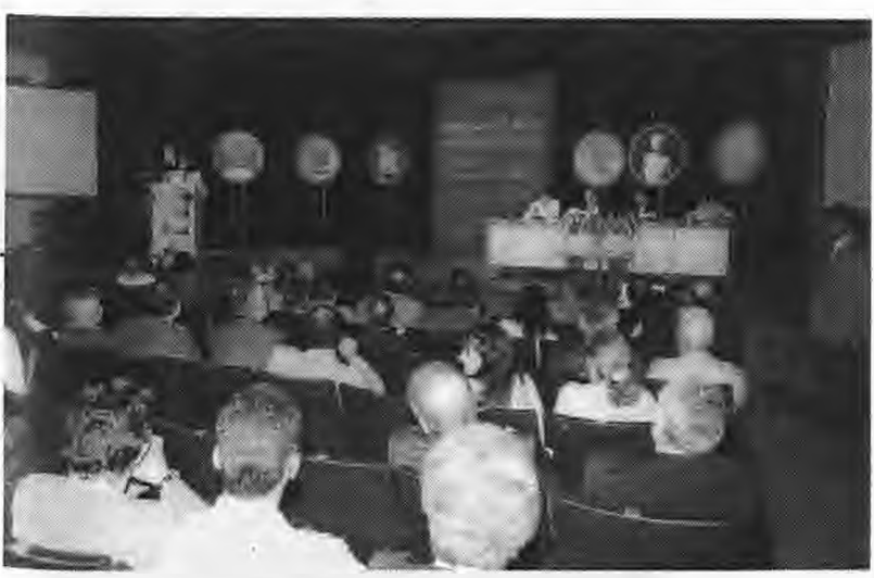
Γενική άποψη της αίθουσας όπου πραγματοποιήθηκε το συνέδριο. Στο βήμα ο Νομάρχης Ημαθίας κ. Βλαζάκης.

Ιδιαίτερα σ για τη θέση για την οπ προτείνει μ σήμερα. Με τις Παλαιστινι που σκάβο μεγάλη σημ