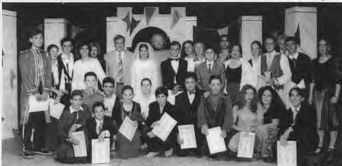
Αναμνηστική φωτογραφία με όλους τους συντελεστές της παράστασης του έργου του Ε. Σβάρτς "Ο Δράκος"

Εκ των πραγμάτων λοιπόν ωρίμασε η ανάγκη αναζήτησης μιας διαφορετικής εκφραστικής διεξόδου, και το σχολείο, -Γυμνάσιο και Λυκειακές τάξεις- δημιούργησε ένα Θεατρικό