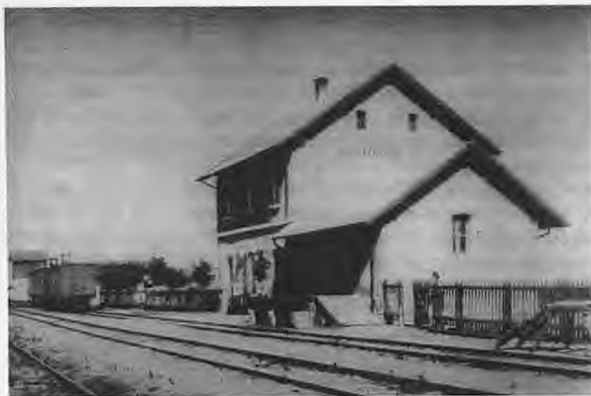
Ο Σιδηροδρομικός Σταθμός του Γιδά κατά τα τελευταία έτη της Τουρκοκρατίας.