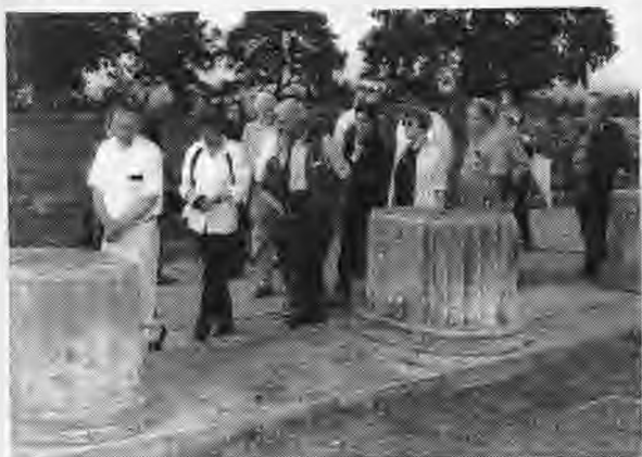
Από την επίσκεψη των συνέδρων στο ανάκτορο της Βεργίνας

Η ρωμαϊκή κατάκτηση το 168 π.Χ. δεν διέκοψε τις δραστηριότητες των μακεδονικών πόλεων, ιδιαίτερα στον παραγωγικό τομέα. Η ζωή ορισμένων απ' αυτές σταμάτησε μέσα στον 1ο αι. π.Χ. από φυσικά αίτια ή εχθρικές δηώσεις, ενώ άλλες συνέχισαν να υπάρχουν και να ακμάζουν και στα ρωμαϊκά και βυζαντινά χρόνια.