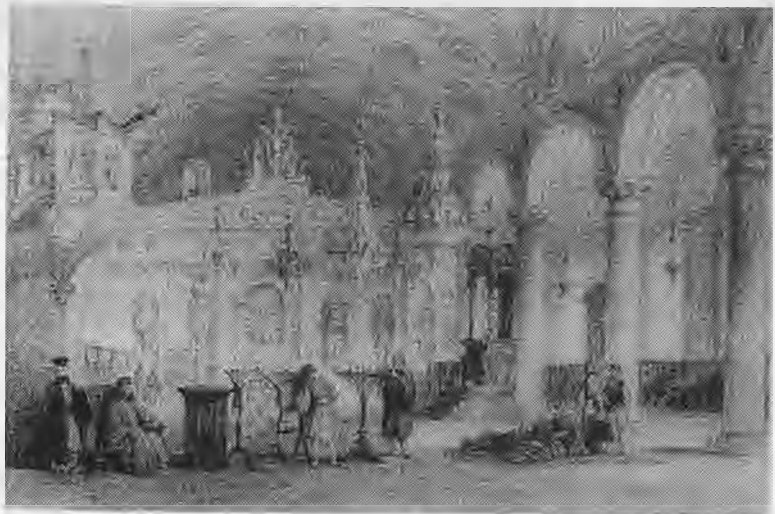
Ελληνική εκκλησία στο Μπαλουκλή. Στα υπόγεια της υπάρχει το αγίασμα με τα μισοτηγανισμένα ψάρια της γνωστής παράδοσης. Σιδηρογραφία του 1838

- Η Ρωμανία κι' αν πέρασεν, ανθεί και φέρεει κι' άλλο.