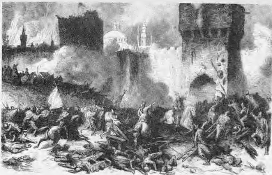
Η πολιορκία της Κωνσταντινουπόλεως από το Μωάμεθ Β΄ (Πορθητή) Ευλογραφία περίπου του 1870

Πρώτα - πρώτα ήταν πολύ σημαίνουσα πόλη, από ηθικής απόψεως, ως η μεγαλύτερη πόλη