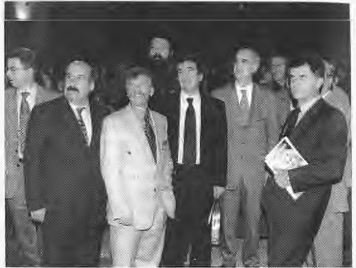
Οι επίσημοι που τίμησαν με την παρουσία τους την έναρξη του συνεδρίου.

Ο γάλλος καθηγητής της ιστορίας κ. Πιέρ Μπριάν χαιρέτησε την πολιτική ευφυΐα του Αλεξάνδρου, που εξασφάλισε τις στρατιωτικές του επιτυχίες. Κατά το γάλλο ιστορικό, ο Αλέξανδρος υλοποίησε αυτό που είχαν πάντα πρόθεση να κάνουν οι Αχαιμενίδες, αλλά δεν το κατάφεραν: Δηλαδή μια απέραντη αυτοκρατορία σ' όλο τον τότε γνωστό κόσμο. Το κατάφερε δε αυτός εντοπίζοντας εκ των προτέρων τις προϋποθέσεις λειτουργικότητας μιας τέτοιας αχανούς αυτοκρατορίας και στηριζόμενος στην οργάνωση του περσικού κράτους που