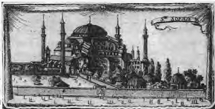
Παλιά γκραβούρα της Αγια Σοφιάς

Όλες οι διηγήσεις, οι παραδόσεις και το δ η μ ο τ ι κ ο τραγούδια του Ελληνικού λαού λειτουργούν μέχρι σήμερα στην λαϊκή συνείδηση σα ελπίδα πως τίποτ δεν χάθηκε «πάλι με χρόνια με καιρούς πάλι δική μας θάνατ». Γιατί όπως ο βασιλιάς Αλέξανδρος ζει και βασιλεύει, έτσι και ο τελευταίος αυτοκράτορας