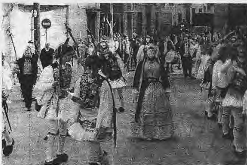
Μπουλούκι Γιαντισαρέων με τη Μπούλα στη μέση

Έτσι ο θάνατος γίνεται «μια δύναμη σχετική, που νικείται τελικά από τη ζωή... Το καρναβάλι δίνει σ' αυτό το φοβερό και ανεπανόρθωτο στα μάτια μας