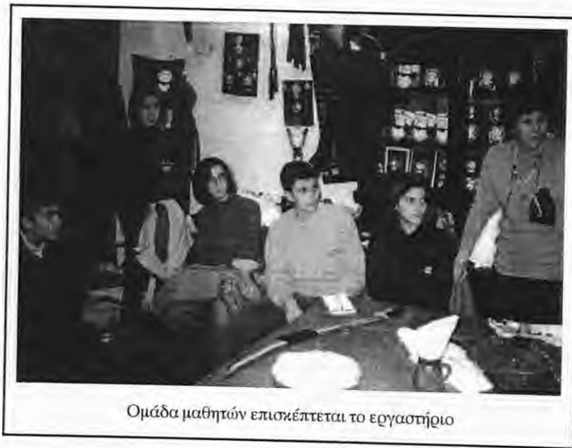
Ομάδα μαθητών επισκέπτεται το εργαστήριο

Τα υλικά και τα εξαρτήματα της στολής δεν είναι πολύ εύκολο να βρεθούν. Κατάλληλο ύφασμα για το