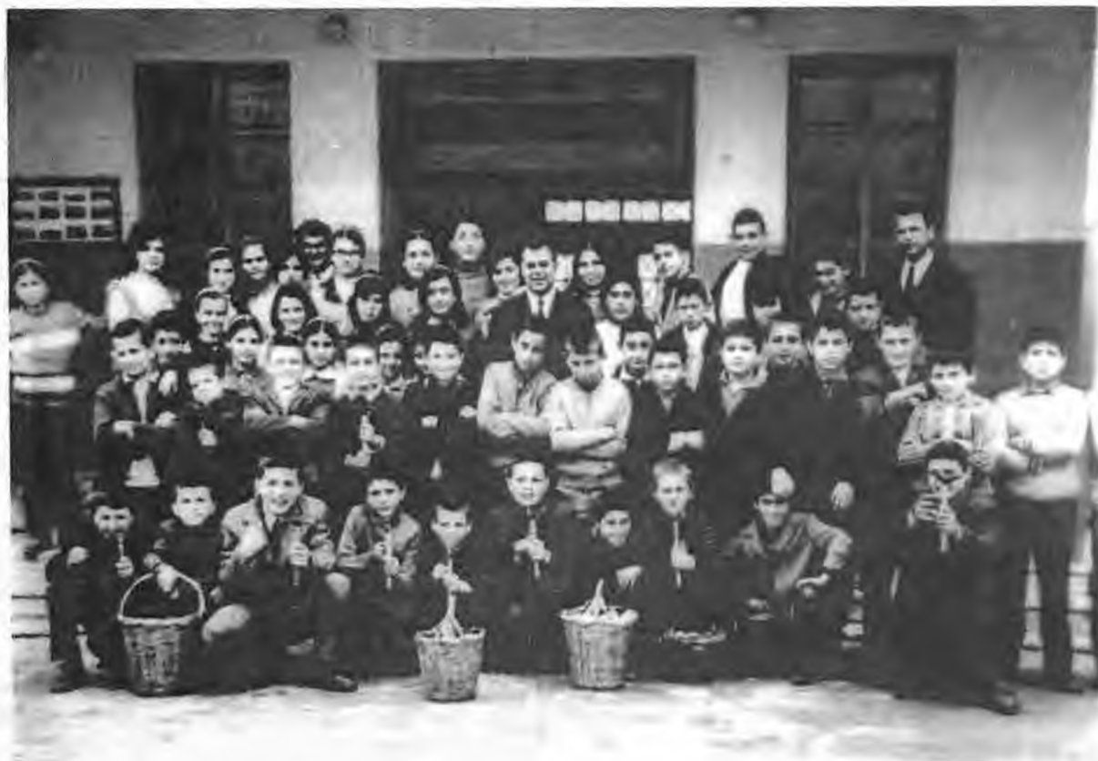
Αλεξάνδρεια 1η Μαρτίου 1971. Αναπαράσταση του εθίμου από το 2ο Δημοτικό σχολείο

Χελιδόνα έρχεται απ' τη Μαύρη Θάλασσα, θάλασσα επέρασε, την φωλιά την μέλησε, έκατσε και λάλησε, έμαθε τα γράμματα, γράμματα βασιλικά, που μαθαίνουν τα παιδιά, άνθρωπος αγράμματος, λύλο απελέκητο. Δάσκαλος μας έστειλε να μας δώστε πέντε αυγά, παίρνομε μια κλωσσαργιά, να γεννάει και να κλωσσάει και να σέρνει τα ποιλιά. Μάρτης μας ήρθε, κι άλλος μα ήρθε, τα λουλούδια ανθίζουν, ο τόπος μύριζει, τα πουλάκια κελαηδούν, τα αρνάδια μας γεννούν, έξω ψίλλοι και κοιροί και κακοί νοικοκυροί, μέσα γέλιο και χαρά και καλή νοικοκυριά, για να βάλ' τ'αρνί μες τον ταβά.