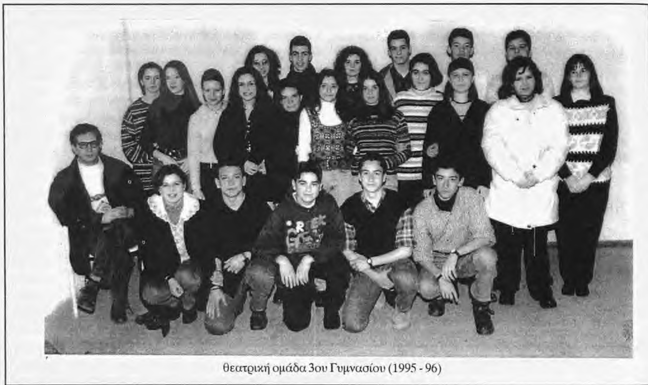
θεατρική ομάδα 3ου Γυμνασίου (1995 - 96)

Σχ. χρονιά 1993 - 94 : Δενδροκαλλιέργεια - αμπελοκαλλιέργεια στη Νάουσα .