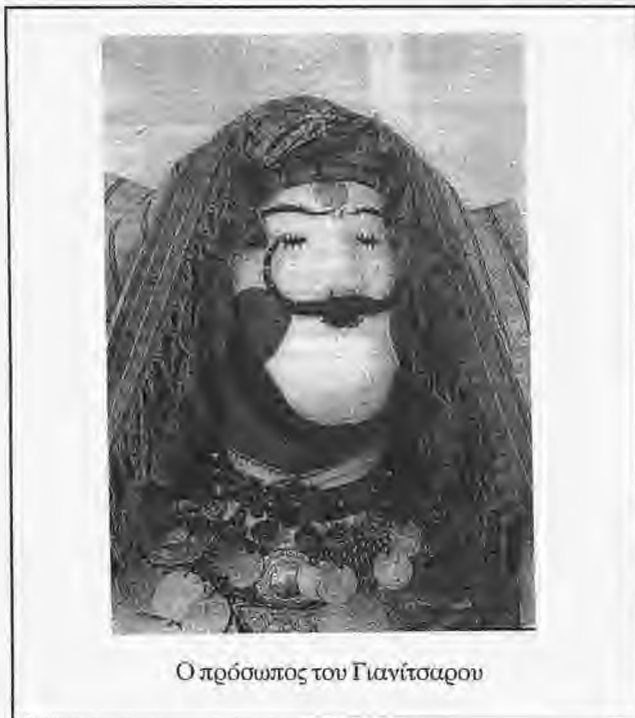
Ο πρόσωπος του Γιανίτσαρου

Οι προεαρινές αυτές τελετουργίες περιλαμβάνουν στο τυπικό τους πολλά κοινά στοιχεία, με ολοφάνερη μαγική προέλευση και σκοπιμότητα: μεταμφιέσεις με αντιπαράθεση ρόλων και μιμοδραματικές παραστάσεις, καθαρτήριες φωτιές, συμπόσια με γερά φαγοπότια και μεθύσια, οργιαστικούς χορούς, αισχρολογία, χρήση ομοιωμάτων των γονιμικών οργάνων, αναπαραστάσεις της γενετήσιας πράξης κτλ. , παράλληλα με νεκρολατρικές εκδηλώσεις και προσφορές. Εκείνο όμως που συνέχει όλες αυτές τις εκδηλώσεις και αποτελεί την πεμπτουσία της φιλοσοφίας τους είναι η ιδέα της ανατροπής της τάξης του κόσμου, η αμφισβήτηση των αξιών και της ιεραρχίας, η κατάργηση των ορίων και των καθιερωμένων νόμων. Είναι σαν η τροπή του χρόνου σε επίπεδο κοσμικό να συνεπιφέρει την ανατροπή του κόσμου σε επίπεδο κοινωνικό. Ένας άλλος νόμος, ο εφήμερος και αγέραστος νόμος του καρναβαλιού, επιβάλλεται, κάνει πέρα όποια άλλη επιταγή και τα ορίζει όλα από την αρχή: ανάποδα. Παραδίνοντας κάθε δικαιοδοσία για την τέλεση της γιορτής αυτής, με την αδυσιώπητη εθιμοτυπία της τρέλας, στο «λαό», στις κατώτερες τάξεις, στους περιθωριακούς, το αναποδογύρισμα έχει ήδη αρχίσει: θα ολοκληρωθεί μέσα από την απάτη των παραπλανητικών μεταμφιέσεων και τη διακωμώδηση μέσω των παρωδιών' και θα διατυμπανίσει την κρυμμένη αλήθεια μέσα από τον αποκαλυπτικό, τολμηρό λόγο των αποκριάτικων τραγουδιών.