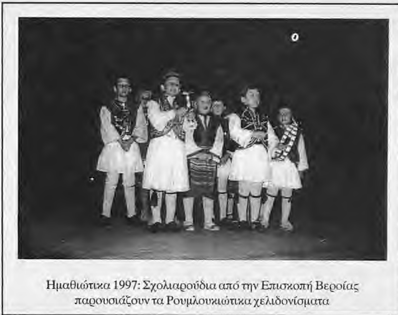
Ημαθιώτικα 1997: Σχολιαρούδια από την Επισκοπή Βεροίας παρουσιάζουν τα Ρουμλουκιώτικα χελιδονίσματα

Από την εποχή αυτή ακόμη είναι και η συνήθεια να τραγουδάνε τα μικρά παιδιά τραγούδια που αναφέρονται στο γυρισμό των χελιδονιών την Άνοιξη. Τα τραγούδια αυτά, που καθιερώθηκαν να ονομάζονται ως χελιδονίσματα, συναντιούνται μόνο στον Ελλαδικό χώρο. Μάλιστα όσοι τα τραγουδούσαν ονομάζονταν ήδη από την αρχαιότητα χελιδονισαί. Το πιο παλιό τέτοιο χελιδόνισμα αναφέρεται από