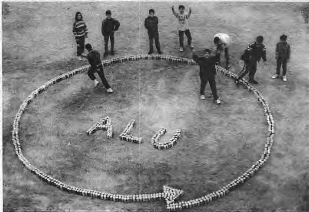
Τα παιδιά της περιβαλλοντικής ομάδας "επί τω έργω"

3. Στάδιο δραστηριοτήτων . Οι μαθητές χωρίζονται σε ομάδες εργασίας και συγκεντρώνουν στοιχεία .