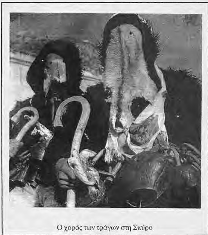
Ο χορός των τράγων στη Σκύρο

που τελούνται αυτήν κυρίως την εποχή του έτους, για να πανηγυρίσουν προεξαγγελτικά, μ' ένα ξέφρενο ξέσπασμα, την ετήσια αναγέννηση του κόσμου μέσα