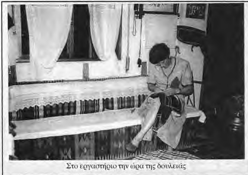
Στο εργαστήριο την ώρα της δουλειάς

Αρχικά ας δούμε το χώρο του εργαστηρίου που θα μπορούσαμε να τον παρομοιάσουμε μ' ένα μικρό λαογραφικό μουσείο. Καναπέδες με προσκέφαλα γύρω, αντί για καρέκλες και πολυθρόνες, ο σοφράς και η κούνια για το μωρό στη μια γωνιά, κομμάτια από αυθεντικές στολές και παλιές φωτογραφίες στους τοίχους, ένα πάγκος για την κατασκευή του «πρόσωπου», η ραπτομηχανή και στο κέντρο ένα μεγάλο τραπέζι, όπου γίνονται οι περισσότερες εργασίες. Όλα συνθέτουν ένα περιβάλλον πολύ φιλικό και φιλόξενο.