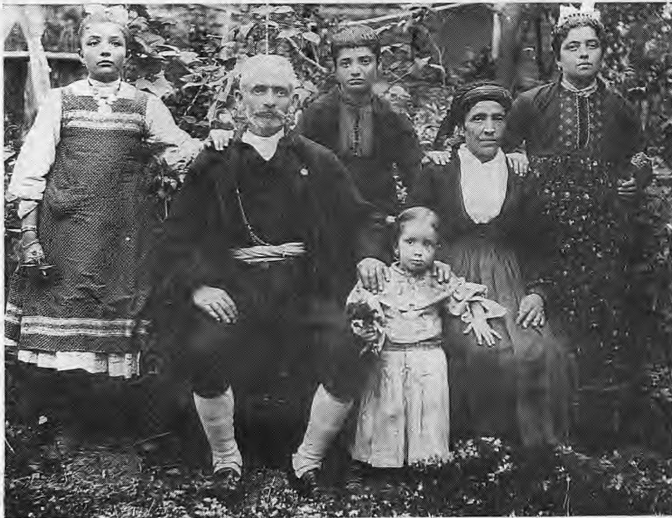
Ναουσαϊκή οικογένεια την πρώτη δεκαετία του αιώνα μας