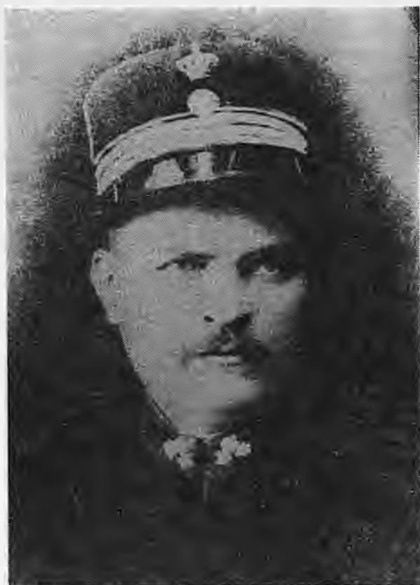
Ο λοχαγός Μιχαήλ Μωραΐτης (Καπετάν Κόδρος)

Πιθανόν στην ψυχολογική αυτή κατάσταση οφείλονται και οι άδικες πολλές φορές κρίσεις του για τους ρομανίζοντες του Βερμίου και για τους «λεοντόζωονες» τσορμπιτζήδες της Νάουσας, που όπως θα δούμε σε επόμενες επιστολές, είναι κανστικός αν όχι υπερβολικός, αν και ομολογούμενος, πολλές φορές το ομολογεί και ο ίδιος, στήριξαν ηθικά και υλικά τον αγώνα.