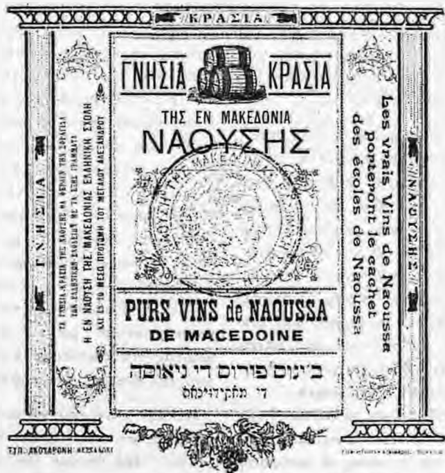
Πιστοποιητικό γνησιότητας των κρασιών της Νάουσας

σα. Το ξυνόμανρο Ναούσης τον πρώτο χρόνο δεν σερβίρεται αν δεν γίνει ανάμιξη με ένα άλλο σταφύλι σε αναλογία 25%. Το δεύτερο χρόνο βγάζει το άρωμα και τη γεύση του και είναι ευχάριστο ποτό και όταν πρόκειται να κάνεις τραπέζι 2 ώρες νωρίτερα να το θάλεις σε κανάτες για να πάρει θερμοκρασία του περιβάλλοντος και αυτό το ξέρω από τον παππού μου τον Γιώργου Δαλαμάρι. Γέρος στα 88 του χρόνια καθόταν σ' ένα δωμάτιο, είχε και το τζάκι με την φωτιά, εγώ μικρό παιδί πάντα πήγαινα και τον έκανα δουλειές και όταν έτρωγε πάντα τον έβλεπα να έχει το ποτήρι με το κρασί κοντά στη φωτιά και μου έλεγε αν το κρασί δεν ζεσταθεί λίγο δεν βγάζει το άρωμα, κρύο πολύ το μαύρο κρασί δεν πίνεται και πάνω σ' αυτό θέλω να πιστεύω και εγώ πως η πείρα και ο χρόνος και η πράξη διδάσκουν πολλά πράγματα.