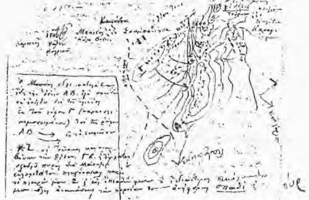
Η μάχη της Σουμπανίτσας (σχεδιάγραμμα)

Η διεξαγωγή και η ανάπτυξη της μάχης που περιγράφεται λεπτομερώς από τον Καπετάν Ακριτά στην παραπάνω επιστολή αποτυπώνεται στο παρακάτω σχεδιάγραμμα θέσεων και εδάφους που υπάρχει εντός του κειμένου της επιστολής. ► Συνεχίζεται