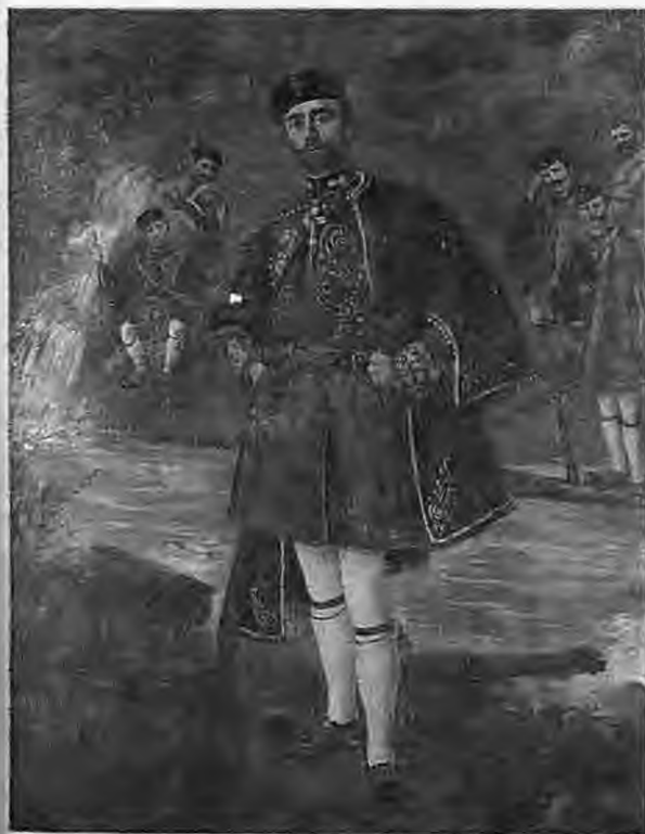
Κωνσταντίνος Μαζαράκης (Καπετάν Ακρίτας)

Τελικά την 27 Απριλίου, μετά τις γνωστές ταιλαιπωρίες, αποδιώχθηκαν τα δυο σώματα στις εκβολές του Αλιάκμονα και αμέσως δια της Πόλιανης, σήμερα Σφενδάμι Πιερίας, δια της Μονής Μακρυράχης, όπου τους υποδέχεται ο Ηγούμενος Αμβρόσιος, της Σπουρλίτας, σήμερα Ελαφίνα Ημαθίας, φθάνουν στο διαβατό σημείο του ποταμού. Η διάβασις υπήρξε μεν εύκολη, διότι έλλειπαν οι Τούρκοι φρουροί, αλλά συνάμα υπήρξε και επικίνδυνη. Διότι στη γύρω περιοχή απασχολούνται ως υλοτόμοι, ανθρακείς, μυλωθροί κλπ. πολλοί σχισματικοί προερχόμενοι από την περιοχή Βιτωλίων και υπήρχε πιθανότητα να κα-