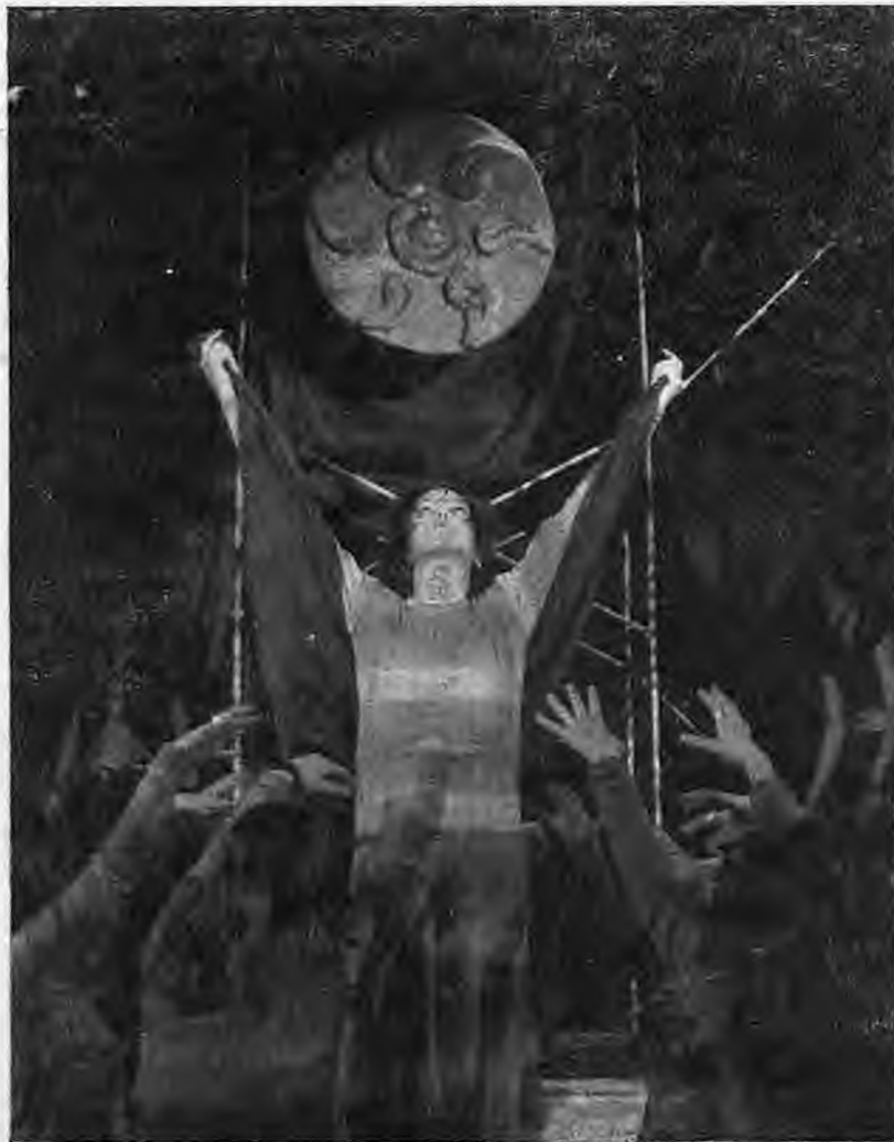
Από την παράσταση της τραγωδίας

Ο Ετεοκλής λοιπόν κρατάει το θρόνο, διώχνει τον Πολυνείκη, αυτός καταφεύγει στο Άργος και παντρεύεται την κόρη του βασιλιά και με το στρατό των Αργείων μετά γυρνά στη Θήβα να διεκδικήσει το δικίό του.