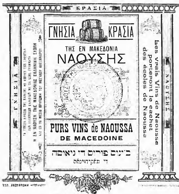
Πιστοποιητικό γνησιότητας των κρασιών της Νάουσας

Αφιέρωμα στην αμπελουργία και στα κρασιά της Νάουσας