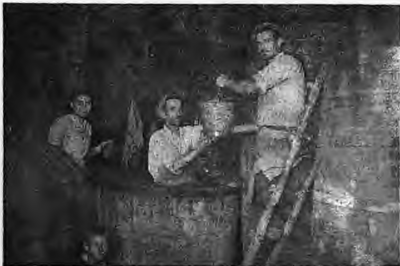
Το πότημα των σταφυλιών

Θυμάμαι σαν νάταν χθες τον πατέρα μου να ζεματάει με νερό και σόδα τα βαρέλια, τις έτοιμες να κυληθούν ετικέτες για τον τόπο προορισμού και τους εμπόρους που το αγόραζαν να μετράνε τις λίρες που θα έδιναν.