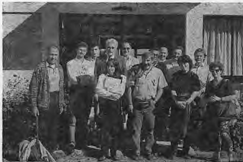
Η ερευνητική ομάδα που συμμετείχε στη Διεθνή επιστημονική συνάντηση, για τη χλώρωση σιδήρου

Θεραπεία της χλώρωσης σιδήρου στα οπωροφόρα γίνεται συνήθως με εφαρμογές οργανικών ενώσεων σιδήρου στο έδαφος. Πολύ συχνά οι εφαρμογές των ενώσεων αυτών επαναλαμβάνονται κάθε χρόνο στα ίδια δένδρα, διότι ο σίδηρος που προστέθηκε στο έδαφος ακινητοποιείται γρήγορα. Το κόστος της θεραπείας της χλώρωσης σιδήρου είναι πολύ υψηλό, ανέρχεται στο 60% του ολικού κόστους της λίπανσης για μερικές από τις παραγωγές που αναφέραμε παραπάνω.