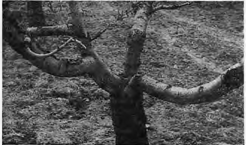
Εικ. 1. Το νέο ανεπτυγμένο εμβόλιο από κοιμόμενο οφθαλμό κόπηκε το Μάιο στο ύψος γονάτου. Αναπτύχθηκαν τρεις βραχιόνες από ταχυφυείς το ίδιο καλοκαίρι που κόπηκαν σε πλάγιο ταχυφυή 2ας τάξεως την άνοιξη του δεύτερου χρόνου για να ανοίξει η γωνία.

Από το 2ο μέχρι τον 5ο χρόνο οι βραχιόνες διχάζονται, αφήνονται και καρποφόρες ποδιές, έτσι