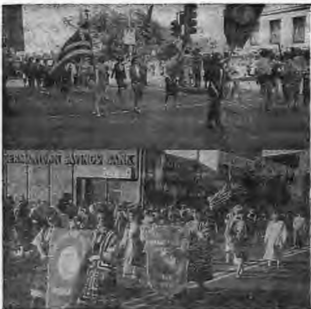
Παρέλαση της Ελληνικής Παρακίας στην εθνική γιορτή της 25ης Μαρτίου. — Η νεολαία του συλλόγου «Παύλος Μελάς» παρελαύνει στη Φιλαδέλφειο.