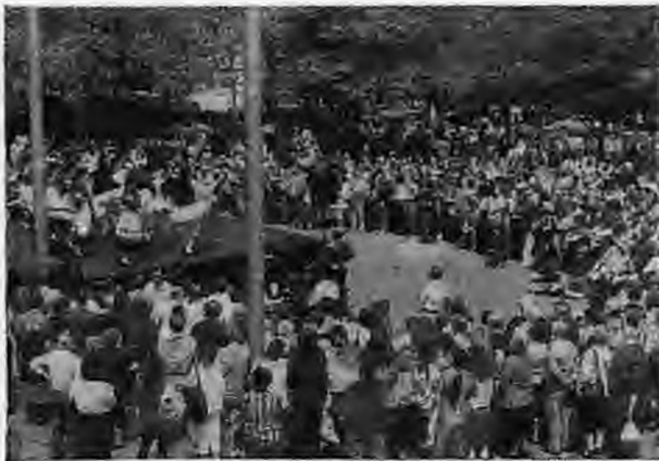
Με διοργανωτή την Παμμακεδονική Ένωση Αυστραλίας οι εκδηλώσεις των «Δημητρίων» σημειώνουν κάθε χρόνο τεράστια επιτυχία (η φωτογραφία από τη Μελβούρνη)

Μίλησα προηγουμένως για την εργατικότητα που διακρίνει τον Έλληνα της διασποράς και τις υψηλές θέσεις που κατέχει στην Αμερικανική και Αυστραλιανή Κοινωνία. Πραγματικά οι Έλληνες κατάφεραν εκεί να έχουν πολιτικές διασυνδέσεις με το Κογκρέσσο, τη Γερουσία και τον Λευκό Οίκο και να βοηθούν την Ελλάδα κατά τρόπο ανύποπτα σπουδαίο. Στον οικονομικό τομέα κατέχουν επίσης αξιοζήλευτη θέση. Αλλά και στον επιστημονικό και στον κοινωνικό. Βλέποντας ότι αυτή τη στιγμή διδάσκουν στα αμερικανικά Πανεπιστήμια πάνω από 2.500 Έλληνες, ότι έχουμε αρκετούς ομοσπονδιακούς βουλευτές, πρυτάνεις, δημάρχους ελληνι-