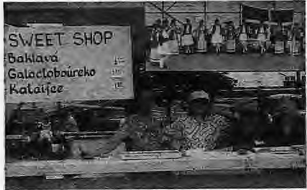
-Ελληνική Εβδομάδα- στη Φιλαδέλφειο με ποικίλα εκδηλώσεων που θυμίζουν μόνον Ελλάδα...

Κοινή παραμένει η διαπίστωση ότι ο Έλληνας όπου κι αν θέτει την προσωπική του σφραγίδα μεγαλουργεί. Η εργατικότητα και η υψηλή κοινωνική θέση που κατέχει ανάμεσα στον Αμερικάνο, στον Αυστραλό, είναι τα κύρια στοιχεία που τον χαρακτηρίζουν. Το ελληνικό λόμπυ στις Η.Π.Α. και ο εθνικός ξεσηκωμός του Έλληνα στην Αυστραλία το απέδειξαν περίτρανα αυτό τον καιρό που δοκιμάζεται η Μακεδονία μας. Και δεν απέχει στο ελάχιστο από την πραγματικότητα αν σχυρι-