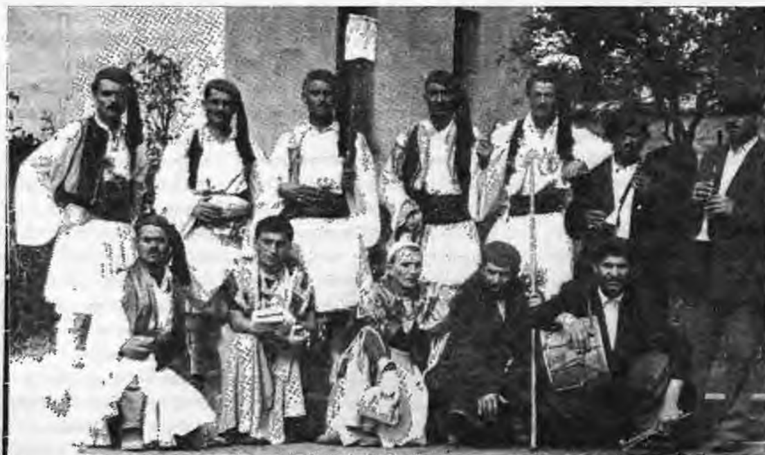
Γενίτσαραιοί και Μπούλες των Λεχαινών στο καρναβάλι του 1954. Η στολή των «Γενίτσαριών» θυμίζει το ντύσιμο των παλικαριών στην επανάσταση του 1821

Ο Καθηγητής Θωμάς Γαβριηλίδης με δυο άρθρα του στη «Νιάουσα» (τεύχη 70 και 71, «Γιανίτσαρος και Μπούλα»), διατυπώνει άλλη θεωρία, καταφεύγοντας στην «ιστορία των ονομάτων».