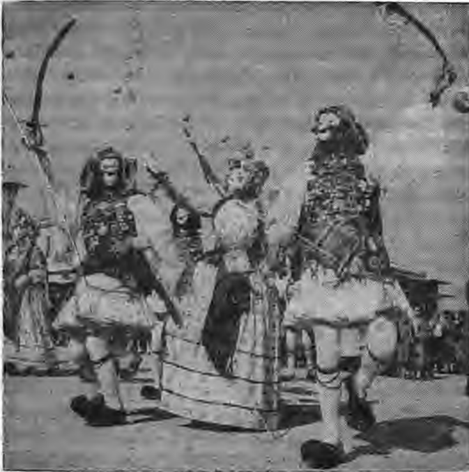
Ναουσαία Μπούλα ανάμεσα σε δύο Γενίτσαρους. Ο «πρόσωπος» και ο «θώρακας» με τα κέρματα τονίζουν τις αρχαίες ρίζες. (Φωτογραφία της «Φωνής» από τις αποκριές του 1958)

Γράφει Γιαννίτσαρος, με «ψήμιλον» για να υποστηρίξει ότι προέρχεται κατευθείαν από τον Διόνυσο (Διόνυσος - Γιάνουσος - Γιαννίτσαρος), ενώ για τις Μπούλες πιθανολογεί την προέλευσή τους από τις αρχαίες Βαθύλες, που οι Ρωμαίοι πρόφεραν «Μπιαμπούλες» και εμείς τις κάναμε «Μπούλες».