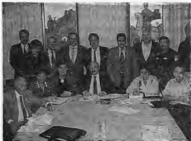
Το σημερινό Ύψατο Συμβούλιο της Παμμακεδονικής Ένωσης ΗΠΑ — Καναδό (Νέα Υόρκη)