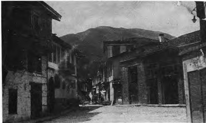
-Τα Καμμένα-. Αριστερά το βιβλιοπωλείο Μαρνέρη