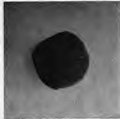
Φουτ. 3. Απούμα απού μπουρμπόκια ραμένα

Τότι μη του τίπουτας επιζάμι. Του χειμώνα όντας έβριχεν ή χιό-νιζειν ξιαπλουνάμι τις καρέκλεις σ' ανώγι, (όλα τα σπήτια είχαν