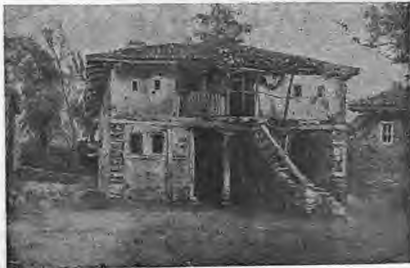
Το σπίτι που δολοφονήθηκε ο Πάυλος Μελάς

Αυτές σήκωσαν τον νεκρό του αρχηγού και τον θάψανε πρόχειρα στο εξωκκλήσι του Προφήτη Ηλία. Στο γυρισμό σκορπίστηκαν για ν' αποφύγουν το τουρκικό απόσπασμα που με φοβέρες και δαρμούς ζητούσε να μάθει που είχαν πάει οι αντάρτες. Αλλά και αυτοί έγιναν άφαντοι. Χωρισμένο το σώμα σε μικρές ομάδες είχε διασκορπιστεί, ενώ τα σώματα των άλλων που δεν βρίσκονταν στη Στάτιστα εξακολούθησαν να ενεργούν μεμονομένα. Έ-