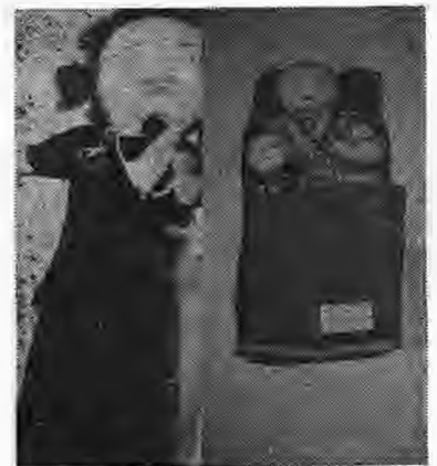
Φωτ. 1. Κούκλεις από χαμπουχάλια Μάνο μη του πιδί της κί γαμπρός

Τότι τα μικρά έπιζαν κί μι τα χαμπουχάλια μικρά κουμάτια από λουγίσιμα υφάσματα, σιαζάκια, λινά, τσίτχια κί άλλα. Κί όσου τράνησαν ουλίγου ακόμα