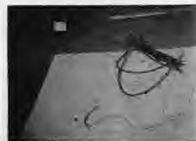
Φουτ. 4. Άλουγου μη κοπίστρι κί νου-ρά απού θέργεις

Γένητι μη τρεις θέργεις χουν-τρούτσικεις κί γιρές μνιά ίσια τρι-νή κί μακριά για ισουρουπία κί-ντιγίό λυγισμένεις κί διμένεις, α-νοιχτές στη μακριά τη θέργαι. Α-πού πάνου εκεί που αρτιρνούν οι-θέργεις δένουντι άλλες έξι ιφτ