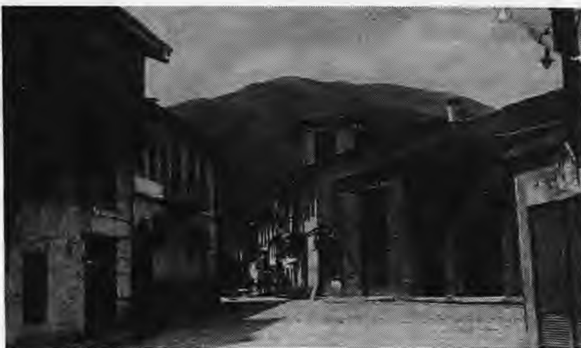
«Το Καμμένα». Αριστερά το βιβλιοπωλείο Μαρνέρη

Ήταν μια πνευματική βάση στον περιορισμένο ορίζοντα της εποχής ανεξάρτητα και αν δεν αγοράζοταν το βιβλίο, η εφημερίδα και το