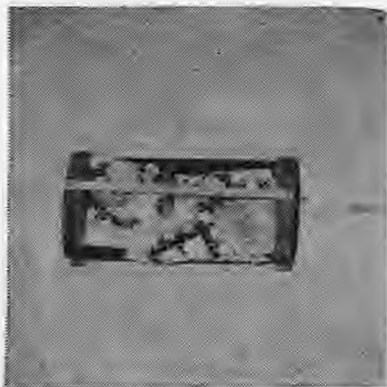
Φουτ. 2. Κούνια μικρή ξυλένια

Τα μικρά τ' άφκίαναν κί κού-νεις μικρές ξυλένεις όπους ήταν οι κανονικιές (φουτ. 2) που μας κουνούσαν οι μάνεις μας τα πα-ληά τα χρόνια. Γένουνταν μη σα-νίντγια, ντιγίό φαρδιά πλαϊνά κί ένα στουν πάτου. Τα πλαϊνά άνοι-γαν σιαπάνου ίσια με 50-60 πόν-τους κί κάτω στένηθαν στους 30. Τα σανίντγια αυτά καρφώνουνταν απ' τις άκρεις για να γένει σα σιντούκι σί ντιγίό χουντρίθηρα ξύ-λα, απού κάτω καμπυλουτά, για να κουνιέτι η κούνια, κί απού πά-νου καρφώνουνταν ένα καθρόνι