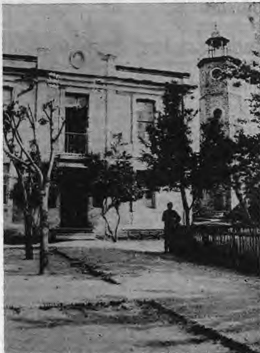
Το «Ρολόγι» δίπλα στο Κονάκι. Διακρίνεται Τούρκος σκοπός