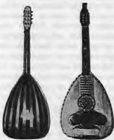
Λαγούτα προπολεμικά Συλλογή Μουσικού Μουσείου Σ.Ι. Κοφαχείλη

Ο ταμπούρας ήταν το μουσικό όργανο των κλεφτών και αρματολών που ζούσαν επάνω στο Βέρμιο και τα Πιέρια. Ο ταμπούρας προέρχεται από την βυζαντινή πανδουρίδα κι αυτή με την σειρά της από το αρχαίο τρίχορδο των Ελλήνων. Οι δοξοί των τόνων είναι κινητοί και κουρδίζονται στους βυζαντινούς φθόγγους Δη, Γα, Πα, που αντιστοιχούν στα σολ, φά, ρε της Ευρωπαϊκής σημειογραφίας. Από ξύλο δάφνης φτιάχνεται ο καλός ταμπούρας. Ο ταμπούρας παίζθηκε πολύ στην Μακεδονία πριν εμφανιστεί το λαούτο, παίζθηκε στον Ό-