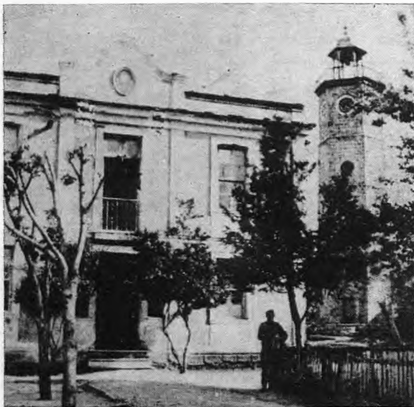
Το «Ρολόγι» δίπλα στο Κονάκι