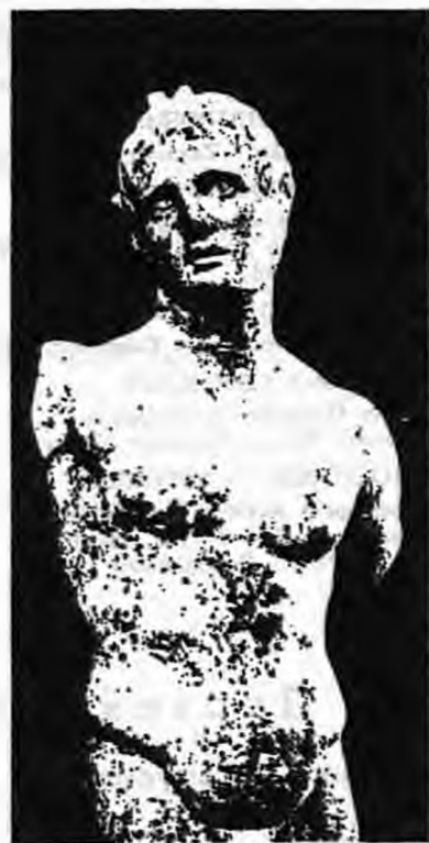
Μαρμόρινο αγαλμάτιο Αλεξάνδρου - Πανός από την Πέλλα. Χαρακτηριστικά Αλεξάνδρου στο πρόσωπο, κέρατα Πανός στο κεφάλι. Ελληνιστικής εποχής. Ύψος 0.375μ. Αρχαιολογικό Μουσείο Πέλλας αρ. ΓΑ 43

Από τις παραπάνω μαρτυρίες του Πανός μαθαίνουμε ότι στη Βέροια λατρευόταν εκτός από την Αφροδίτη και ο γιός της ο Πόθος. Από άλλες πηγές μπορούμε να συμπεράνουμε ότι στη Βέροια λατρευόταν και τα δύο άλλα παι-