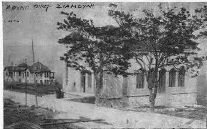
Δημοτικό Θέατρο Νάουσας -Τιτάνια- (1931)