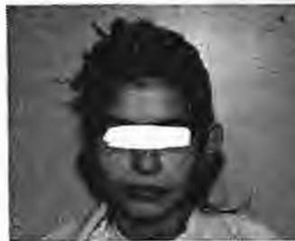
Πριν την εγχείρηση

επίμειναι κανείς δεν υπάρχει κανείς περιορισμός. Τα παιδιά της προσχολικής ή της πρώτης σχολικής ηλικίας είναι η κατάλληλότερη ηλικία με την προϋπόθεση να έχουν καταλάβει τη χρησιμότητα της επέμβασης και να είναι ικανά να συνεργαστούν. Στην ηλικία αυτή τα πειράγματα των συμπεριβατών τραβούν την προσοχή του παιδιού σ' αυτά του, διεγείροντας ταυτόχρονα τον ψυχισμό του και το κάνουν να συ-