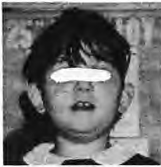
Πριν την εγχείρηση