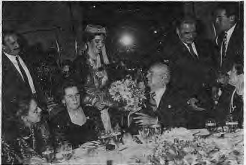
Ο Πρόεδρος της Δημοκρατίας κ. Κωνσταντίνος Καραμανλής. Η χορεύτρια Ναυτικού Ναούσης της Α.Ε.Ν. προσφέρει την ανθοδέσμη στον Πρόεδρο της Δημοκρατίας.

Μετά την ομιλία του κ. Μάρτη, επηύθυνε χαιρετισμό η πρόεδρος του Λυκείου Ναούσης κυρία Καίτη Τσίτση η οποία με τα ωραία λόγια της και το στόμφο στη φωνή της έκανε ξεχωριστή εντύπωση. Το Λύκειο Ναούσης χόρευε στην αρχή τον παραδοσιακό χορό με τους Γε-