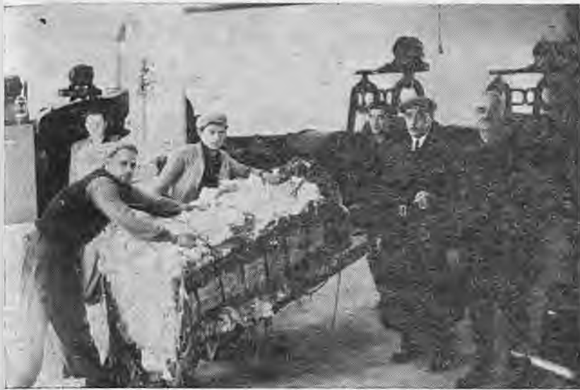
Επαναλειτουργία εργοστασίων με το Σχέδιο Μάρσαλ

ποίηση των οχθών της Αράπιτσας, γ) η οδική σύνδεση της Νάουσας με τη Δυτική Μακεδονία, δ) η ανέγερση ξενοδοχείου στην είσοδο της πόλεως, ε) η ένωση του Κιοσκίου με το Νοσοκομείο και τόσα άλλα.