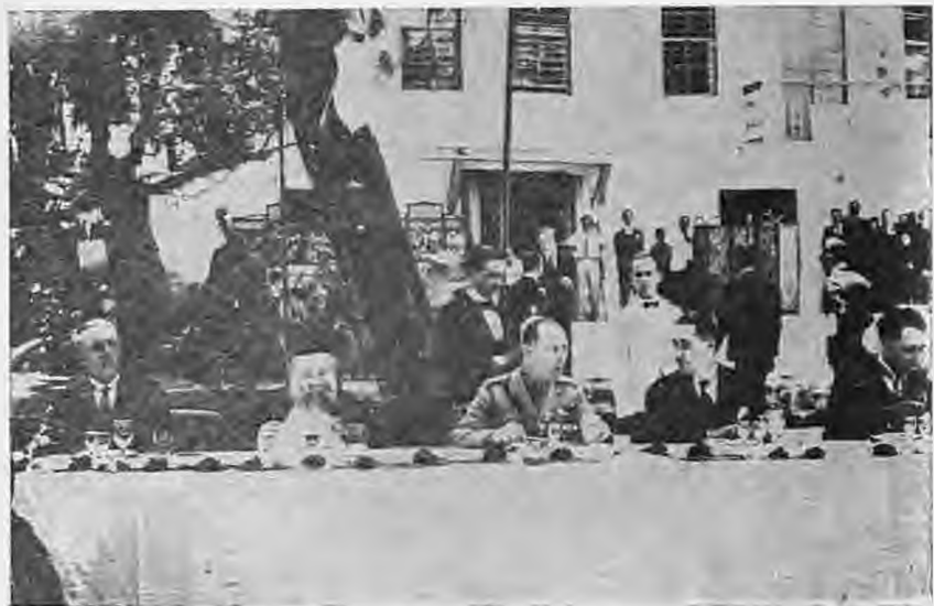
Έτος 1934. Γεύμα με τον Βασιλιά Γεώργιο Β' στο Κιόσκι

μους και πλατείες, γενόμενος πολλές φορές κακός με τους οικοπεδούχους. Αντίσταξη βρίσκει επίσης από τους τότε πλούσιους, οι οποίοι με Βασιλικό διάταγμα, απαγορεύουν την τακτοποίηση των σπιτιών και οικοπέδων τους σύμφωνα με το «σχέ-