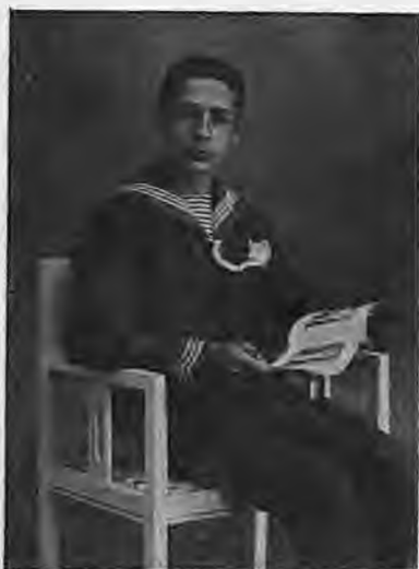
Μαθητής στο Γυμνάσιο Βέροιας

Λίγοι άνθρωποι στη ζωή τους είχαν την θέληση να θυσιάσουν τις προσωπικές τους απολαύσεις, τα πλούτη τους και αυτή ακόμα την οικογένεια, για χάρη των συμφερόντων του τόπου τους.