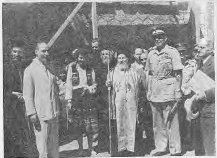
'Ετος 1951. Εγκαίνια επαναλειτουργίας του Δημοτικού Σχολείου Αγίου Μηνά από τον βασιλιά Παύλο

Σε μένα έλαχε το θλιβερό καθήκον να σ' αποχαιρετήσω εκ μέρους της μεγάλης και μοναδικής αγαπημένης σου της Νάουσας. Τη συγκίνηση, μας μεγαλώνει το γεγονός ότι αποχαιρετούμε τον άνθρωπο που σημάδεψε τη ζωή της Νάουσας μισό αιώνα περίπου. Με το θάνατό σου κλείνει μια ολόκληρη εποχή. Ήσουν ο τελευταίος Έλληνας δήμαρχος που οι άνθρωποι σηκώνονταν στο πέρασμά του. Ο τελευταίος εκπρόσωπος ενός παλιού κόσμου, δεν ξέρω καλύτερου ή χειρότερου, χά-