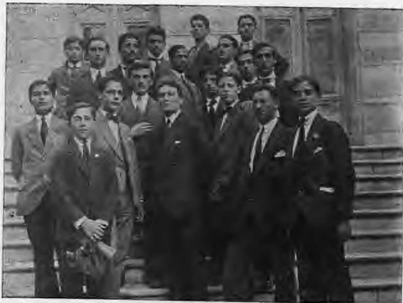
Φοιτητής στη Σχολή Νούκα Θεσσαλονίκης. Σειρά πρώτη. Από αριστερά 3ος

Υπηρέτησε στο στρατό, στο οικονομικό σώμα της Ελληνικής παροικίας της Αιγύπτου με το βαθμό του υποδεκανέα, αρνούμενος αξιώματα και θέλοντας να περάσει απαρατήρητος. Το 1927 ίδρυσε μεγάλο γραφείο διακινήσεως εμπορευμάτων