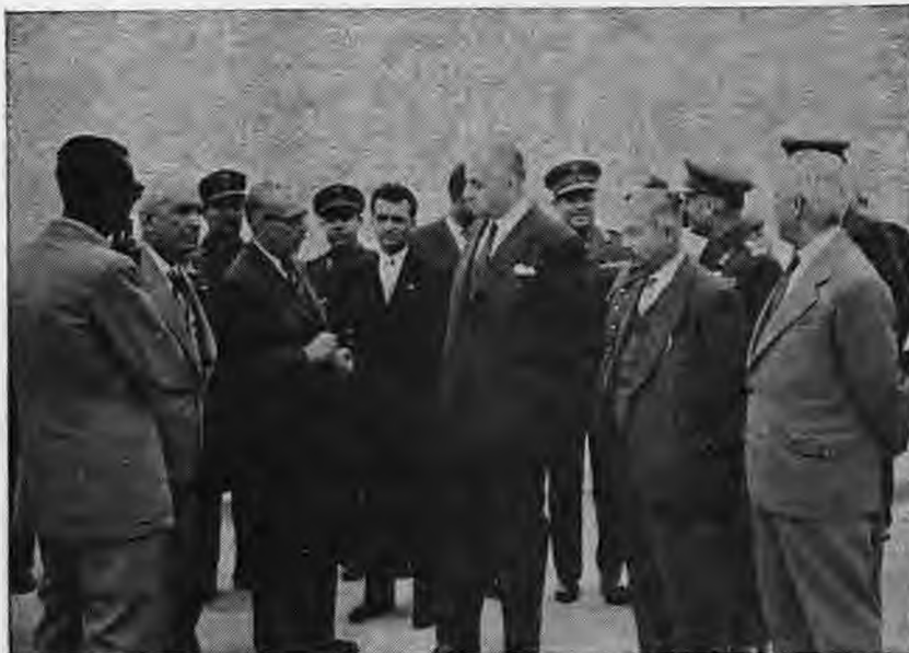
Έτος 1963. Α Φιλώτας συνομιλεί με τον υπουργό παιδείας Γρ. Κασσιμάτη μετά την θεμελίωση των Τεχνικών Σχολών

Υπάρχει ένα όπλο πιο φοβερό και από την τυχοφαντία είναι: η ΑΛΗΘΕΙΑ.