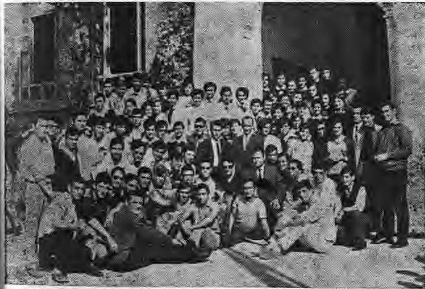
Οι απόφοιτοι το 1968

Στην εκδήλωσή μας έχουμε και έναν μικρό που εκπροσωπεί τη μαμά του, η οποία βρίσκεται στην Α-