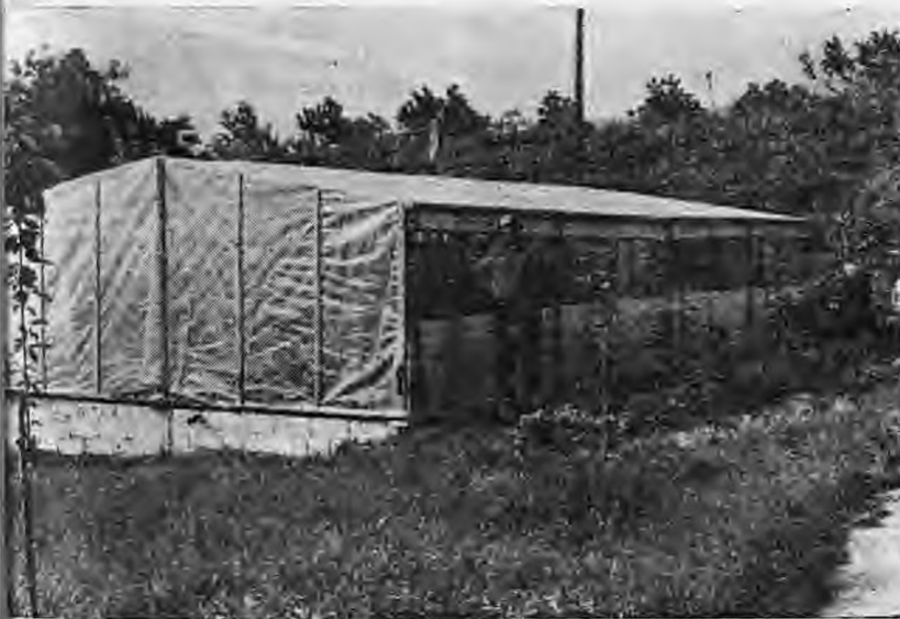
Θερμοκήπιο καλλιέργειας λαχανικών. Η καταπολέμηση των εχθρών πραγματοποιείται με βιολογική καταπολέμηση

Η ολοκληρωμένη λοιπόν μέθοδος καταπολέμησης, είναι μία μέθοδος, που επιδιώκει την μικρότερη δυνατή επιζήμια διατάραξη του οικοσυστήματος, ώστε να διατηρηθούν οι μη-