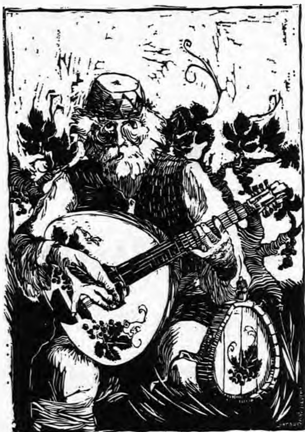
Πίνακας Γ. Μπαδόλα

Η συμβίωση των Ελλήνων και των Σέρβων στο Σεμλίνο κατά τον 18ον αιώνα