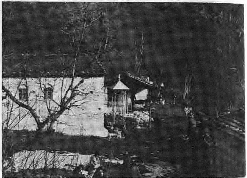
ΔΑΠΑΝΗ ΙΩΑΝΝΟΥ Μ. ΜΠΟΥΤΑΡΗ 1928