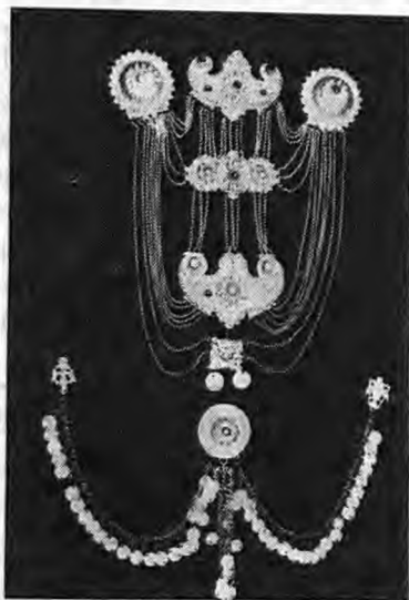
ΚΙΟΥΣΤΕΚΙ ΚΑΙ ΤΟΚΑΣ ΜΕ ΨΙΑΑ

Αυτὰ φοριόuταν σέ φουστανελεs κίςφραματιωλῶn και σήμερα τῶn Γιαννιτάρων. Μερικέz φορέz λινά επιχρυσωμένα. Αυτὰ και τόσα άλλα άσήμια στολιζουn και άρματώουn τὸ γιαννίσαρο δεμένο γερά σέ λουριά και σελιάχι.