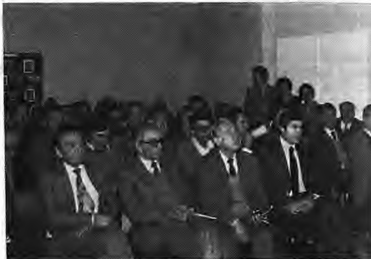
Άπό τó Σεμινάριο τών Γεωπόνων

ί ποικιλίες μηλιάς Στάρσιας και Γκόλντεν Ντε-ίσκονται στο άναφερόμε-