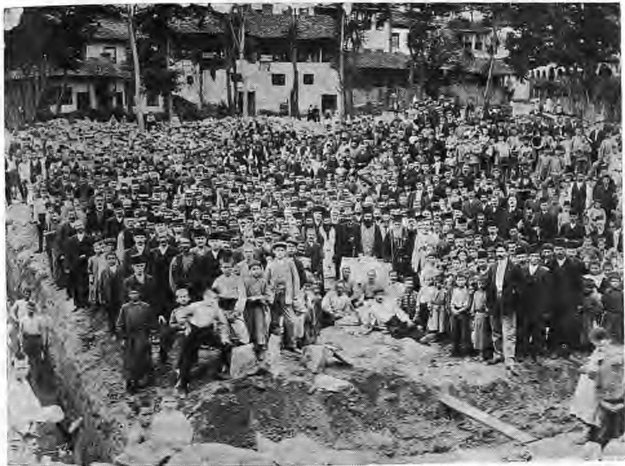
Θεμελίωση του σχολείου του Ἁγίου Μηνά (1911)