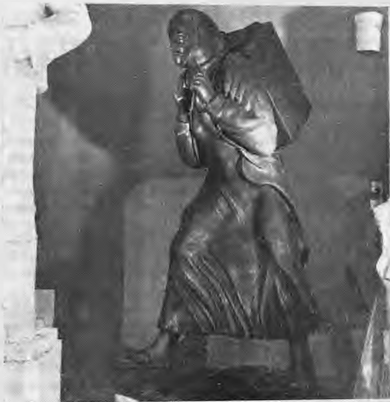
Η Γυναίκα της Πίνδου — Πεντάλοφος επαριάς Βοίου Κοζάνης

Το μυαλό και η ψυχή του ήταν αφιερωμένα στην υπηρεσία της