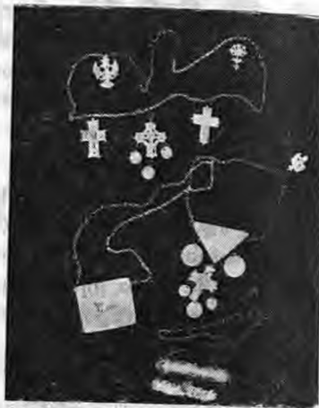
ΣΤΑΥΡΟΙ ΚΑΙ ΧΑΪ-ΜΑΛΙΑ

Ἄσημικά τὰ λέμε ἔτσι γενικά. ἂν καὶ πλὴλὰ ἀπ' αὐτὰ ἔχουν καὶ τίς δικές τους ἰσομασίες. Βλέποντας τὰ ἀσημικά σὲς φωτογραφίες φροντίζουμε νὰ δώσουμε ὅσο πῶ πιστὰ μποροῦμε τοὺς χαρακτηρισμοὺς τους.