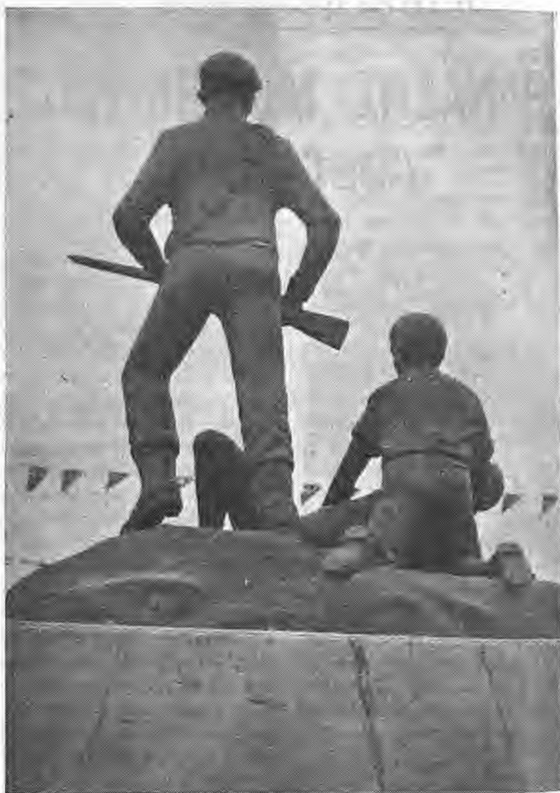
Μνημείο Μιχαήλ Καραολή Λευκωσία Κύπρος

πτά Α' Βραβεία σε Πανελληνίους διαγωνισμούς και αναρίθμητα Β'.