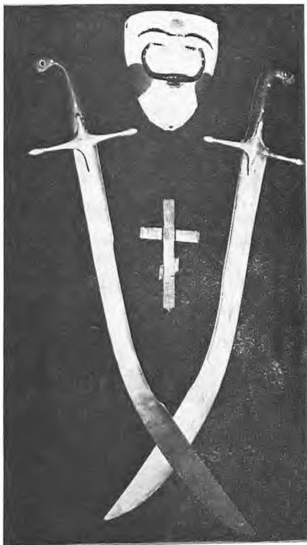
Από την Αρματωσιά του Γιαννίτσαρου α) πρόσωπος, β) οι πάλες και γ) ο σταυρός