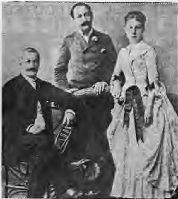
Ο Ψυχάρης με τόν πατέρα του και τη γυναίκα του στην Πόλη τó 1885

Η επανάσταση του 21 δεν έφερε και τις επαναστατικές αλλαγές που χρειάζονταν για την επίλυση του γλωσσικού. Αντίθετα κύμα γλωσσικού εξαρκαϊσμού σκέπασε τη διοίκηση, την εκπαίδευση και τη λογοτεχνία του νεαρού κράτους. Αξίζει να σημειωθεί ότι το διάταγμα της 31ης Δεκεμβρίου 1836 καθόριζε ότι στην πρώτη τάξη του Δημοτικού έπρεπε να διδάσκονται 12 (δώδεκα) ώρες Αρχαία Έλληνικά και καμία Νέα! Το σύνολο των πολιτικών, των λογίων και των λογοτεχνών πίστευε στην αναγκαιότητα επιτροφής στην αρχαία γλώσσα, ως μοναδική διέξοδο απ' τα αδιέξοδα της χώρας. Είναι φανερό ότι θρυσκόμαστε μπροστά σ' ένα μοναδικό φαινόμενο φυγής από την πραγματικότητα, που είχε άλλθριες επιδράσεις σ' όλους τους τομείς της ζωής και, το κυριότερο, οδηγούσε τα λαό σε πνευματική και πολιτιστική καθυστέρηση. Ήταν σχεδόν αδύνατο για τόν απλό πολίτη να διαβάσει ακόμα και μιά κ καθημερινή έφημερίδα, όπου η κυριαρχία των δοτικών και των άπαρεμφάτων ήταν απόλυτη. Εικόνες κωμικοτραγικές ξετυλίγονταν στα δικαστήρια, όπου κανείς δεν καταλάβαινε κανένα, ενώ οι νόμοι και τα διατάγματα του κράτους χρειάζονταν ειδικευμένους μεταφραστές για να κατανοηθούν. Στο χώρο της έπισημής ή κυριαρχίας της γλώσσας των προγόνων μας ήταν πλήρης, ενώ στη λογοτεχνία ο ρομαντισμός έδινε έλληνοτυμένους στίχους του τύπου: