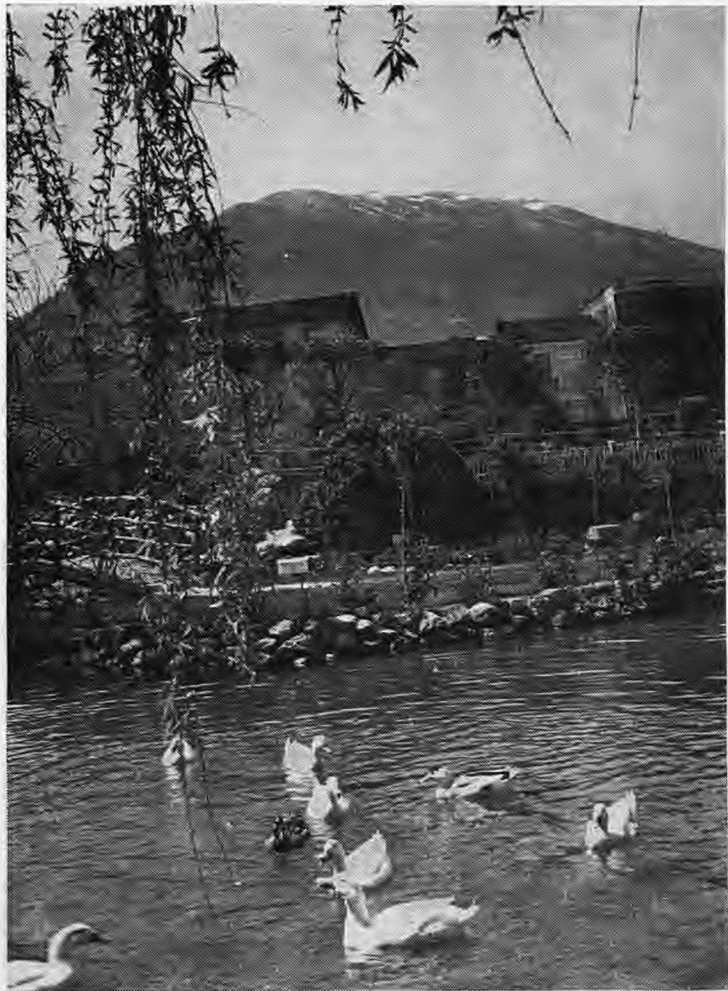
ΤΟ ΠΑΡΚΟ ΤΗΣ ΝΑΟΥΣΗΣ