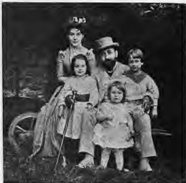
'Ο Ψυχάρης μέ τή γυναίκα του και τόν παιδιά του στην έξοχή

'Ο 'Αττικισμός (έτσι ονομάζεται ή κί-νηση γιά έπιστροφή στην καθαρή 'Ατ-τική) είναι ή άρχή τής κακοδαιμονίας τής γλώσσας μας, πού ονομάζεται δι-γλωσσία και χρονολογικά τοποθετείται στους πρώτους αιώνες μετά τόν Χριστό. Σ' αυτός τούς αιώνες οι λόγιοι υιοθέ-τησαν (σχεδόν άπόλυτα) τόν 'Αττι-κισμό και έγραψαν τόν έργα τους σέ μιá γλώσσα πού άδυνατούσε νά παρα-κολουθήσει τόν έξελικτικό δρόμο τής λαϊκής γλώσσας και εύκολα άποκόπη-κε άπ' αυτήν. Αυτό είχε οάν άποτέλε-σμα νά κυριαρχήσει ή 'Αττική σ' όλα τόν είδη του γραφτού λόγου, κι άργό-τερα νά γίνει έπίσημη γλώσσα του Βυ-ζαντινού κράτους, ενώ ή λαϊκή γλώσ-