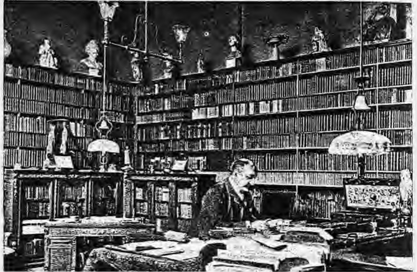
Ὁ Γιάννης Ψυχάρης (ποῦ στὴ φωτογραφία αὐτὴ εἰκονίζεται στὸ γραφεῖο του), ἀκαταπόνητος ἐπιστήμονας γλωσσολόγος καὶ λογοτέχνης, ἠπήρξε ταυτοχρόνα καὶ ὁ γενάρης τῆς δημοτικιστικῆς ἰδέας.

1904: Καθηγητὴς τῆς γλωσσολογίας στὴ Σχολὴ Ἀνατολικῶν Γλωσσῶν τῆς Σορβόνης. Παίρνει τὴν ἔδρα τοῦ δασκάλου τοῦ Λεγκράν.