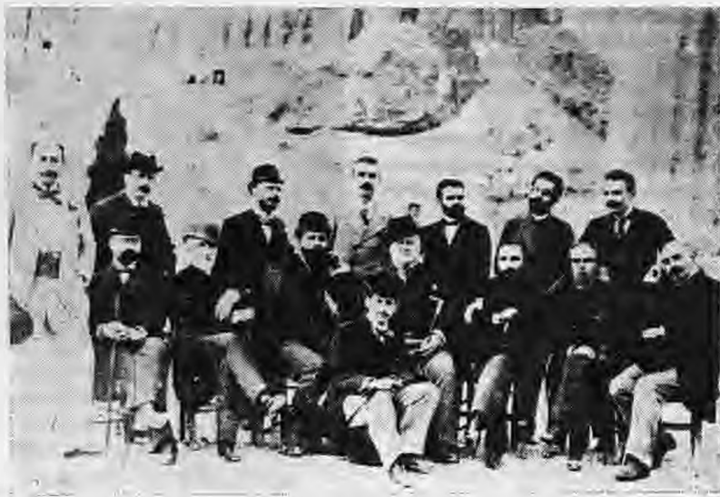
Μιά ιστορική φωτογραφία (Νοέμβριος 1893) του Ψυχάρη με άλλους όνομαστούς λόγιους και λογοτέχνες κάτω από τήν Ακρόπολη. Αναλυτικότερα. "Ορθοί απ' αριστερά πρός τό δεξιό: Ψυχάρης, Δ Κακλαμώνας, Κ Κοσδώνης, Γ Βλαχεγιάννης, Κ Παλαμός, Γ Δροσίνης Γρ. Ξενόπουλος. Καθιστοί: Θ Βελλιαμίτη* (: ) Περρής, Ν Πολίτης, Στ. Στεφάνου, Μ. Λόμπρος, Γ. Σουρής, Εμ. Ροΐδης, Έμ. Λυκούδης

Πρώτοι οι λογοτέχνες υιοθέτησαν τή δημοτική στά έργα τους, γεγονός πού ώδήγησε σέ μιάν (ποσοτική και ποιτική) άνθιση του πεζού και του ποιητικού λόγου και έδωσε τή δυνατότητα σέ μεγάλους εργάτες του λόγου (Πα-