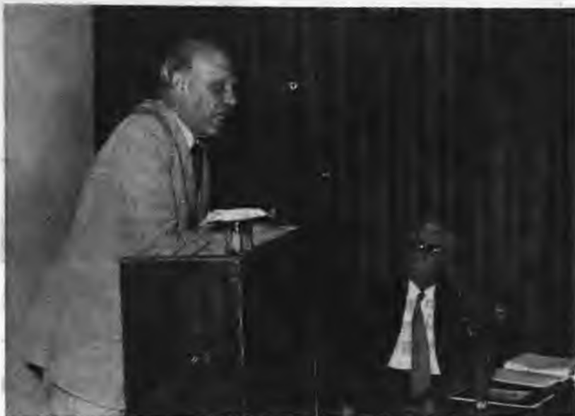
Ο ύπουργός Β. Ελλάδος κ. Ν. Μάρτης όμιλει στους συνέδρους. Δεξιά ο προϊστάμενος τής υπηρεσίας Γεωργικών Έρευνών του ύπουργείου Γεωργίας κ. Γεώργιος Μπουρνώνας