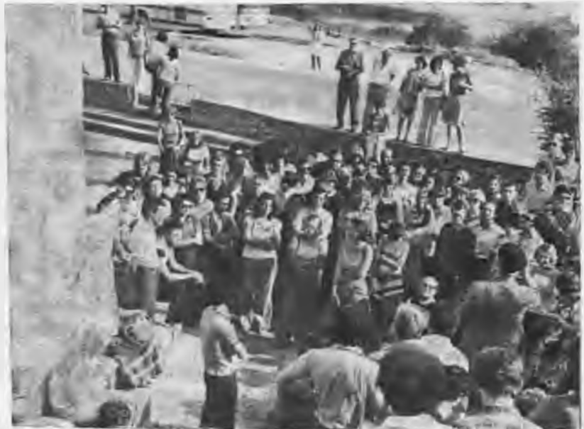
Αύγουστος 1977. Ένα τμήμα σπουδαστών του «Διεθνούς Θερινού Προγράμματος» του ΙΜΧΑ στο Λέοντα της Αμφιπόλεως. Διακρίνεται, μεταξύ των σπουδαστών, ο αρχαιολόγος καθηγητής Φώτιος Πέτσας (με το νότο στο φικό) ενώ έπεςχνεί τα ιστορικά πλαίσια της τοποθεσίας. Μεταξύ των όκροστών του ο καθηγητής Θεοφάνης Σταύρου

Ακολουθεί η τεράστια εργασία των μαθημάτων τον μήνα Αύγουστο. Οι επιστημονικοί συνεργάτες του ΙΜΧΑ διδάσκουν τρεις ώρες καθημερινά την ελληνική γλώσσα. Είναι αλήθεια ότι μετά ένα μήνα έντασης εργασίας, παρόλη την αυγουσιάντικη ζέση της Θεσσαλονίκης, τα αποτελέσματα είναι καταπληκτικά. Οι σπουδαστές, επειδή οι περισσότεροι έχουν ανεπτυγμένο επιστημονικό ενδιαφέρον αλλά και γερές θέσεις στην ελληνική γλώσσα, στα τέλη του Αυγούστου μπορούν να εκφράζονται: στο γραπτό και στον προφορικό λόγο στην γλώσσα μας. Μετά από το καθημερινό τρίωρο μάθημα της ελληνικής γλώσσας οι σπουδαστές παρακολουθούν 2 ώρες γενικά μαθήματα ελληνι-