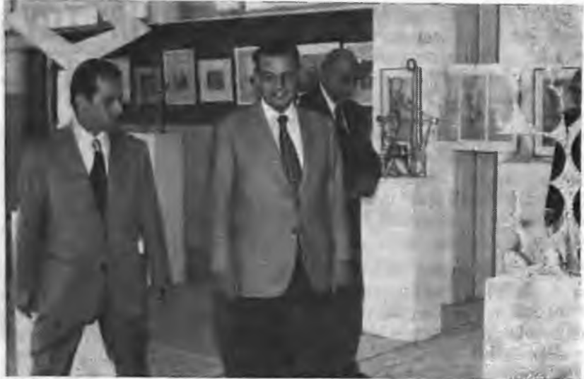
Ὁ ὑπουργὸς Παιδείας κ. Ἰωάννης Βαρθιτσιώτης, ὁ γεν. γραμματεὺς Β.Ε. κ. Ἄγγελος Βαλιτσῶρος καὶ ὁ ἐπιθεωρητὴς Δημοτικῆς Ἐκπαίδευσης κ. Πασχάλης Τσοκίρης ἐπισκέπτονται τὴν ἐκθεση.

Τὴν ἐκθεση ἐπισκέφθησαν ὁ ὑπουργὸς παιδείας κ. Ἰωάννης Βαρθιτσιώτης, ὁ γενικὸς γραμματέας Β. Ἑλλάδος κ. Ἄγγελος Βαλιτσῶρος, ὁ δήμαρχος κ. Δημ. Βλάχος οἱ ἀρχεὲς τοῦ τόπου καὶ πλῆθος κόσμου.