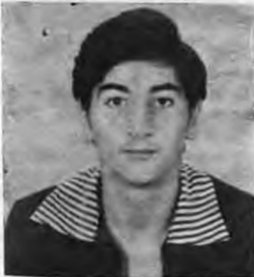
Γεννήθηκε τὸ 1964 στὴ Νάουσα. Εἶναι μαθητὴς τῆς Γ΄ Γυμνασίου. Πῆρε τὸ τρίτο βραβεῖο στὸ διαγωνισμὸ ποιήματος μὲ τὸ ἔργο «Τὸ παιδί»