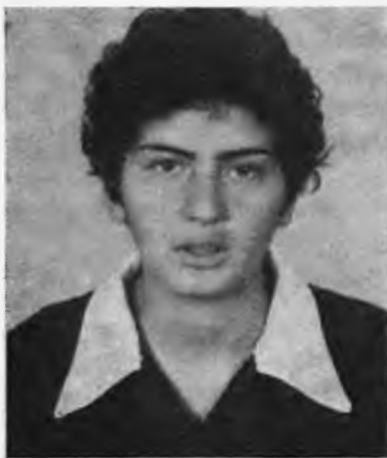
Γεννήθηκε στὴ Νάουσα τὸ 1964. Είναι μαθήτριά της Γ΄ Γυμνασίου. Πήρε τὸ τρίτο βραβείο στὸ διαγωνισμό διηγήματος μὲ τὸ ἔργο «Διέξοδος»