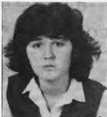
Γεννήθηκε στη Νάουσα τὸ 1965. Είναι μαθητριά της Β΄ Γυμνασίου. Πήρε τὸ δεύτερο βραβείο στὸ διαγωνισμό διηγήματος μὲ τὸ ἔργο «Τὰ πρῶτα θήματα»