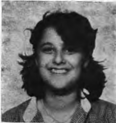
Γεννήθηκε στὴ Νάουσα τὸ 1964. Πηγαίνει στὴν Γ΄ τάξη Γυμνασίου Πῆρε τὸ δεύτερο βραβεῖο στὸ διαγωνισμὸ ποιήματος μὲ τὸ ἔργο «Προσδοκίες»