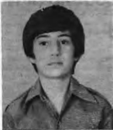
Γεννήθηκε τὸ 1966 στὴ Νάουσα. Εἶναι μαθητὴς Β΄ τάξεως Γυμνασίου. Πῆρε τὸ πρῶτο βραβεῖο στὸ διαγωνισμὸ ποιήματος μὲ τὸ ἔργο «Ἡ ψυχούλα»