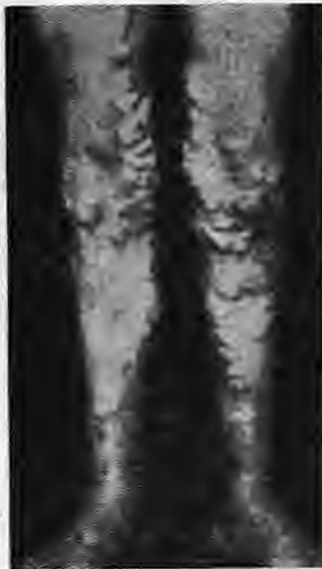
Κίρσοι της έσω σαφηνούς φλεβός

Υπάρχουν και φλέβες που ένωζονται τό δύο αυτά δίκτυα, οι φλέβες αυτές λέγονται διατρηίνουσες φλέβες. Τό επιφανειακό δίκτυο αποτελείται από δύο φλέβες. Μία που βρίσκεται στην πρόσθια πλευρά του ποδιού άνεβαίνει στη ρίζα του και λέγεται έσω σαφηνής φλέβα και μία που βρίσκεται στην έξωτερική πλευρά του ποδιού φθάνει στην άρθρωση του γόνατος και εξαπλώνεται μέχρι τόν αστράγαλο και ονομάζεται έξω σαφηνής φλέβα. Οι φλέβες περιέχουν ειδικές βαλβίδες κατανεμημένες σε τμήματα μικρού ύψους που άνοιγουν από κάτω προς τό επάνω και ή άνοδος του αίματος επιτυγχάνεται μέ τις συσπάσεις του τοιχώματος αυτών, ενώ συγχρόνως οι βαλβίδες συγκλείονται έμποδίζοντας τήν φυγή του