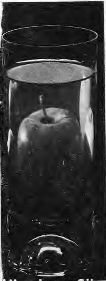
Τοῦ κ. Νικ. Θεοδωρίδη Τεχνολόγου τροφίμων τοῦ ἐργ. «ΒΕΡΜΙΟΝ ΝΑΟΥΣΑ»

αὐτὸ αἰτιολογεῖται μὲ τὰ παρακάτω λίγα καὶ ἀπλᾶ λόγια: