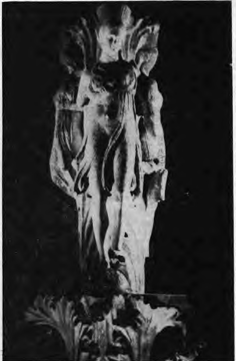
Οἱ χορεύτριες τῶν Δελφῶν

«Στῶν Μηριμίδων τὶς σκητὲς ἐ- φθάσαν εἰς τὰ πλοῖα καὶ ἦβραν αὐτὸν τὸ πνεῦμα του νὰ τέρπη μετ' ἑλπίαν