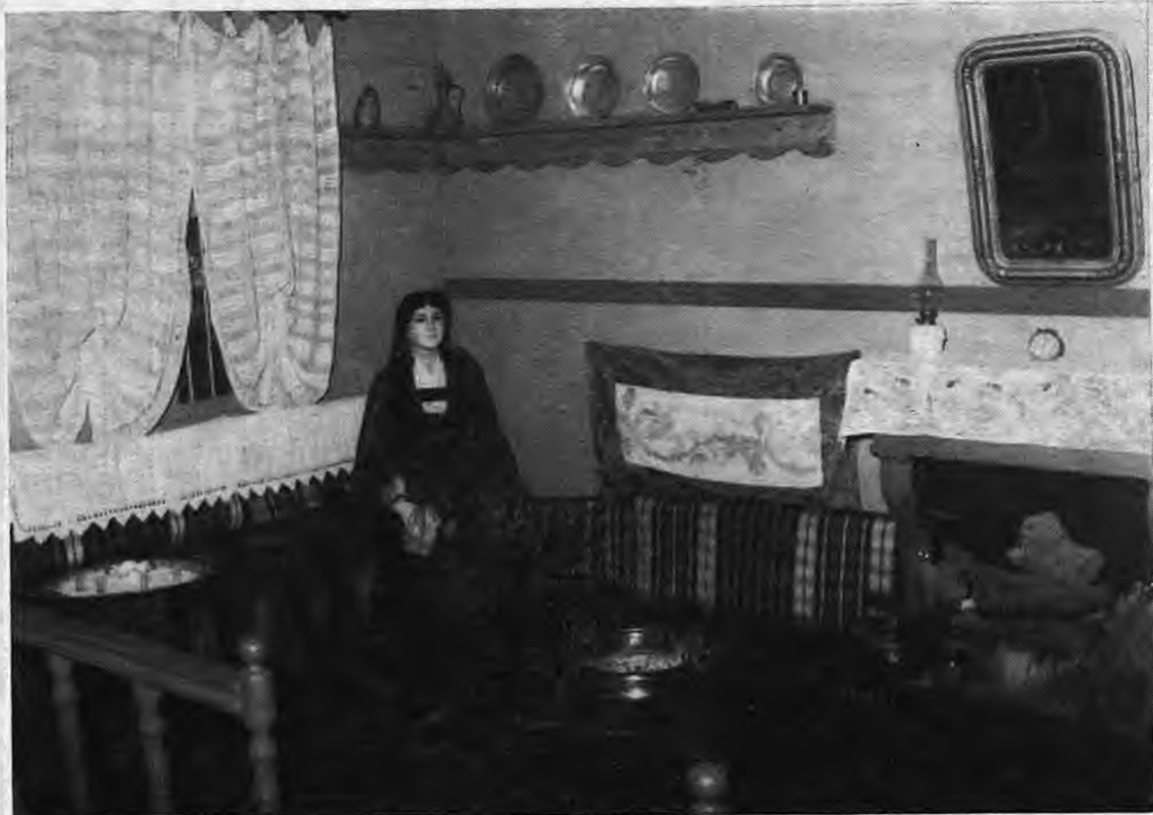
Ό «ΟΝΤΑΣ» Μουσείου Λυκείου Έλληνίδων Ναούσης