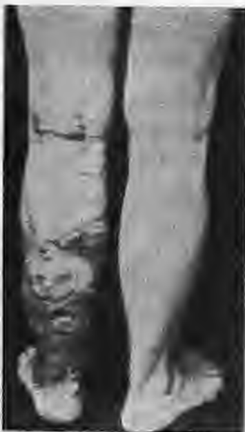
Κίρσοι της έξω-όπισθιας σαφηνούς φλεβός

Δ. ΚΛΙΝΙΚΗ ΕΞΕΤΑΣΗ. Πρώτα θα πάρουμε το ιστορικό του άσθενή. Σε ποιά ηλικία ένεφάνισε τους κίρσους. Εάν μας άναφέρει ότι παρουσίασεν κίρσους σε νεαρή ηλικία θα σκεφθούμε την ύπαρξη άρτηριοφλεβώδους επικοινωνίας. Όταν ο άσθενής άναφέρει ότι πάσχει από έλκώδη κολίτιδα ή ότι είναι