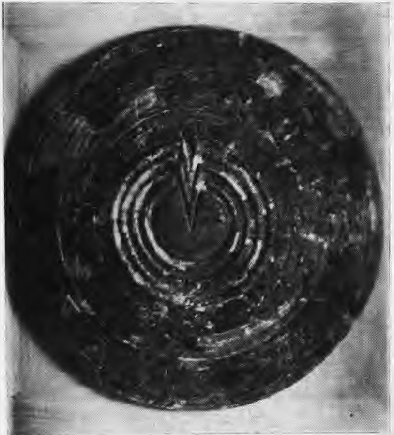
Ἀσπίδα ἀπὸ τοὺς Δελφοὺς.

τραγούδι καὶ ὁ χορὸς στὴν Ἰλιάδα τοῦ Ὁμήρου.