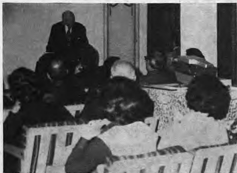
Από την διάλεξη του Λυκείου Έλληνίδων Ναούσης στην αίθουσα του Πνευματικού Κέντρου Ναούσης με θέμα «Ξυλογλυπτική 18ου – 19ου αιώνα»