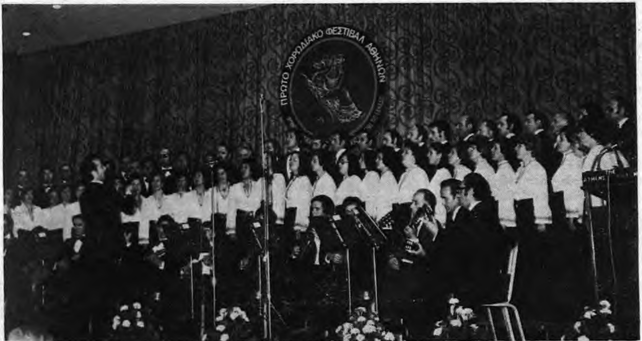
Ἀπὸ τὴν ἐμφάνιση τοῦ Ὁδείου μας στὸ Α' Χορωδιακὸ Φεστιβάλ τῶν Ἀθηνῶν