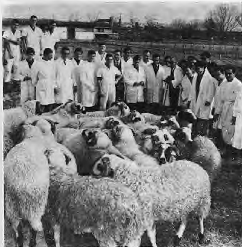
Πρακτική εξάσκηση των φοιτητών της Κτηνιατρικής Σχολής στον Σταθμό Έρευνας Κτηνοτροφίας Διαβατιών

στηκε σιά πανεπιστημιακά του καθήκοντα και άσχολήθηκε έντακτο με την άνοικοδόμηση των κτιρίων της Κτηνιατρικής Κλινικής. Για την άπαλλοτρίωση των οικοπέδων της Κτηνιατρικής Σχολής άποκρεώθηκε να παρευρεθεί σέ 17 δίκες.