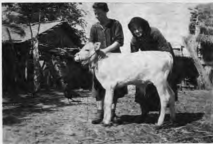
Ο πρώτος μόσχος που γεννήθηκε με τεχνητή σπερματέγχυση στη Σινδο τον Νοέμβριο του 1946

Πήρε το πτυχίο το έτος 1930. Πολύ σύντομα διορίζεται και υπηρετεί ως γεωπόνος στο Λάκκα Σούλι της 'Ηπείρου. Εκεί σε λί-