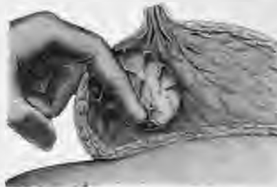
Διάλυση αποστήματος μαστού.

Η συντηρητική θεραπεία συνίσταται στην εφαρμογή θερμών επιθεμάτων και στην χορήγηση αντιβιοτικών. Εάν δεν υποχωρήσουν τα άνωτέρω συμπτώματα εξελίσσεται σε απόστημα του μαστού και τότε επεμβαίνουμε χειρουργικώς και προβαίνουμε στην διάλυση του αποστήματος (Εικόνα 2).