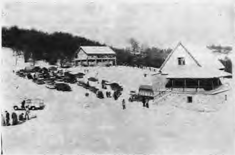
Μία άποψη του καταφυγίου Τριών Πηγαδιών του ΕΟΣ Ναούσης.

Η ανάπτυξη των Πηγαδιών της Ναούσης θεωρείται από τις καλύτερες της χώρας για σκι περιοχές του ελληνικού όρεινου όγκου. Και το μέρος αυτό εξευρέθη, είναι η Έλβετία, η τοποθεσία Τρία Πηγάδια δεν έχει να ζηλέψει τίποτα από τα φημισμένα τοπία των έλβετικών Άλπεων.