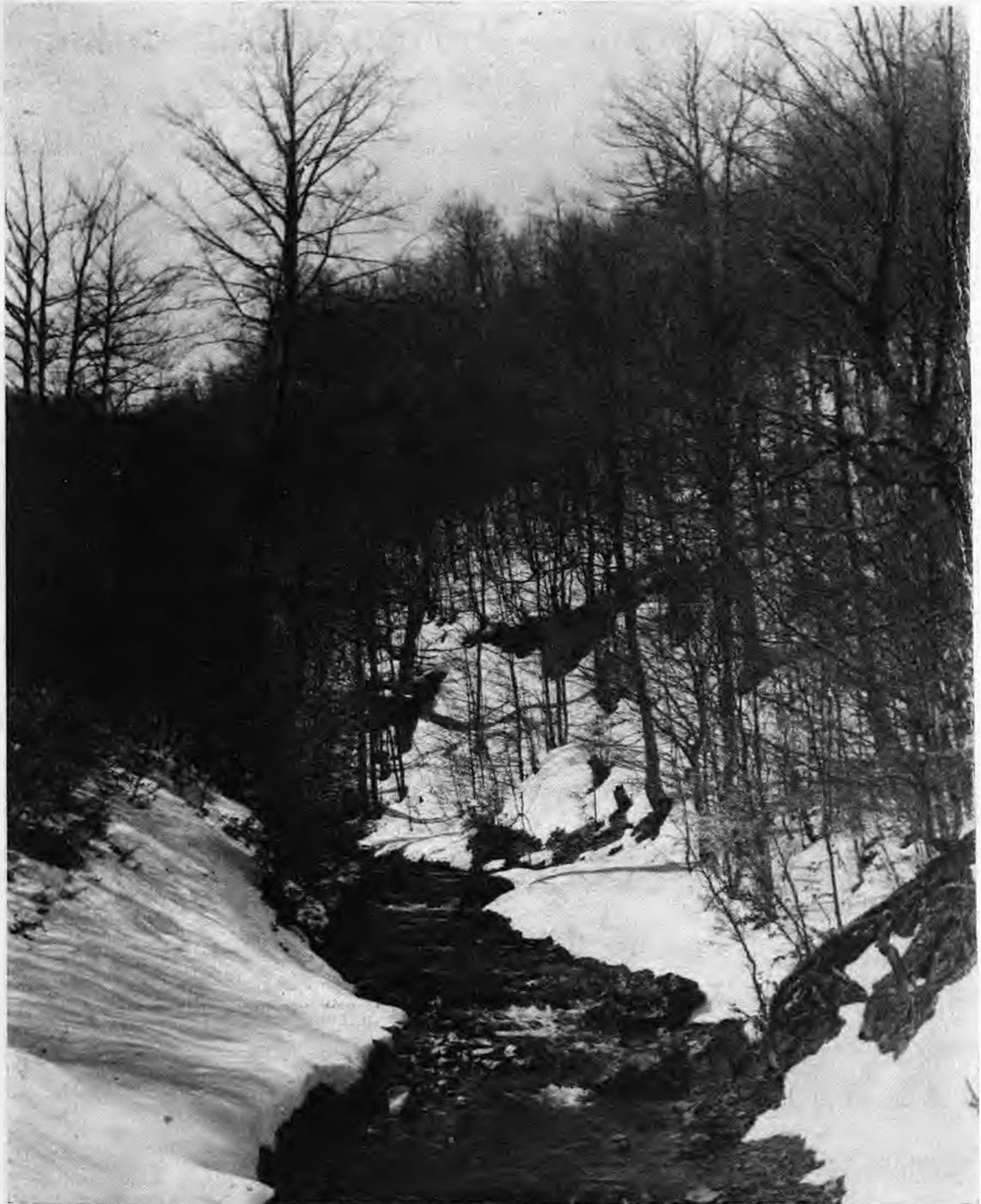
ΤΑ ΓΕΦΥΡΟΥΔΙΑ ΣΤΗΝ ΠΕΡΙΟΧΗ ΤΡΙΑ ΠΗΓΑΔΙΑ

ΤΡΙΜΗΝΙΑΙΟ ΠΕΡΙΟΔΙΚΟ ΤΟΥ ΣΥΛΛΟΓΟΥ ΑΠΟΦΟΙΤΩΝ ΝΑΟΥΣΗΣ