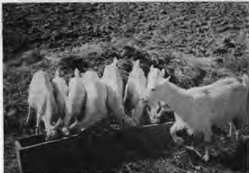
Τα πρώτα έριτρία που γεννήθηκαν στην Ελλάδα το 1952 με τεχνητή σπερματέγχυση.

γο ένα τηλεγράφημα από τον καθηγητή Ίσακίδη. Τον καλεί για συμμετοχή στις εξετάσεις για κάποια ύποτροφία. Τον Αύγουστο του 1930 πετυχαίνει στις εξετάσεις και με ύποτροφία του Υπουργείου Γεωργίας πηγαίνει για σπουδές στην Κτηνιατρική Σχολή της Βουδαπέστης. Έκεί παρακολουθούσε τα μαθήματα βοηθούμενος από την γαλλική γλώσσα. Τελείωσε τις σπουδές του το 1934. Το Υπουργείο Γεωργίας παρέτεινε την ύποτροφία του επί ένα έτος για την ειδικευση εις την αναπαραγωγή των ζώων. Το έτος 1935 έλαβε το δίπλωμα του διδάκτορος από το πανεπιστήμιο της Βουδαπέστης.